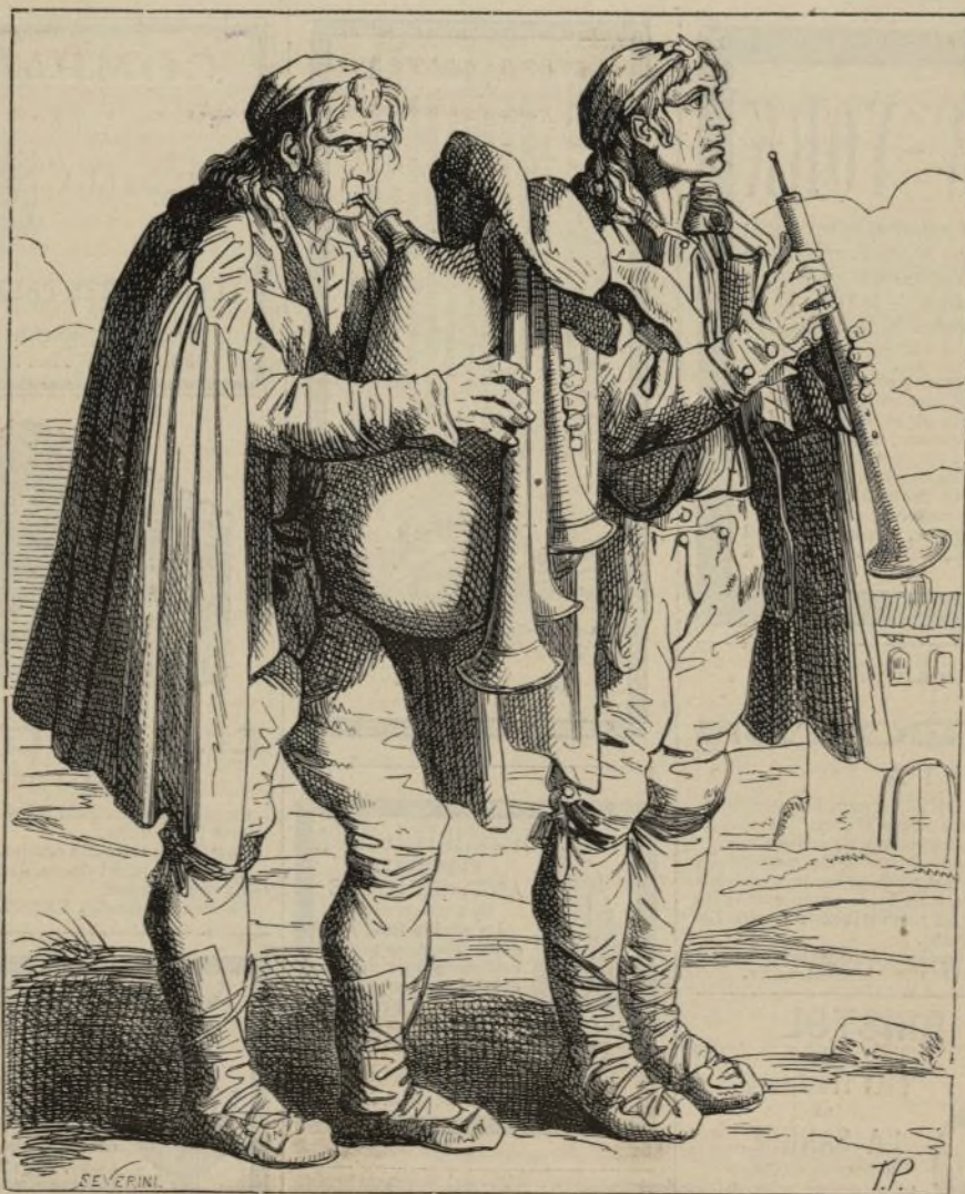
LOS PIFARARI (facsimile de una agua fuerte de Pinelli).

MADRID. — TIPOGRAFÍA GUTENBERG, Villalar, 5.