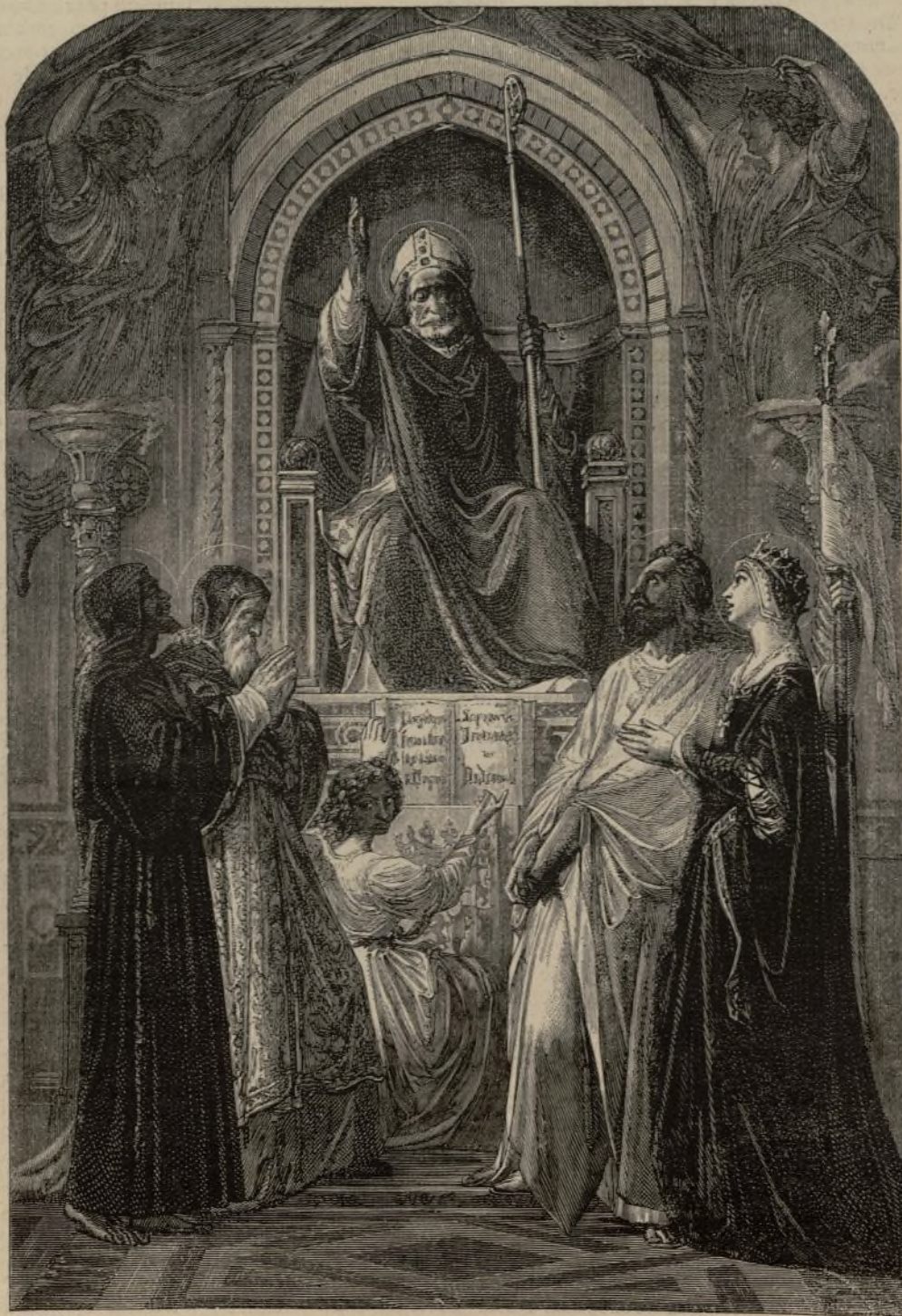
LA INTERCESION (cuadro de Palmaroli).