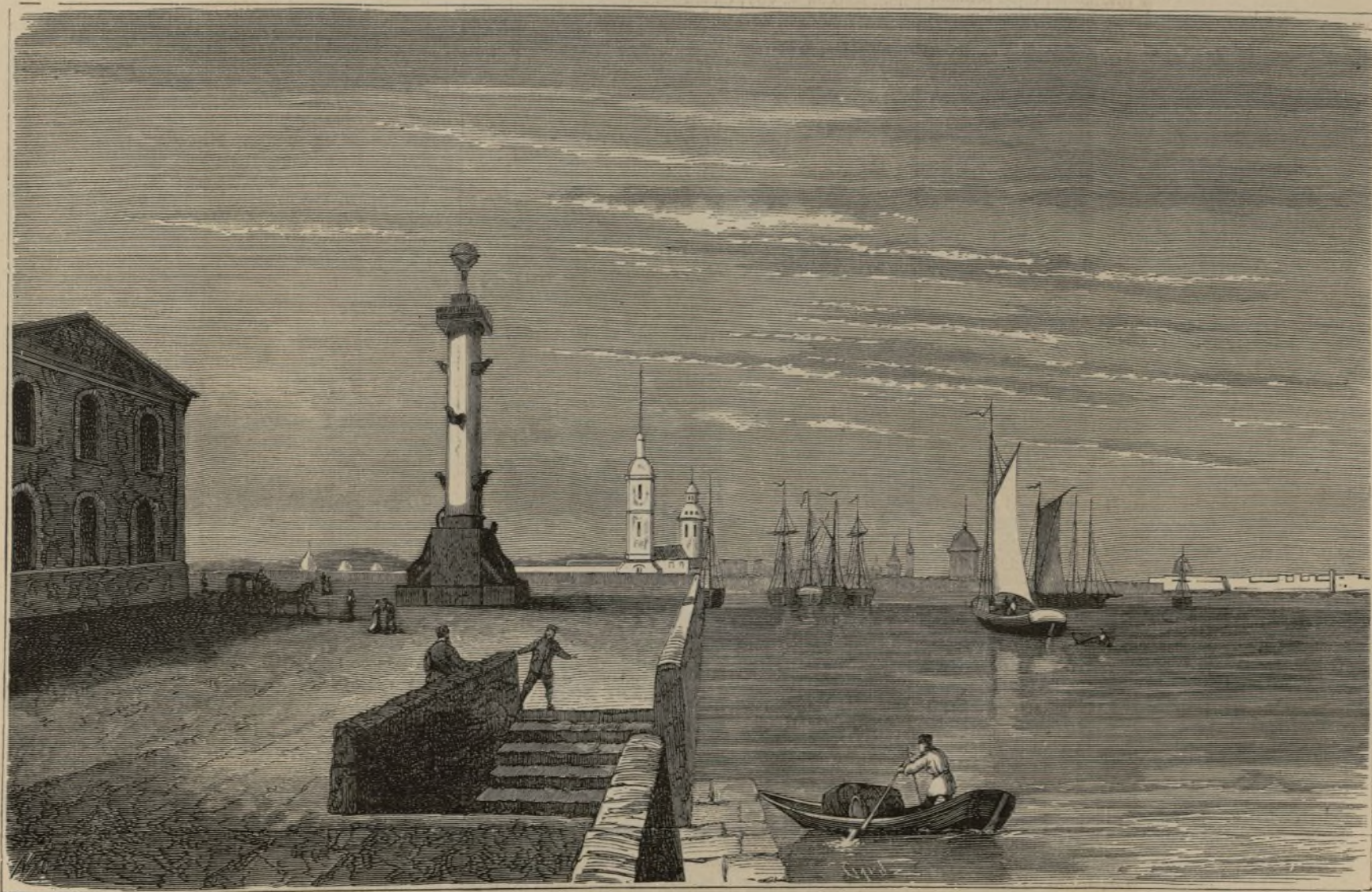
FUERTE É IGLESIA DE SAN PEDRO Y SAN PABLO EN SAN PETERSBURGO.

Su doble manía era, pues, ver asesinos que lo seguían, y creerse amado por Juana. ¡Cómo se venga Dios!