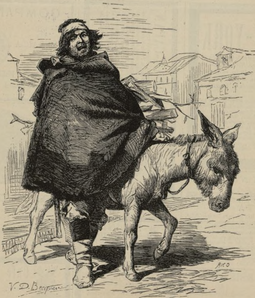
CAMPESINO DE LAS CERCANÍAS DEL BURGO DE OSMA. (Dibujo del natural, por Becquer.)

CHINA. Según comunicaciones enviadas por los misioneros de este Imperio á la Propaganda de la Fe, durante el año que viene el hambre seguirá causando gran número de víctimas en algunos distritos completamente faltos de lluvia. Los misioneros imploran los auxilios de los europeos en favor de las poblaciones visitadas por el terrible azote del hambre. En algunas diócesis de Francia y de Italia,