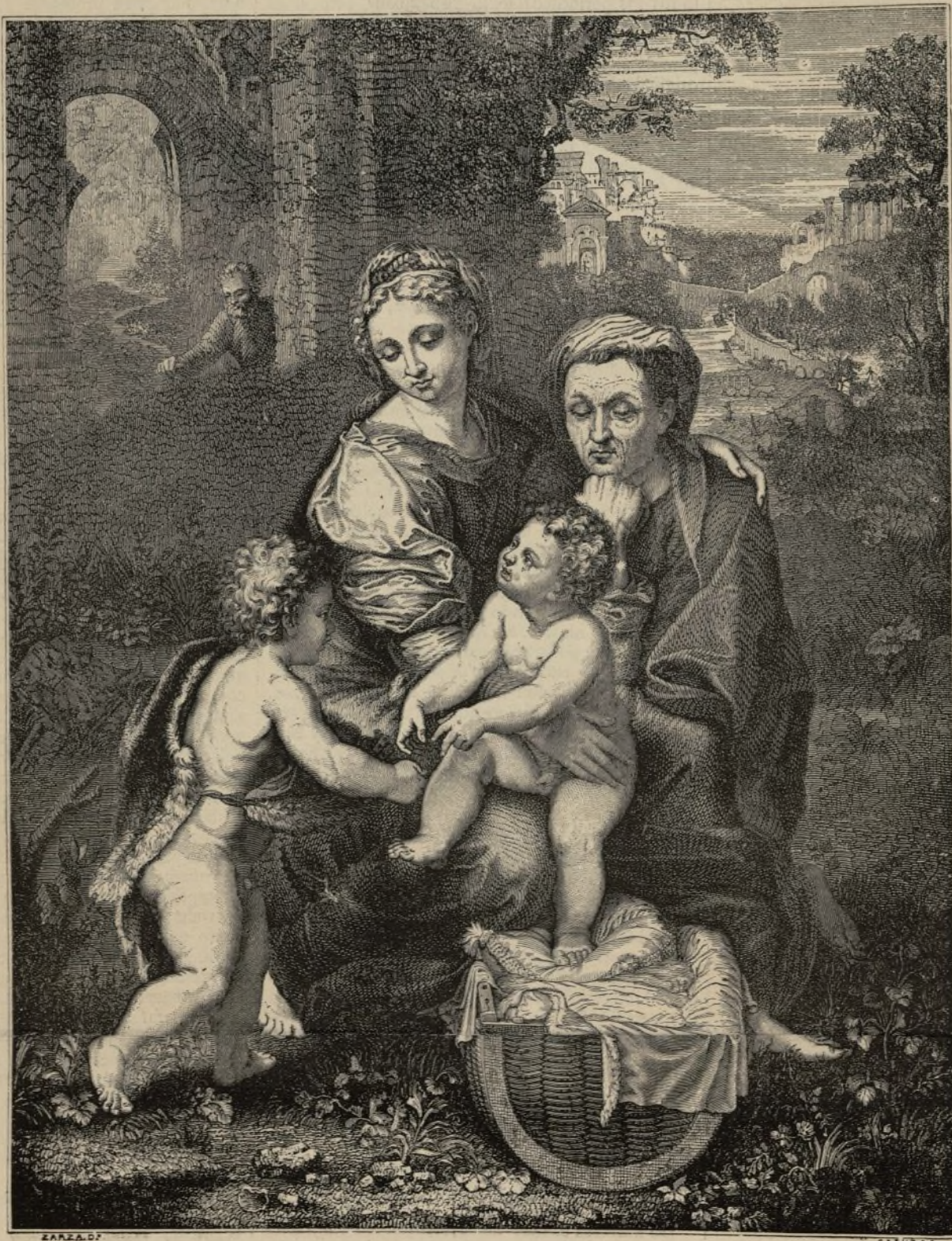
SACRA FAMILIA DE RAFAEL DE URBINO, Conocida con el nombre de La Perla .

Becquer supo coger este tipo tan interesante, y nosotros nos complacemos en llamar la atención de nuestros lectores sobre esta circunstancia histórica, que da mayor valor á nuestro grabado.