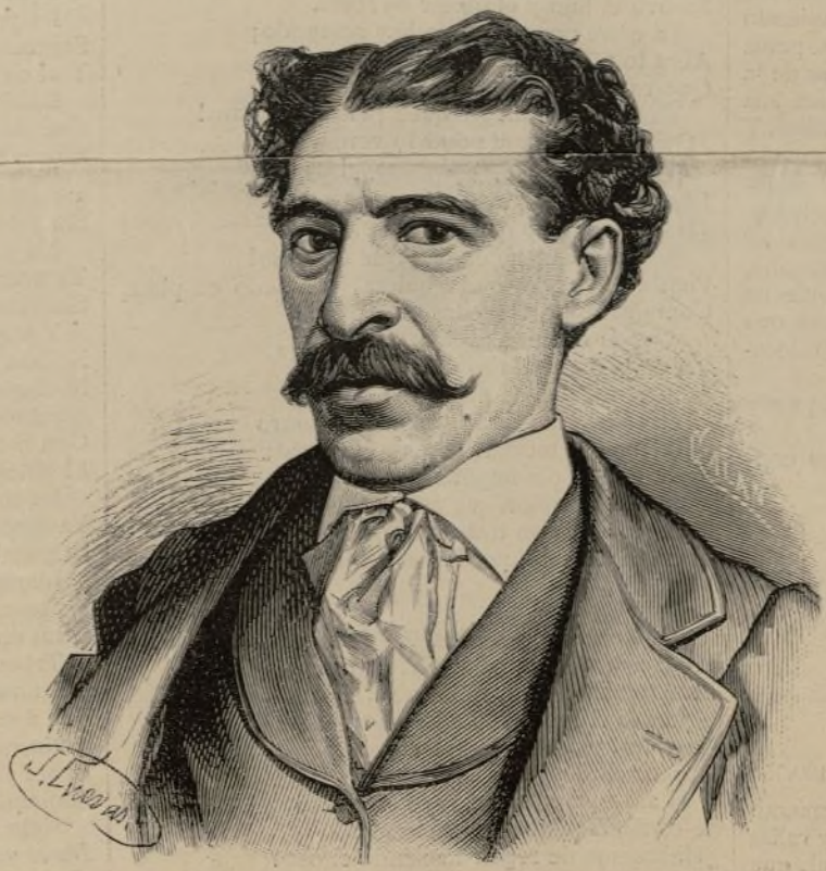
D. JOSÉ SELGAS Y CARRASCO, † el día 5 de Febrero.

Indudablemente el mundo, desde que se cerraron para el hombre las puertas del paraíso, siempre ha sido malo, como que en él cayeron entonces y han fructificado siempre las semillas de todos los pecados; pero difícilmente podrá señalarse una época en su historia de más farsa que la presente, en que no parece