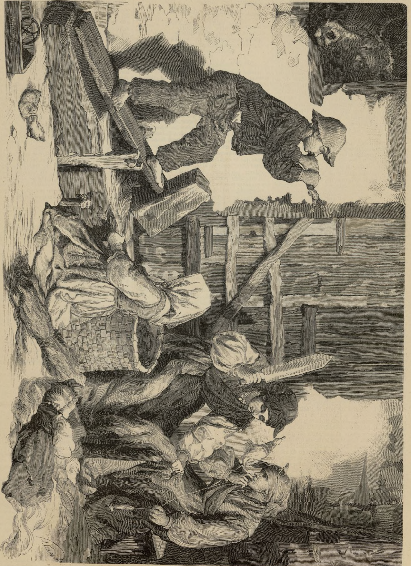
LA ELABORACION DEL LINO EN ASTURIAS (Dibujo del natural por Cuebas).