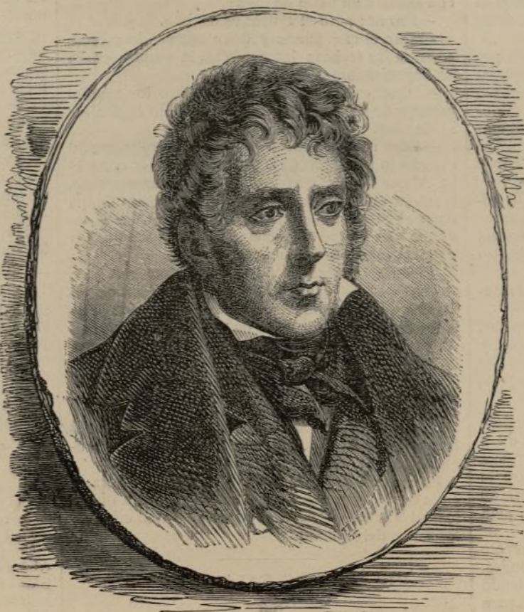
FRANCISCO RENÉ, VIZCONDE DE CHATEAUBRIAND. 14 de Setiembre de 1768. — 4 de Julio 1848.

Mediaba el quinto siglo de la Iglesia cuando subió a ocupar la Cátedra de Roma San Leon el Grande. Refiere un historiador que una noche que este gran Pontífice salía de la gran Basílica de orar con muchos Obispos por las necesidades de la Iglesia, turbada a la sazón por la impiedad de Teodosio el Joven,