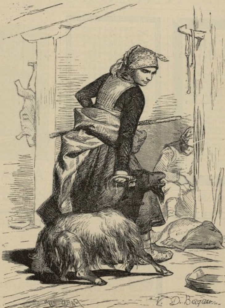
TIPOS NACIONALES. — PASTORA DE LOS VILLACIERVOS, (Dibujo de Becquer.)

ROMA. El día 26 recibió el Papa á una diputa-