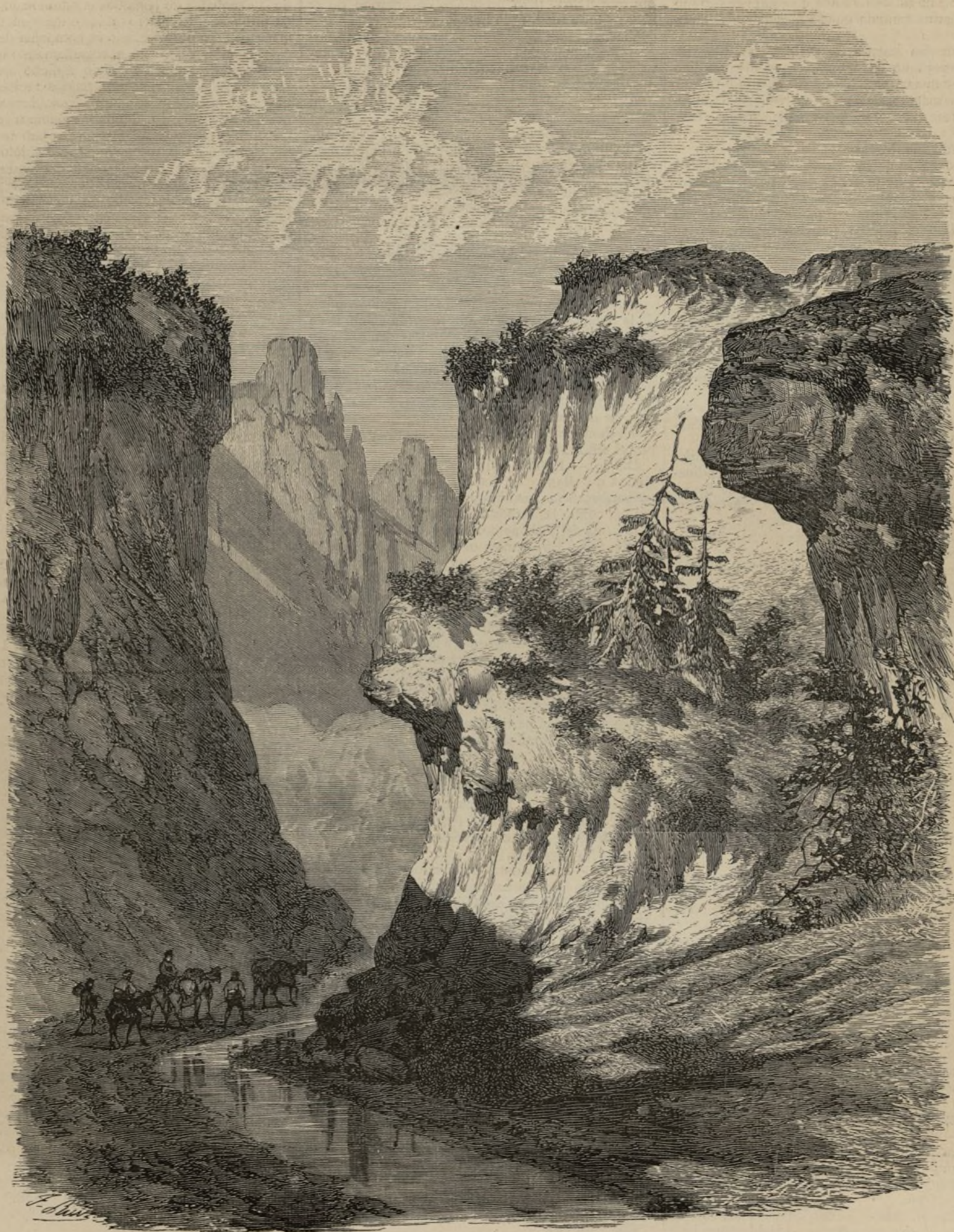
EL PASO DE IONESVALLES.

arquitectura hispano-árabiga aclimatada en España desde el siglo XIII, y á la cual debemos monumentos incontrastables.