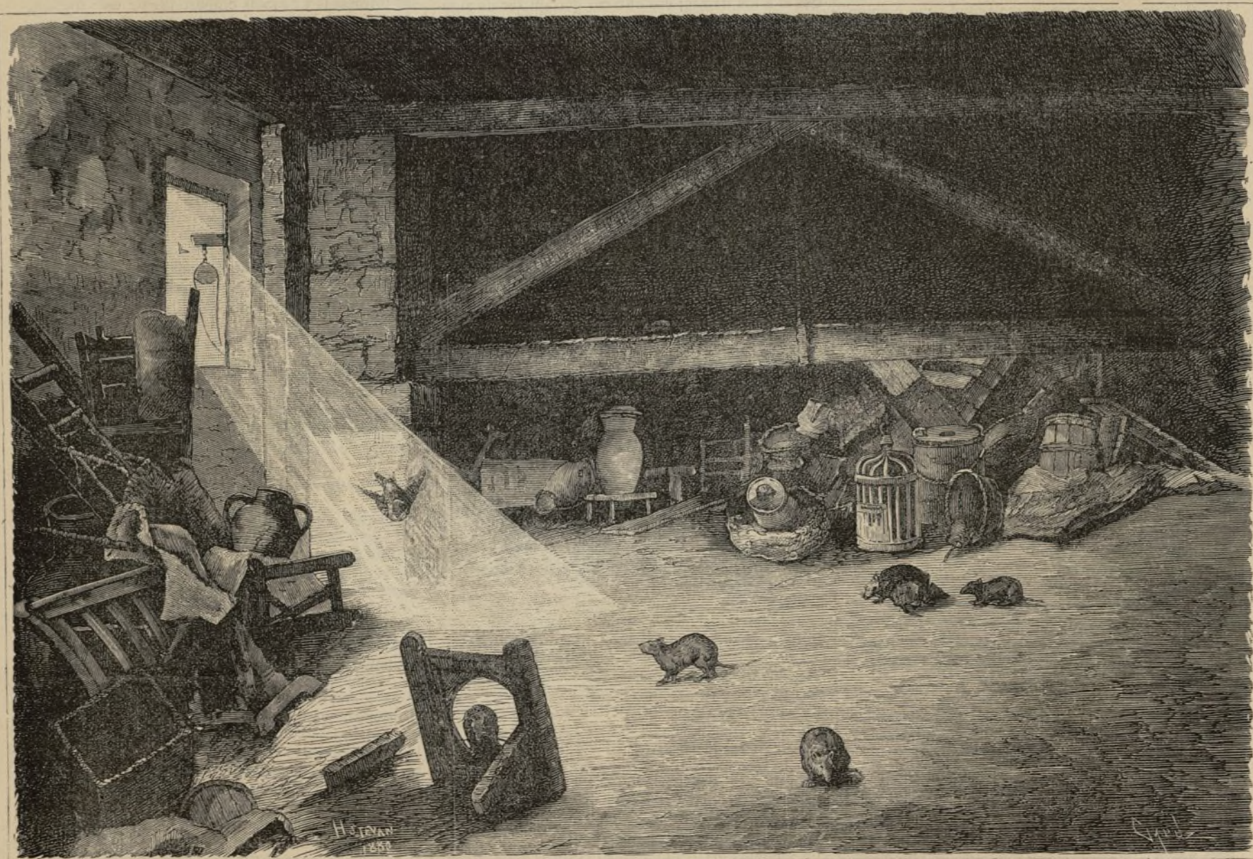
SOCIEDADES SECRETAS. — (Dibujo de H. Estéban.)

en latin de las ciencias eclesiásticas, y dando mayor extension y variedad á los estudios, creando un colegio de seminaristas pobres y dando mayor retribucion á los catedráticos; dispuso misiones generales para toda la diócesis, principiando por la capital, en la que no se habían celebrado con ostentacion hacia cerca de cincuenta años, logrando que Padres misioneros de la Compañía de Jesus y Capuchinos misionasen en todas las poblaciones del obispado y en Ceuta, cuya administracion apostólica le está encomendada. Hizo la Visita Pastoral de todo el obispado, principiando por la santa Iglesia Catedral, predicando en todas partes con un celo y actividad que admiran á cuantos presencian de cerca sus trabajos, sin dejar un instante el Gobierno del obispado, que ha despachado constantemente junto con la Pastoral Visita. En 31 de Octubre de 1881 fué nombrado caballero Gran Cruz de la Real Orden americana de Isabel la Católica, y en 9 de Diciembre del mismo año Senador del Reino por la provincia eclesiástica de Santiago de Cuba. Practicó por último personalmente la visita ad limina , emprendiendo el viaje á Roma en el mes de Octubre de 1881, y como coronamiento de sus trabajos