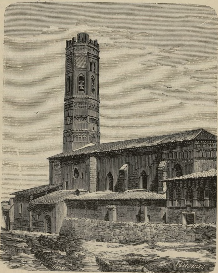
TORRE MUDÉJAR DE TAUSTE, UNA DE LAS CINCO VILLAS DE ARAGON.

MADRID. — TIPOGRAFÍA GUTENBERG, Villalar, 5.