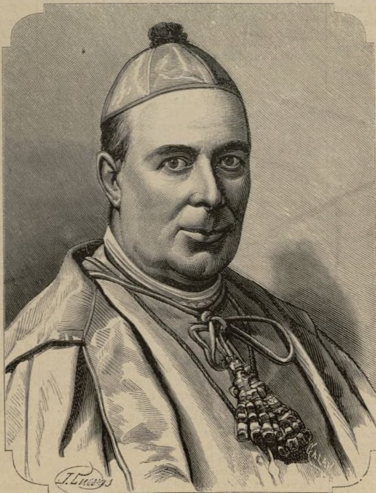
EXCMO. É ILMO. SR. DR. D. JÁIME CATALÁ Y ALBOSA, Obispo de Cádiz.

Hace pocos días que hablábamos de la fecundidad de las obras católicas ejecutadas conforme á la voluntad del Señor, y hoy podemos enlazar lo dicho con el fruto admirable que están dando las santas Misiones celebradas en esta capital, mayor acaso que el de las Cuaresmas anteriores.