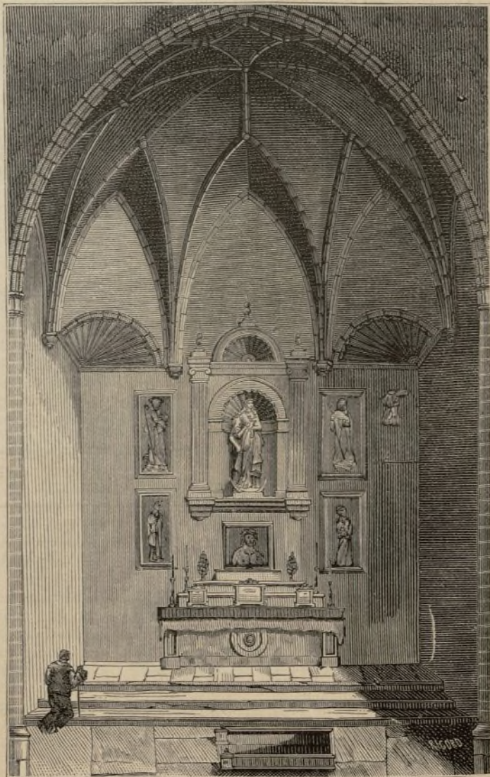
LA ERMITA DE LA FUENSANTA JUNTO AL ARRUINADO MONASTERIO DE SOPETRAN, EN LA ALCARRIA. — EXTERIOR É INTERIOR.