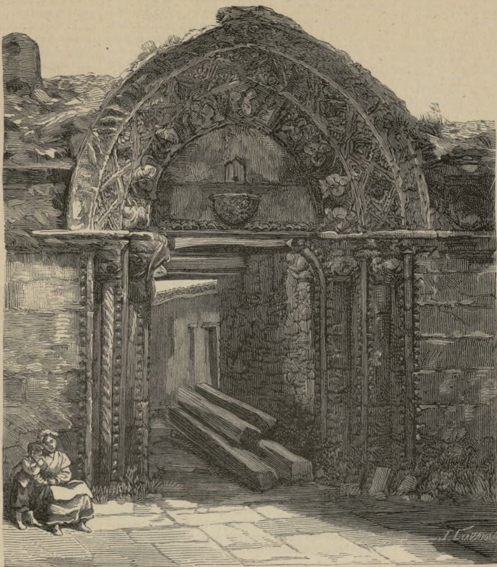
EL PÓRTICO DEL HOSPITAL DE SAN ANDRÉS EN LA CORUÑA.