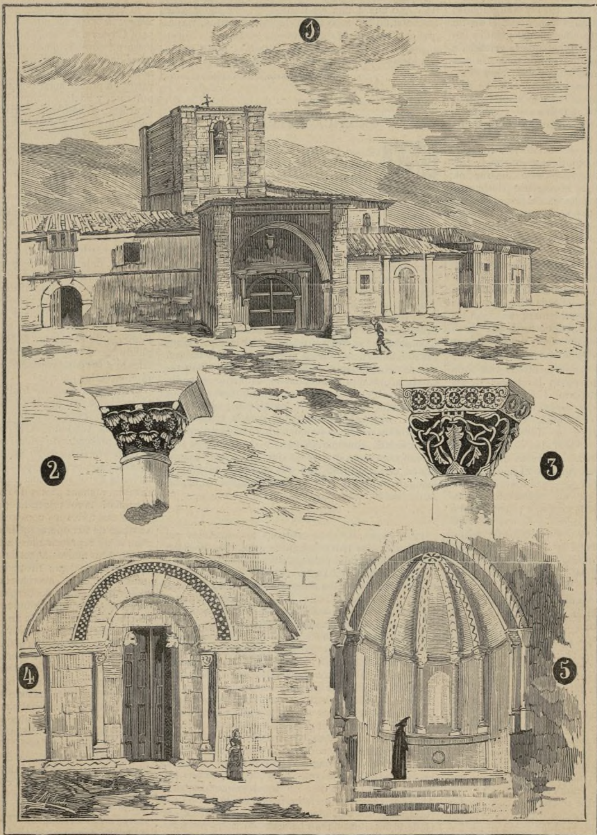
LA COLEGIATA DE ARVÁS EN EL PUERTO DE PAJARES.

amor leyendo las aventuras de Lanceloto, y ponen su ardiente pasión en conocimiento del padre de Francisca, que promete unirlos. Pero la suerte aciaga impide tan bellos proyectos, porque los güelfos, y á su frente Lanciotto Malatesta, hermano de Paolo, sitian á Rimini y se apoderan de la ciudad. Los dos hermanos se encuentran, se injurian y van á resolver sus diferencias con el acero, cuando Francisca aparece, calma al vencedor, que exige como rescate á la novia de su hermano. En el segundo acto pasa por muerto Paolo, y Francisca consiente en casarse con Lanciotto; pero aparece Paolo, y Francisca no