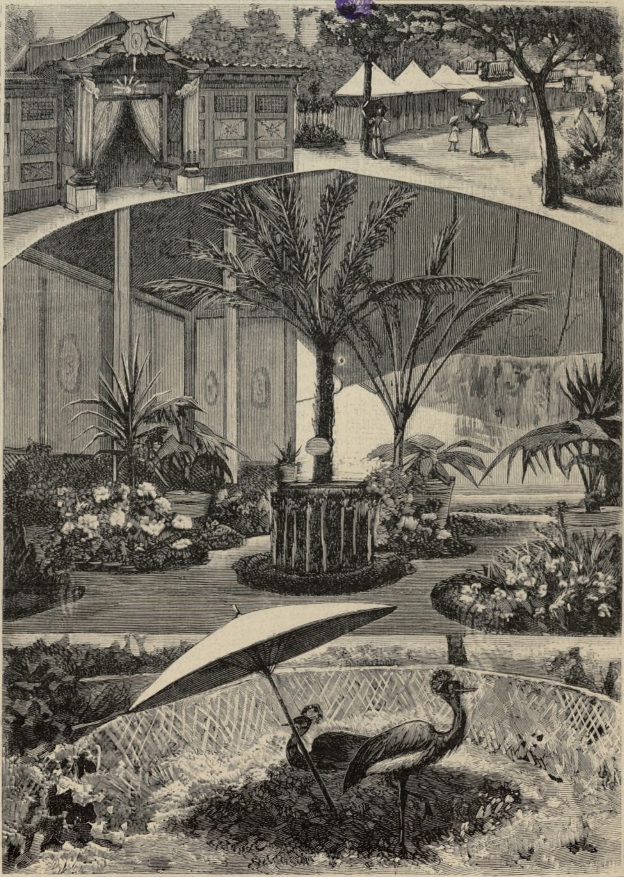
EXPOSICIÓN DE LA SOCIEDAD CENTRAL DE HORTICULTURA.

Pues vivir como tres en un zapato Es cosa que pasó, y ancha Castilla; El que venga detrás que pague el pato.