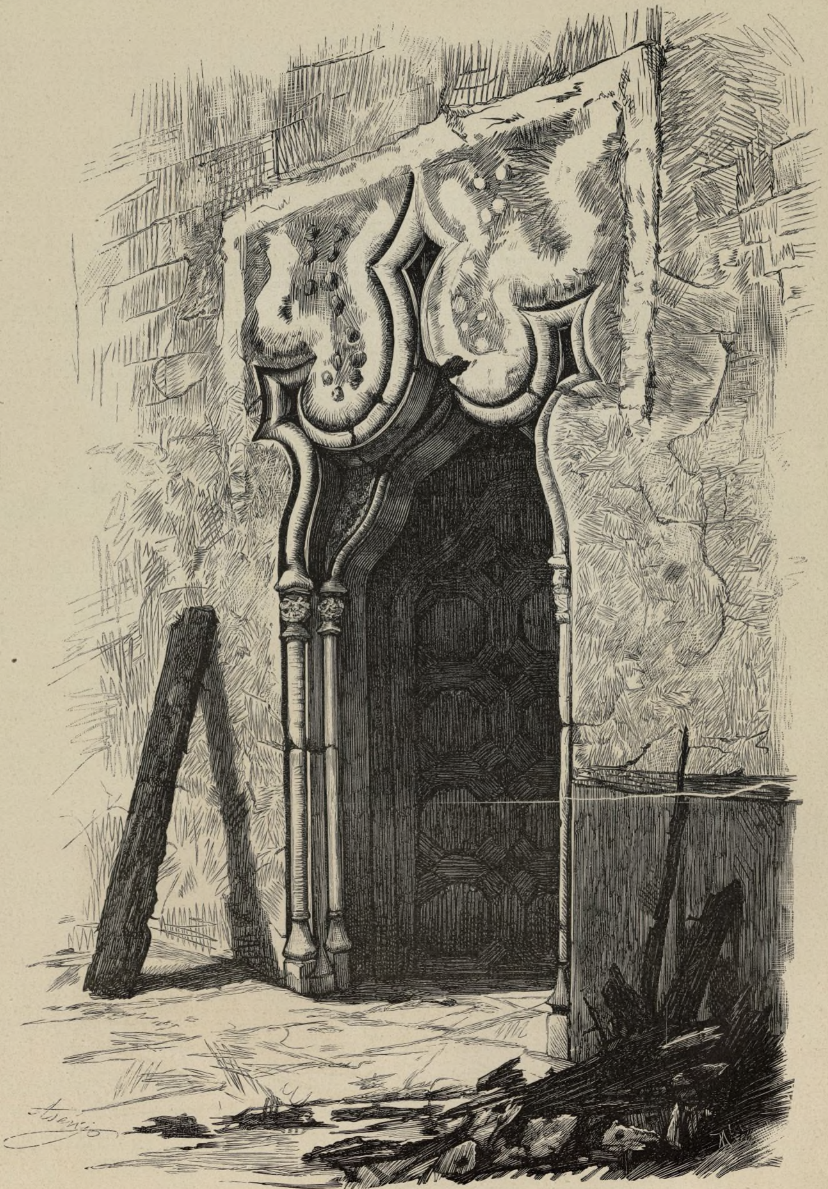
PUERTA LATERAL DEL PALACIO DE MOSEN SORELL, EN VALENCIA, DESTRUIDO POR UN INCENDIO EN MARZO DE 1878.