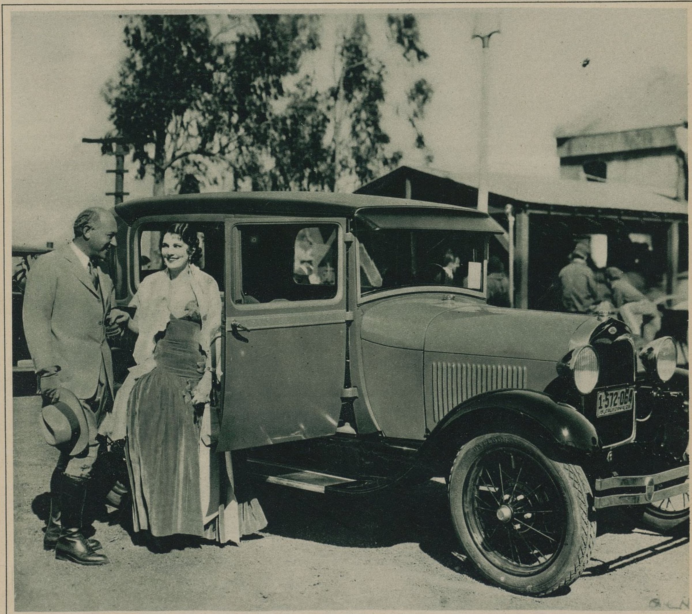
LEATRICE JOY Y CECIL B. DE MILLE SE MUESTRAN ENCANTADOS DE SU PRIMER VIAJE EN EL NUEVO MODELO FORD, QUE LES HA TRASLADADO AL ESTUDIO PARA DAR COMIENZO AL TRABAJO DEL DÍA. DE MILLE DIRIGE ACTUALMENTE «LA MUCHACHA SIN DIOS», MIENTRAS LA BELLA EX ESPOSA DE JOHN GILBERT INTERPRETA EL PAPEL PRINCIPAL EN «MUJERES HECHAS POR LOS HOM-BRES» QUE DIRIGE PAUL LUDWIG STEIN

"No creo en el porvenir del film parlante, porque equipararía el cinema al teatro de barrio pobre y le quitaría su calidad de lenguaje internacional."