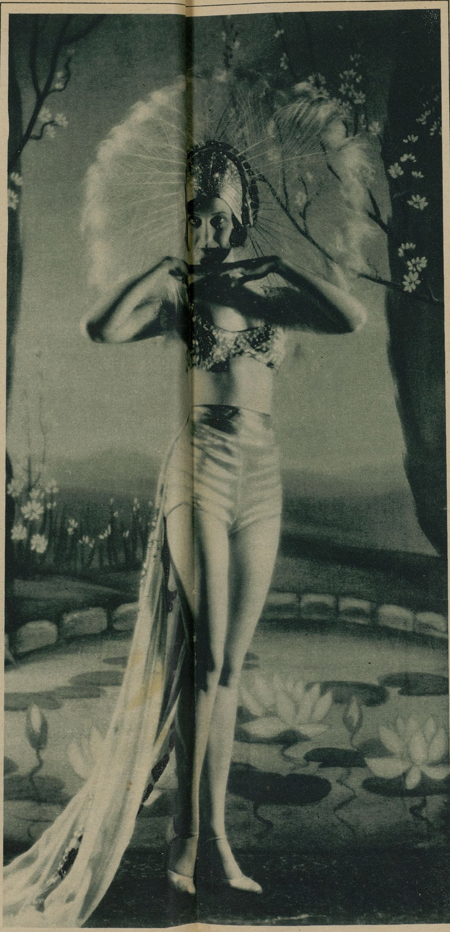
LA BELLÍSIMA DORIS HILL, RECIENTE Y VALIOSA ADQUISICIÓN DE LA CASA PARAMOUNT, PARECE QUERER IMITAR, CON ESTE SINGULAR INDUMENTO, AL ORGULLOSO PAVO REAL.