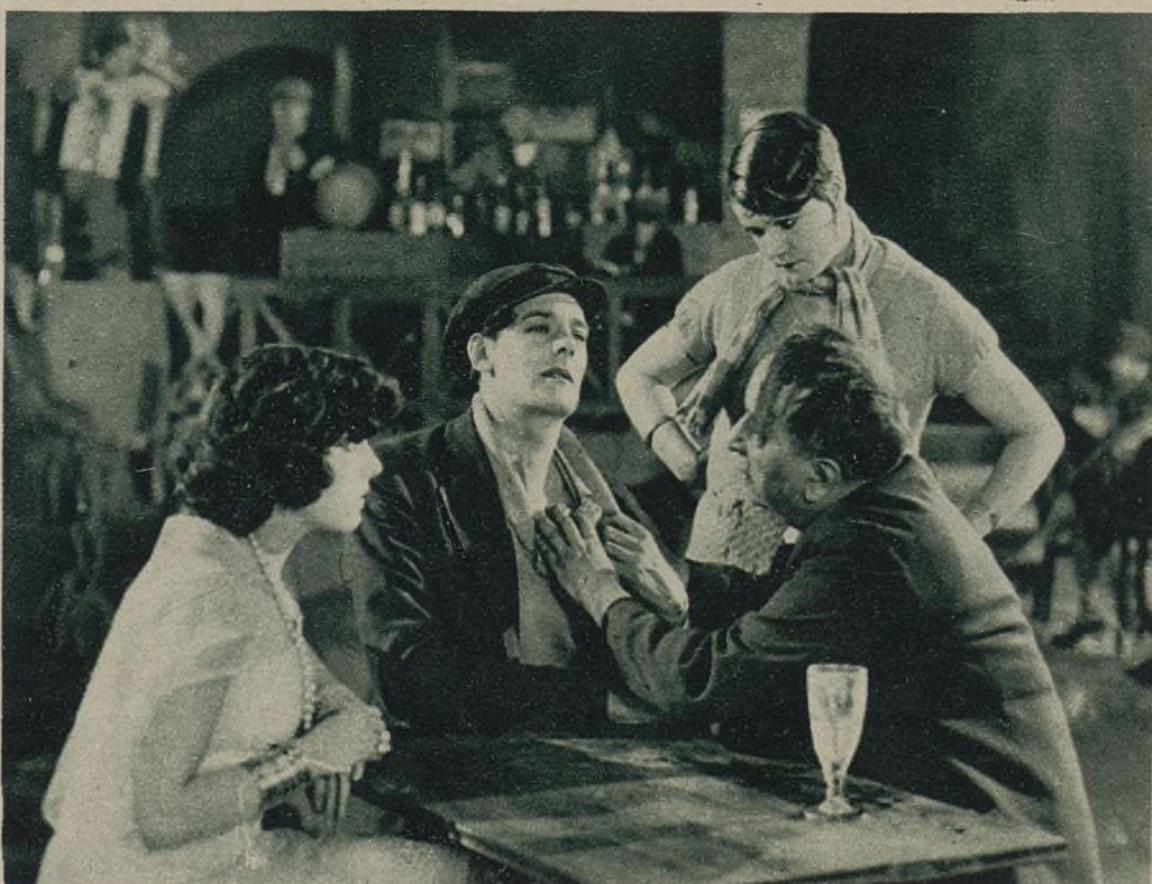
—UN RASGUÑO SIN IMPORTANCIA. ES DOLOROSO, PERO NO ES PROFUNDO