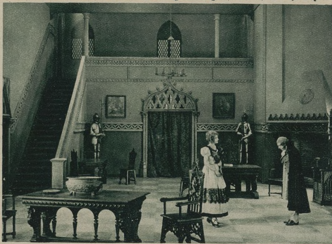
UNA ESCENA DE LA NUEVA PELÍCULA «EL REY DE SIERRA MORENA»

mos anhelos, a pesar de la atonía que actualmente se advierte en nuestra producción.