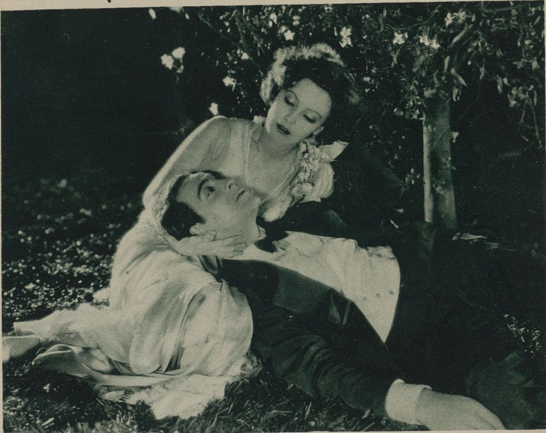
NÚM. 8.—¿A QUÉ PELÍCULA PERTENECE ESTA ESCENA Y QUIÉNES SON SUS INTÉRPRETES?

ANIMADOS por el éxito de nuestros concursos anteriores, continuamos hoy uno que pondrá a prueba una vez más la buena memoria de nuestros lectores. Durante todo el mes de julio, publicaremos cada semana una fotografía representando una escena correspondiente a un film moderno proyectado ya en España y algunas preguntas. Los lectores que deseen tomar parte en este concurso nos enviarán, al finalizar la publicación de fotografías y preguntas, una cuartilla en la que hayan especificado los títulos de los films a que pertenece cada fotografía, los nombres de los actores que aparecen en las escenas reproducidas y las respuestas a todas las preguntas formuladas.