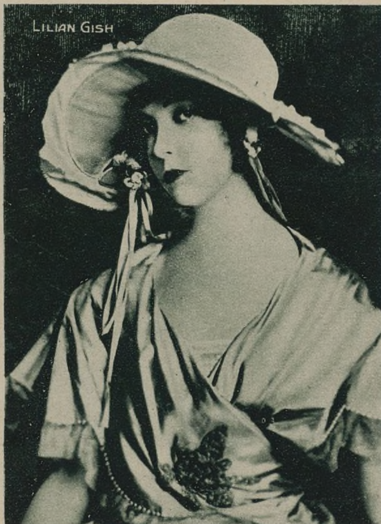
LILLIAN GISH, UNA DE LAS MÁS PERSONALES ESTRELLAS DEL ARTE MUDO

Advertimos a los señores que no se han presentado a hacer efectivo el importe de sus premios, que éstos caducan a los dos meses de su publicación en la Revista.