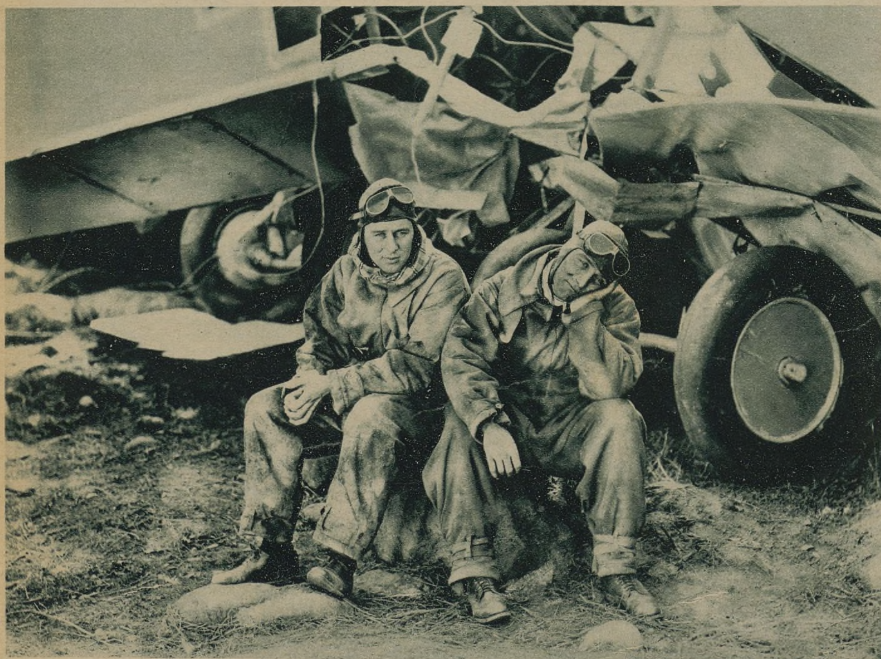
EN SU INTERPRETACIÓN DE «LOS ÁNGELES INFERNALES» BEN LYON Y JAMES HALL REHUSARON LOS SERVICIOS DE «DOBLES» PARA LAS ESCENAS AÉREAS Y EN SU PRIMERA SALIDA SUFRIERON UN ACCIDENTE DEL QUE, MILAGROSAMENTE, ESCAPARON ILESOS