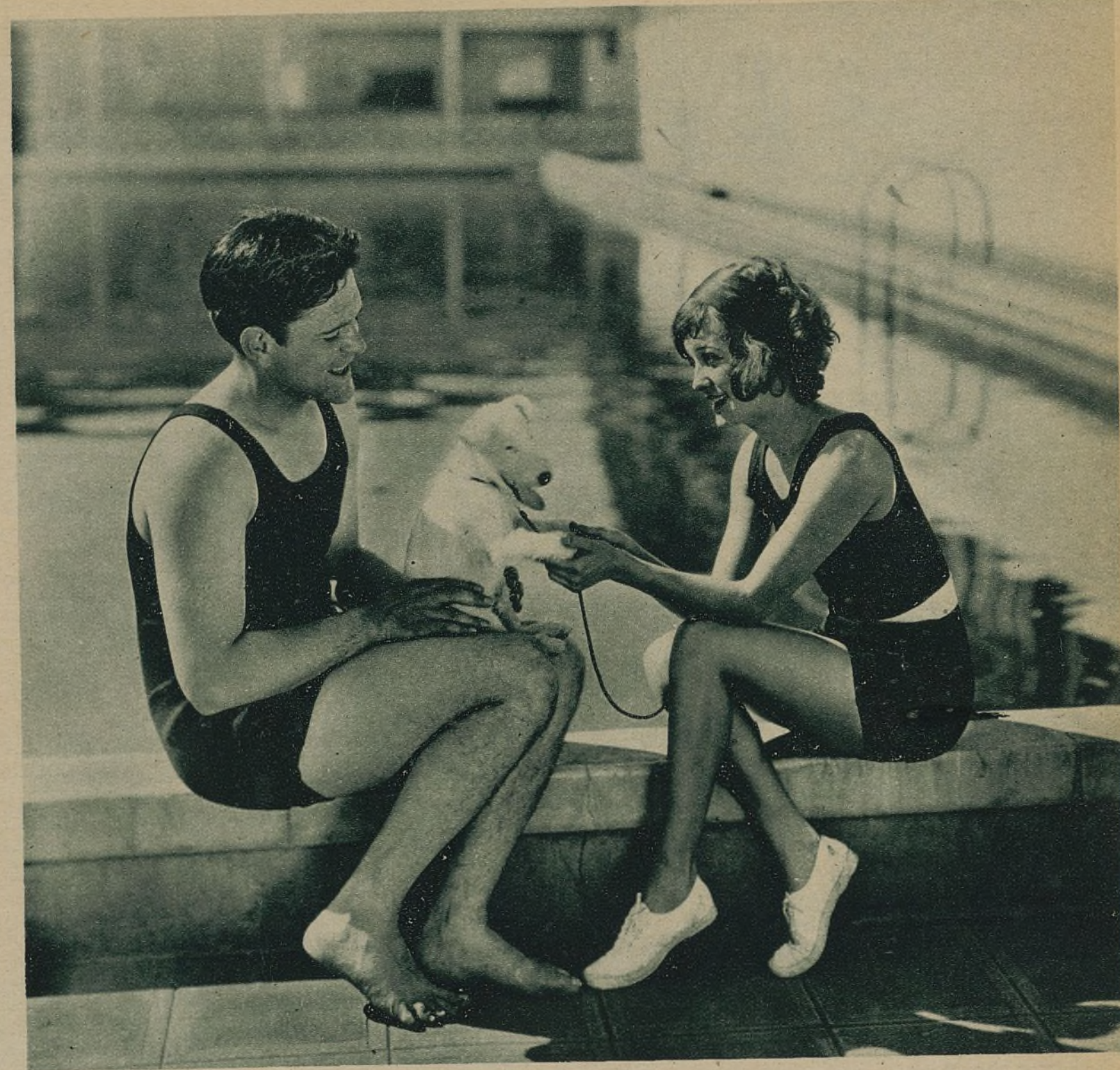
GLENN TRYON MUESTRA 'ORGULLOSO', A LA LINDA MARIAN NIXON SU NUEVO FAVORITO. AMBOS JÓVENES ARTISTAS ACABAN DE TERMINAR UNA CINTA PARA LA CASA UNIVERSAL, TITULADA «MEET THE PRINCE», VISITE AL PRÍNCIPE