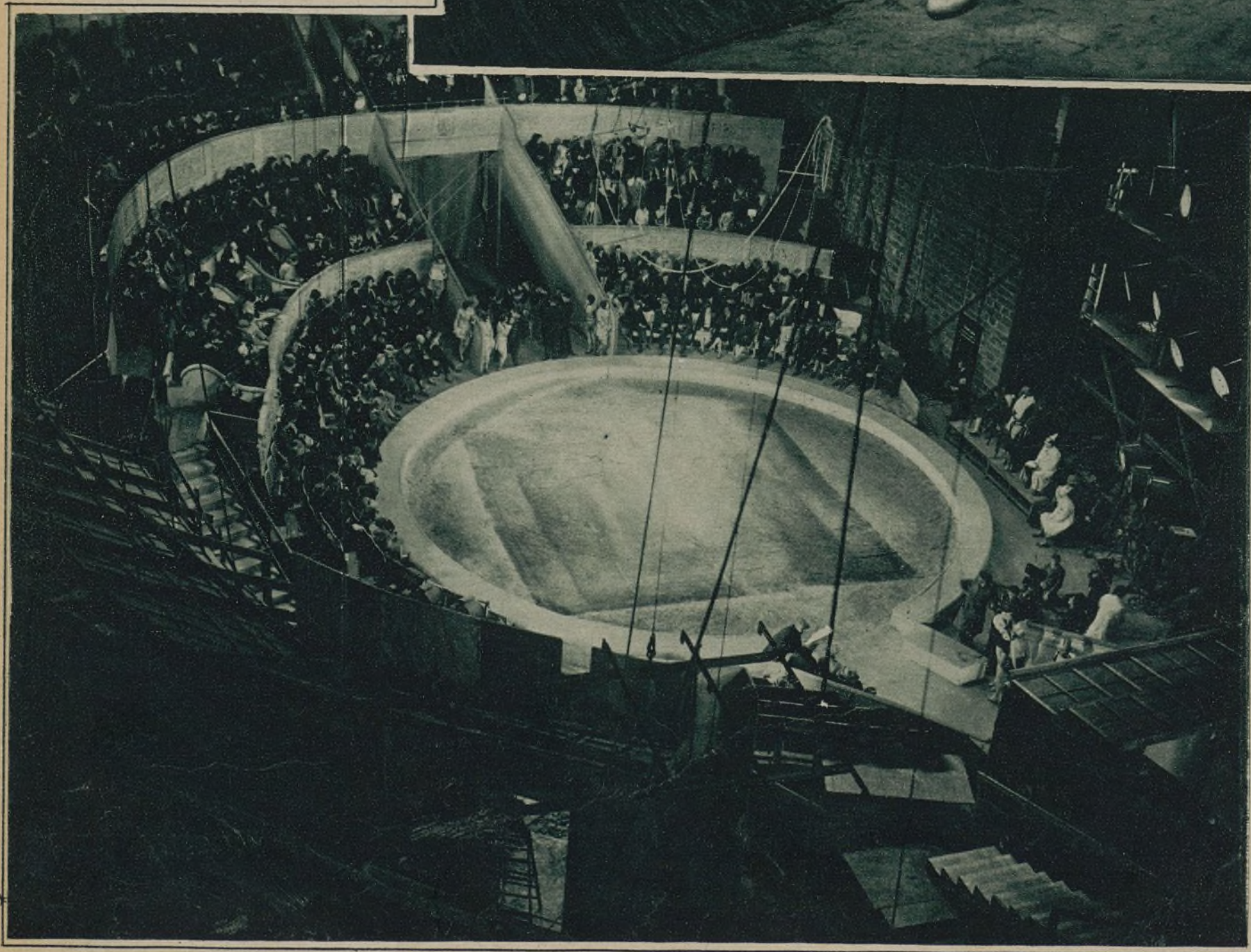
DOS MOMENTOS DE LA NUEVA PELÍCULA DE LA UFA, «EL LAZO DE LA MUERTE». EN LA PARTE SUPERIOR, LOS PROTAGONISTAS, JENNY JUGO Y WARWICK WARD

la palabra puede perjudicar al "film". El Teatro y el cine son cosas perfectamente definidas e independientes. El Teatro tiene su esfera aparte. Sostenido y condicionado por la palabra, se dirige más a la mente y al corazón. El cine, que va buscando también el corazón del espectador, se dirige más a la fantasía que, mecida por el arrullo de la música, puede volar libremente impulsada por la imagen. En el cine mudo el espectador va creándose él mismo, según sus recursos anímicos, el estado de emoción guiado por las escenas proyectadas. En el arte hablado, el espectador ve sus facultades constreñidas por el dictado del disco fonográfico o del procedimiento que se siga para reflejar la palabra. Es muy probable que el éxito del "film" se deba, antes que a nada, a la virtud de su silencio. Desde luego, el cine, en su esencia, es decir en su cualidad de proyección de imágenes, no ganará nada con el acoplamiento de un recitado, y en cambio, le hará costosísimo, lo cual es una de las preocupaciones de las Empresas.