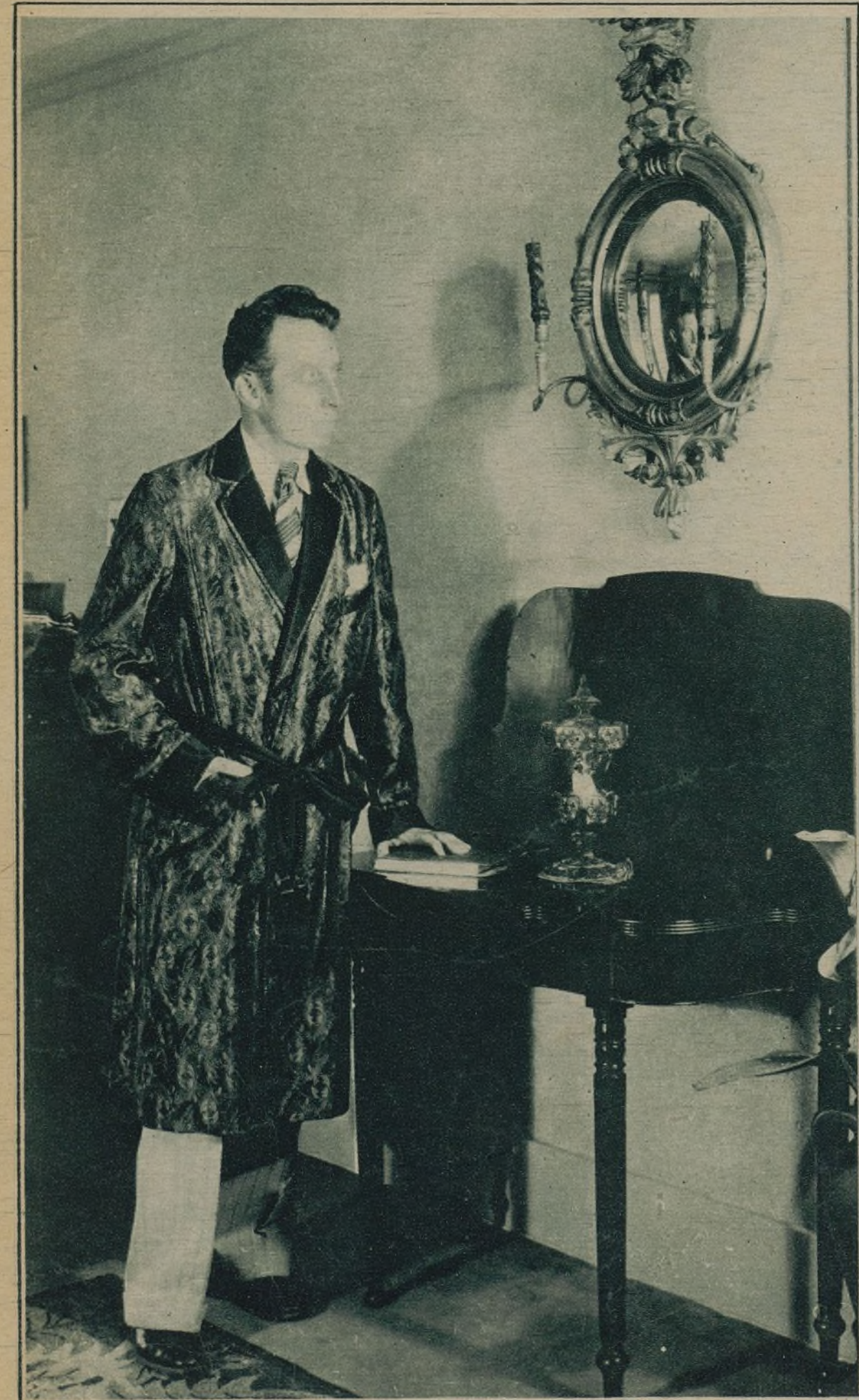
RAYMOND HATTON, EL GRACIOSO ACTOR QUE FORMA AHORA PAREJA CON WALLACE BEERY, EN SU CASA DE HOLLYWOOD

FAY Webb, recostada en el respaldo de un sofá en una pose divinamente lánguida, al ver que vamos a pasar junto a su mesa, lleva el pitillo a los labios y da unas cuantas chupadas, que son como puntos suspensivos en el discreto en que se hallaba entretenida con otra hermosa mujer.