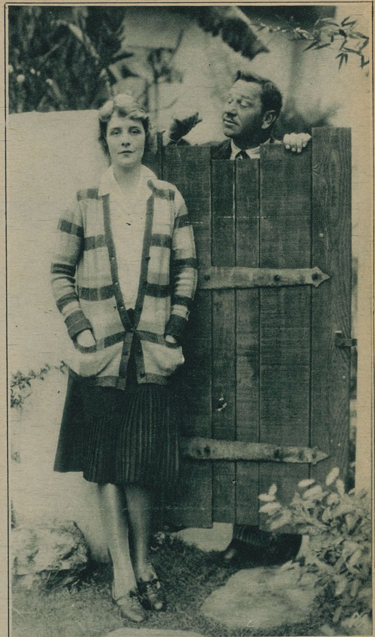
WALLACE BEERY, CON SU ESPOSA, EN LA PUERTA DEL JARDÍN DE SU MAGNÍFICA RESIDENCIA.

ASÍ como el jinete Buck Jones brinca del caballo al aeroplano para adaptarse a la nueva época, su colega Jack Holt prefiere calarse en lo profundo del mar. Su próxima película para la Columbia tiene que ver con la vida submarina, y se titula De lo profundo . Colaborarán con él Dorothy Revier y Ralph Graves.