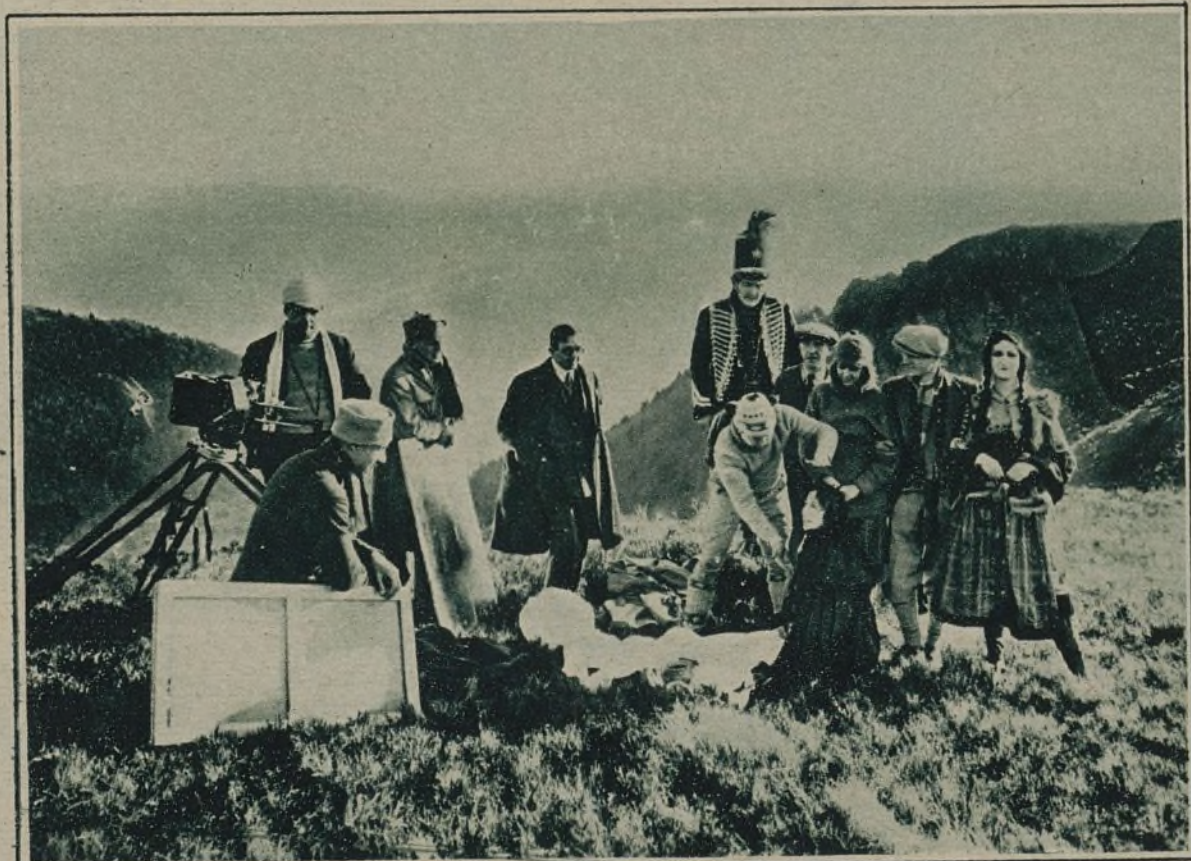
CÓMO SE IMPRESIONÓ EN ALSACIA UN PASAJE DE «LA PRIMA BETTE», PELÍCULA QUE ACABA DE OBTENER VERDADERO ÉXITO A SU PRESENTACIÓN EN PARÍS Y DEAUVILLE

más, la historia de cierta princesita que no se aviene a casarse con quien la razón de Estado exige, y que tiene razón para ello, una razón distinta a la de Estado, naturalmente. Vedette : Greta Nissen, junto a Lionel Barrymore y William Collier.