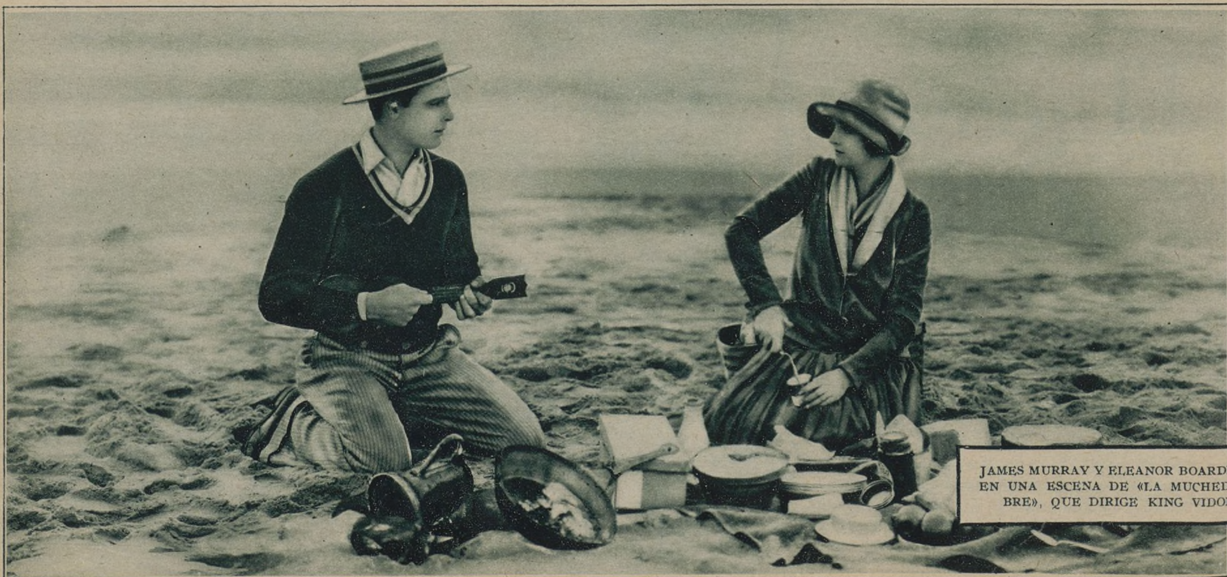
JAMES MURRAY Y ELEANOR BOARDMAN EN UNA ESCENA DE «LA MUCHEDUMBRE», QUE DIRIGE KING VIDOR