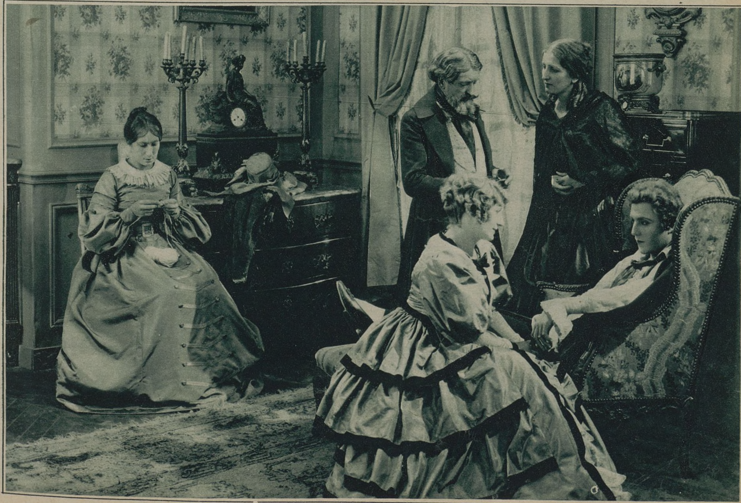
UN SIMPÁTICO CUADRO FAMILIAR. — HACE CERCA DE UN SIGLO, REPRODUCIDO EN UNA ESCENA DE «LA PRIMA BETTE»

La Pax-Film editará en breve El castigo , con Van Daele y Josyane. Parte de la acción transcurre en París y parte en pintorescos sitios de Bretaña.