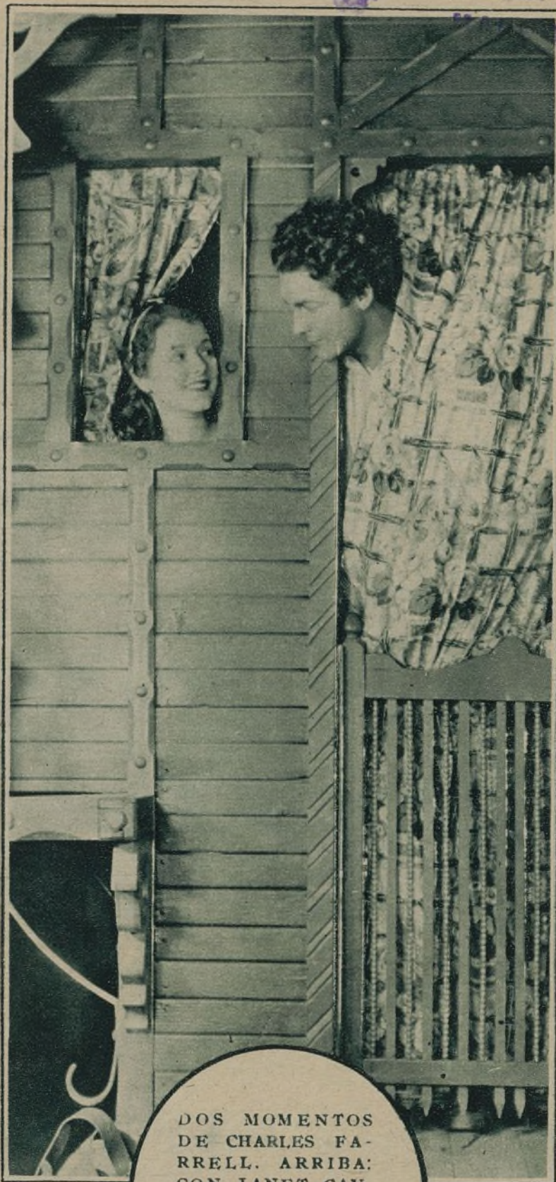
DOS MOMENTOS DE CHARLES FARRELL. ARRIBA: CON JANET GAYNOR, EN «EL ÁNGEL DE LA CALLE», Y ABAJO, CON GRETA NISSEN, EN «FAZIL»

fondo de dulcísima ternura que se manifiesta exquisitamente delicada, con matices de una suavidad infinita, en sus escenas de amor con Diana.