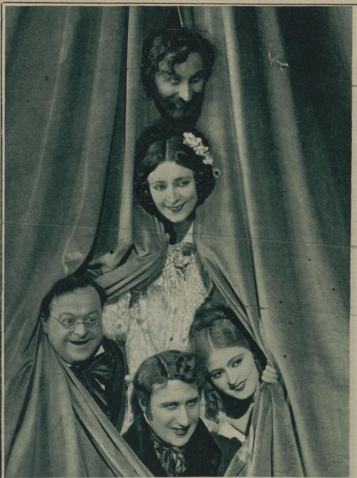
GRACIOSA COMPOSICIÓN, PERTENECIENTE A UN PASAJE DE «LA PRIMA BETTE», QUE SERÁ UNO DE LOS ACONTECIMIENTOS DE LA PRÓXIMA TEMPORADA CINEMATOGRAFICA