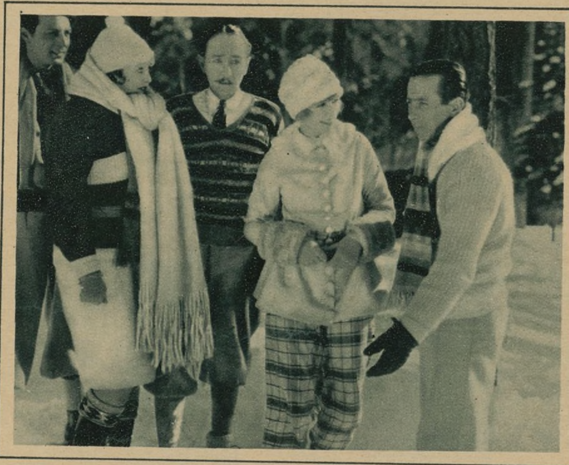
...Y PASA POR TRANCES DIFÍCILES, AL TEMER QUE DESCUBRAN SU VERDADERA CONDICIÓN

—Yo necesito dos semanas de vacación... ¡Oh, no; imposible demorar mi descanso! Me encuentro mal; mi médico