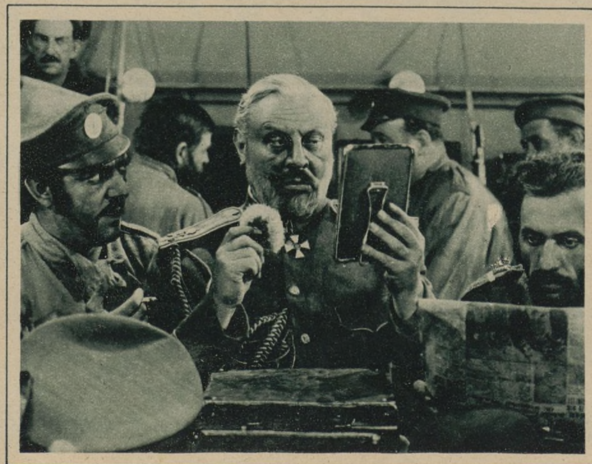
EMIL JANNINGS, EN UNA ESCENA DE «LA ÚLTIMA ORDEN»