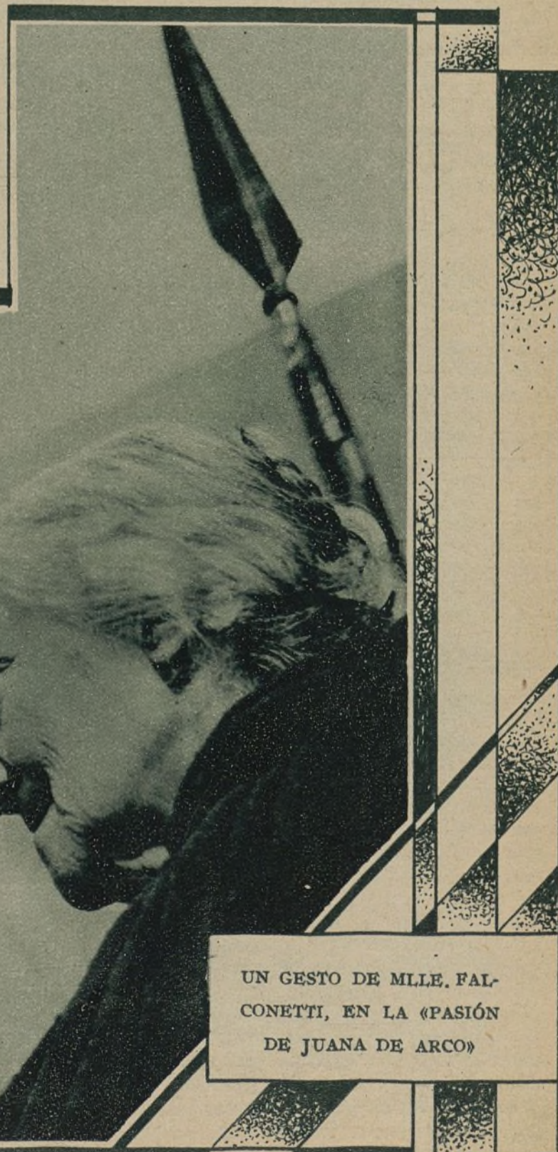
UN GESTO DE MLE. FALCONETTI, EN LA «PASIÓN DE JUANA DE ARCO»