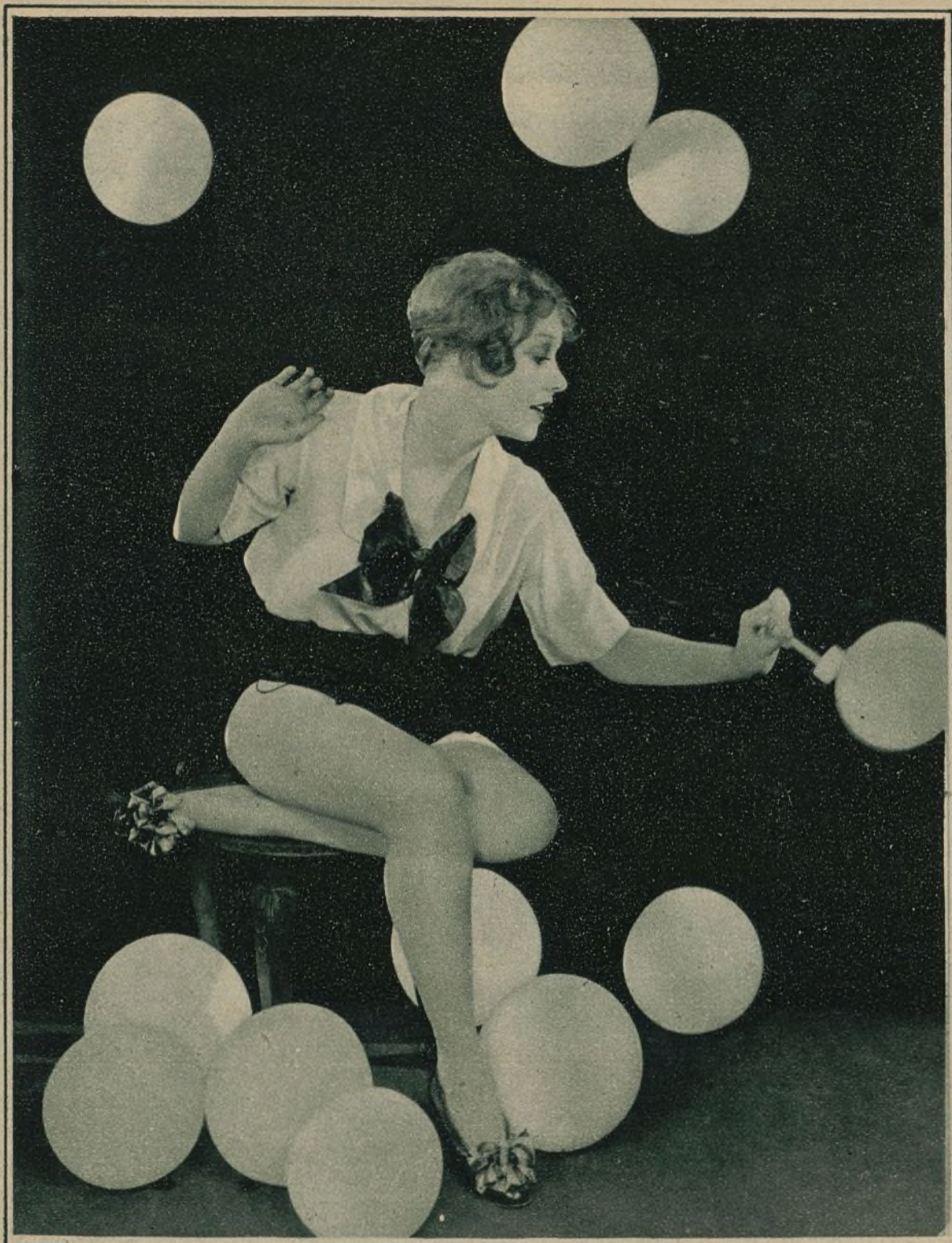
ANITA PAGE, LA NUEVA Y PROMETEDORA ACTRIZ, DE ORIGEN HISPÁNICO, RECIENTEMENTE CONTRATADA POR LA METRO-GOLDWYN