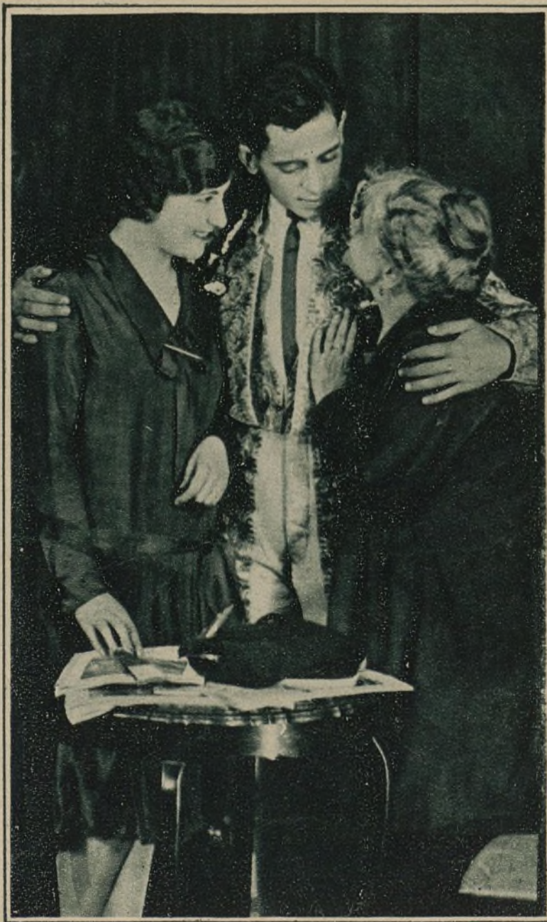
MARCIAL LALANDA CON CARMEN VIANCA EN UNA ESCENA DE «VIVA MADRID, QUE ES MI PUEBLO»

—¿Y esta película de ahora? —A mí me gusta. Se lo digo a usted con franqueza. Me gusta. Es una cosa madrileña, muy madrileña: la demostración de que cualquiera que llegue a Madrid encuentra en seguida un brazo generoso que le ampara. Ya lo dice todo el título: ¡Viva Madrid, que es mi pueblo! Creo que ha de gustarle a la gente. —¿Ha visto usted la prueba? Lalanda dice que sí. —¿Y qué le ha parecido a usted? Mejor dicho: ¿qué tal se ha parecido usted? Una carcajada: