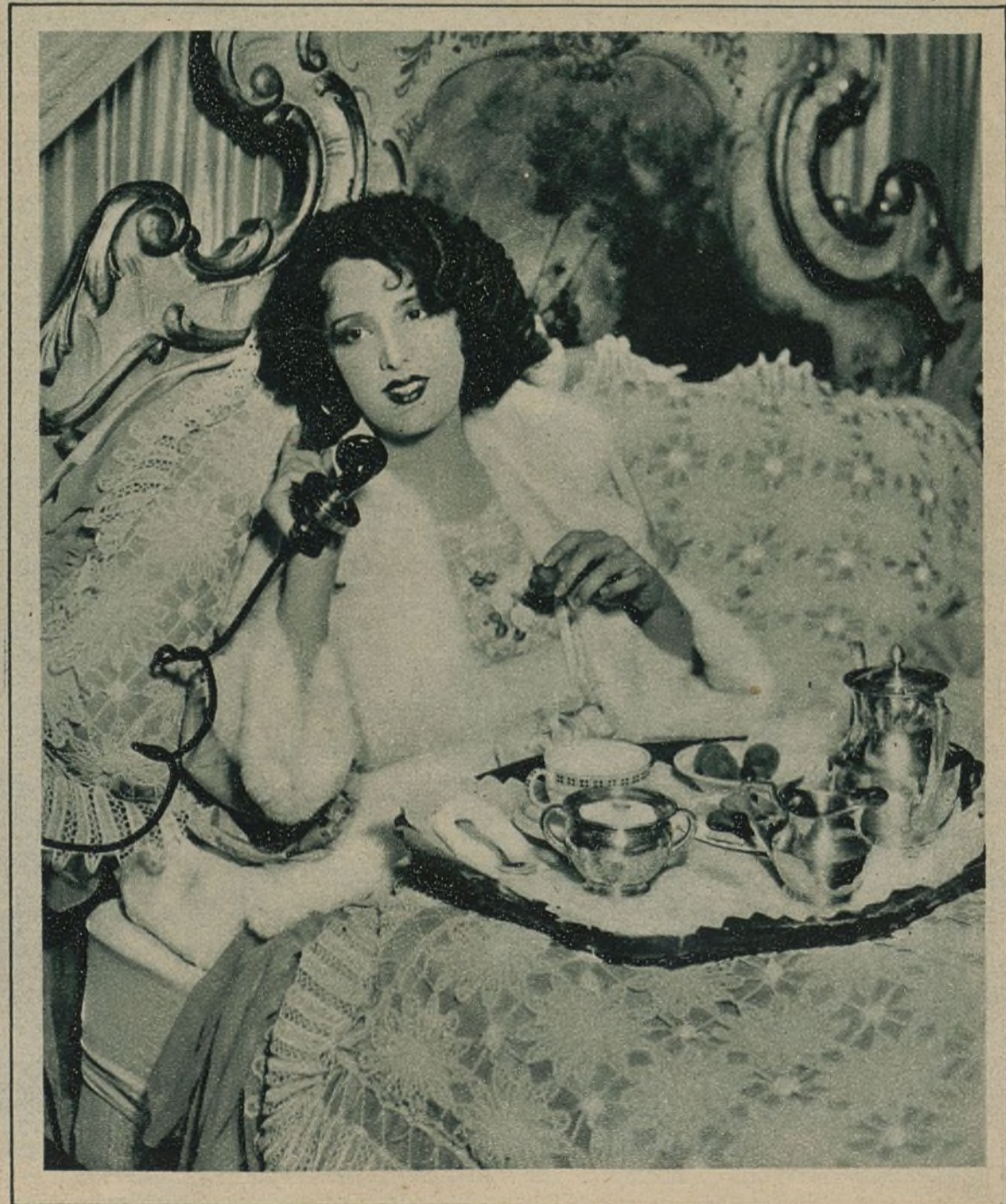
PARA DESAYUNAR, SIN ABANDONAR EL LECHO, ESTELLE TAYLOR SE ABRIGA CON UNA CHAQUETA DE TERCIOPELO BORDADA DE ARMADO