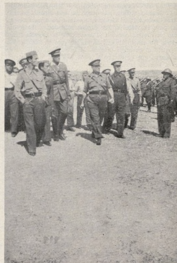
Momento en que los Jefes, acompañados del Comandante del Batallón, su Comisario y el Comisario de la Brigada, revistan las fuerzas a quienes se entregó la bandera.

Un recluta es un hijo del pueblo que viene a ayudar a sus hermanos en la lucha contra el fascismo invasor. Camarada veterano: tiéndele tus brazos y aprétale con tu corazón. Vuestro abrazo conmoverá a la Patria. Vuestra unión abrirá el camino luminoso de la Victoria.