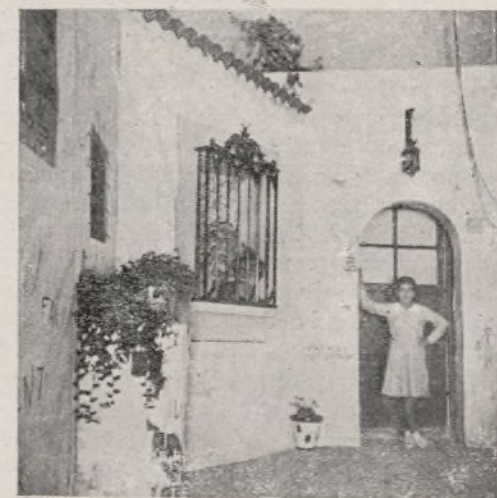
PATIO ANDALUZ. - Rincón decorado con motivos andaluces en el "hall" de la Exposición