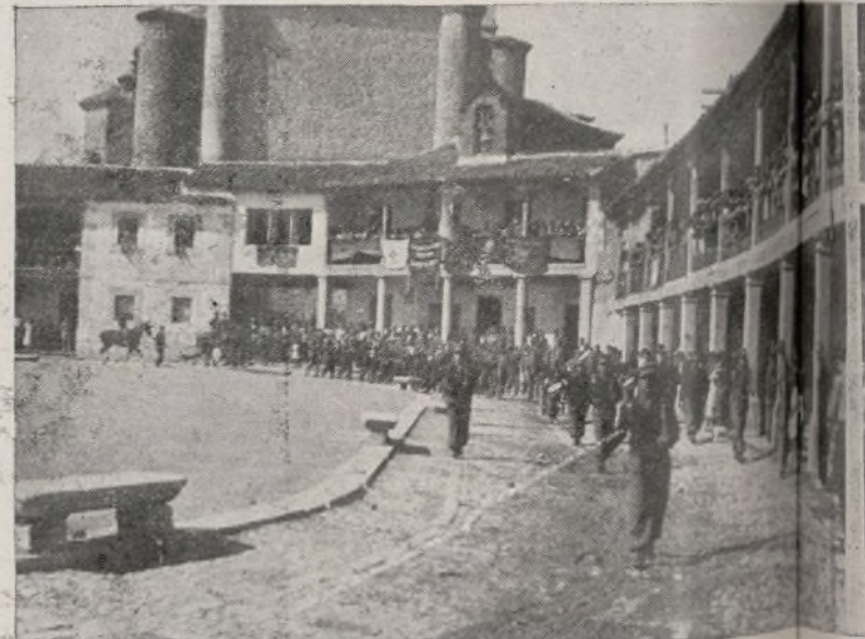
Desfile de las fuerzas de la 77 Brigada Mixta

"Compañeros: Os entrego este banderín para que