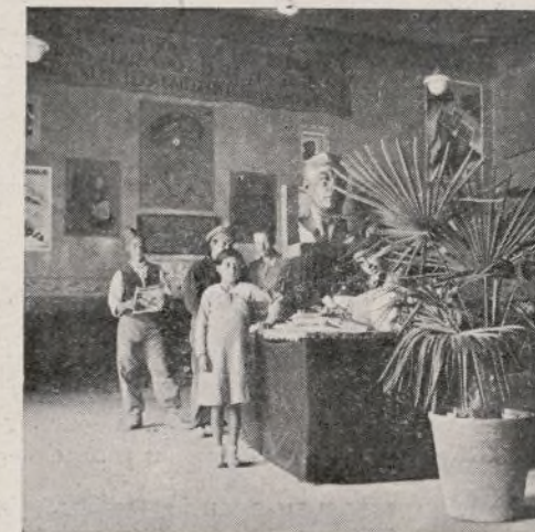
Aspecto de la Exposición