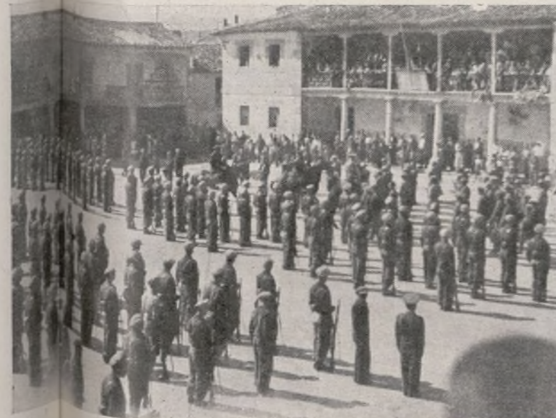
Momento de ser entregado el Banderín a la Compañía Modelo