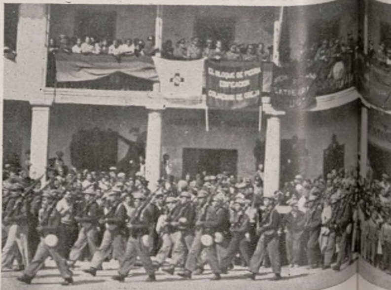
La tropa desfilando ante la presidencia del acto