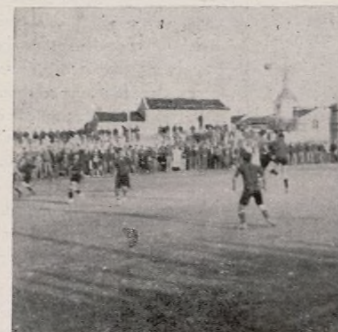
Un aspecto del partido de fútbol

lo coloquéis tan alto, tan alto, que os sirva de estandarte y perdáis la vida, si preciso fuera, en su defensa. Es un banderín que se os entrega con toda el alma, con todo el corazón y en su defensa tenéis que poner todo entusiasmo, toda voluntad, todo corazón.