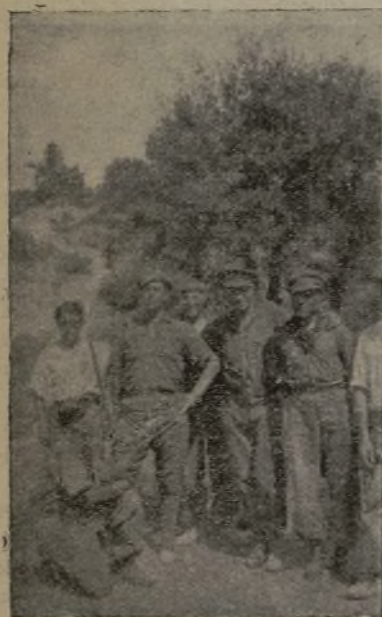
Viechi amici che si ritrovano.

tarlos estoicamente como lo que somos: hombres forjados en la lucha por el pueblo y por los pueblos.