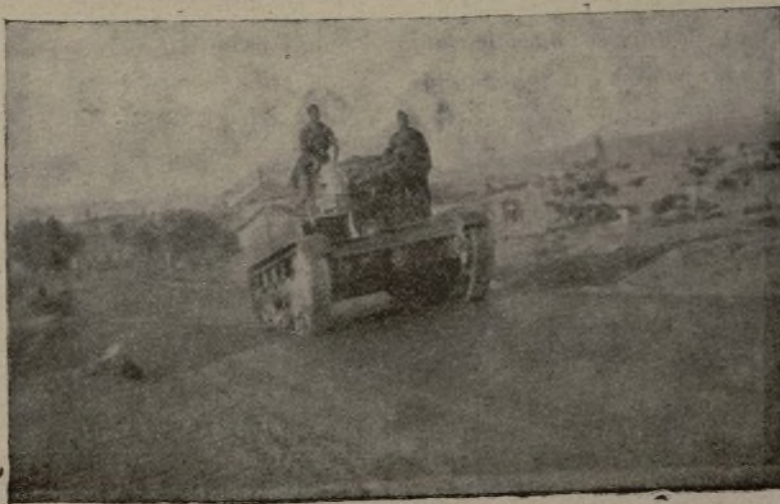
Un... pesante argomento in favore della nostra causa.

Dice que confía en la victoria y que venceremos con la ayuda de los internacionales y de los españoles leales.