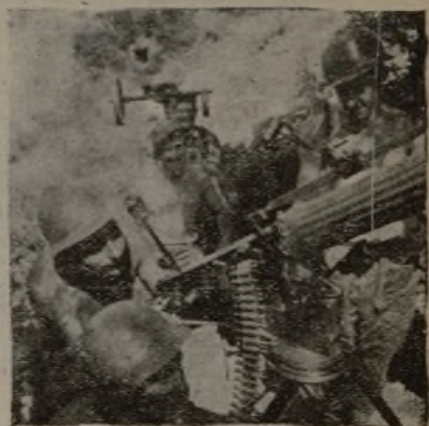
La mitragliatrice anti-aria del 1.º Battaglione.