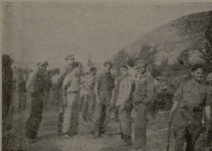
L' Altavoz del Frente parla agli amici...