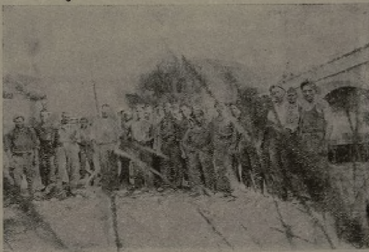
Un ponte, dei garibaldini ed un... fotografo

stri capi e comandanti, i quali si sono guadagnati la nostra fiducia in decine di bat- taglie. E' indispensabile che gli ordini di qualsiasi ge- nere siano eseguiti senza com- menti e discussioni; ogni ritar- do anche di un solo minuto nel- l'eseguire un ordine ricevuto, può decidere le sorti di una battaglia. D'altra parte è neces-