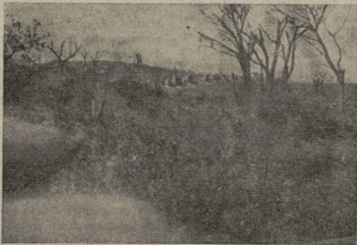
Casa de Campo