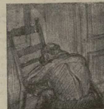
Dibujo de Fantini

Ramón Galera de la Comp. a de Transmisiones