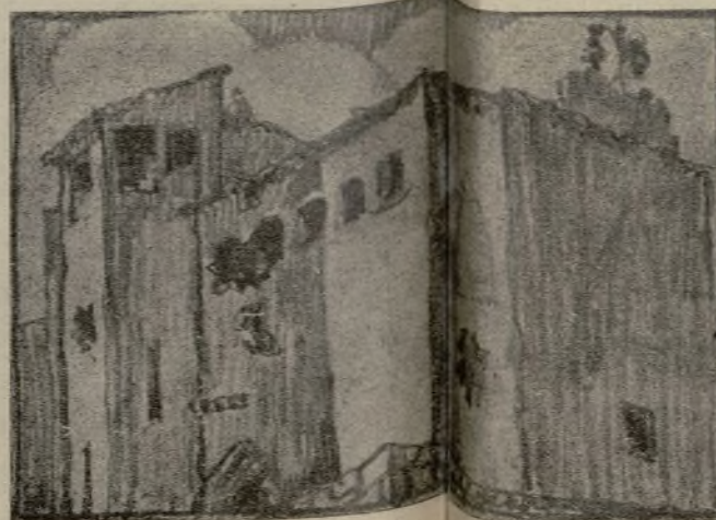
Dibujo de Fantini