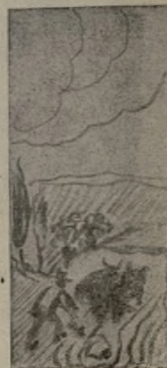
Dibujo de Fantini