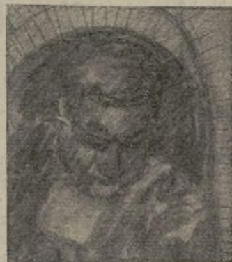
Dibujo de Fantini

Poetas-soldados, soldados-dibujantes: soldados del magnífico Ejército Popular Español, Ejército que es el pueblo y del pueblo: el más bello elogio que se os puede hacer es decirlos que hasta como poetas y dibujantes os habéis mostrado dignos de nuestra magnífica Brigada.