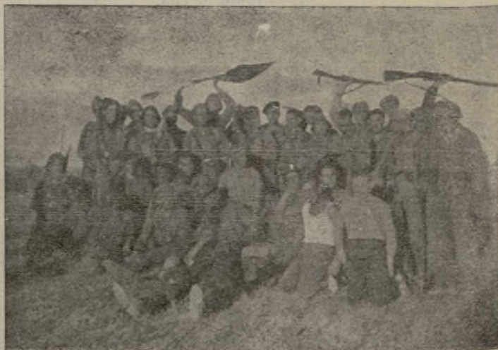
La 1.ª Compañía del 1.º Batallón

La economía del soldado de retaguardia debe ser más efectiva que la del que está