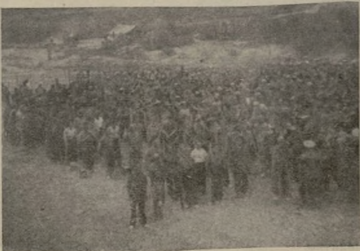
El 2.º Batallón de nuestra Brigada