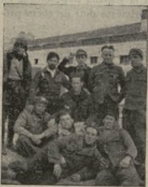
Garibaldinos en El Pardo