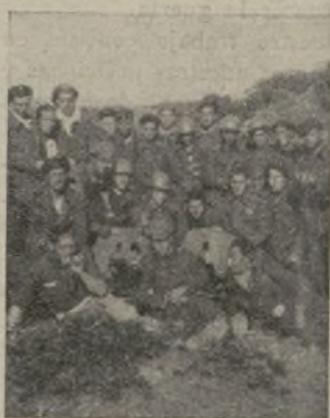
Nuestras «compañeras»: las ametralladoras

del amargor por los camaradas caídos, a pesar del cansancio, un cantar sube de nuestras trincheras.