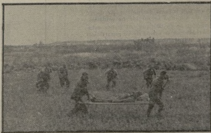
Ejercicio contra los gases

pero se debe estar bien seguro que la granada lanzada no contiene gas, pues de lo contrario se quedaría herido por éste.