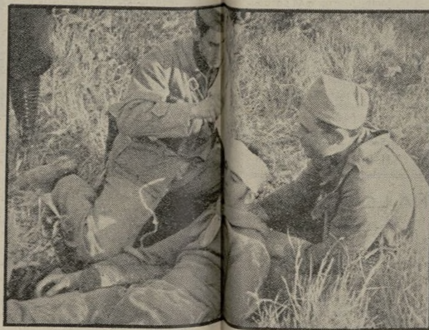
NUESTROS VALIENTES CAMILLEROS están siempre dispuestos a salvar a sus compañeros