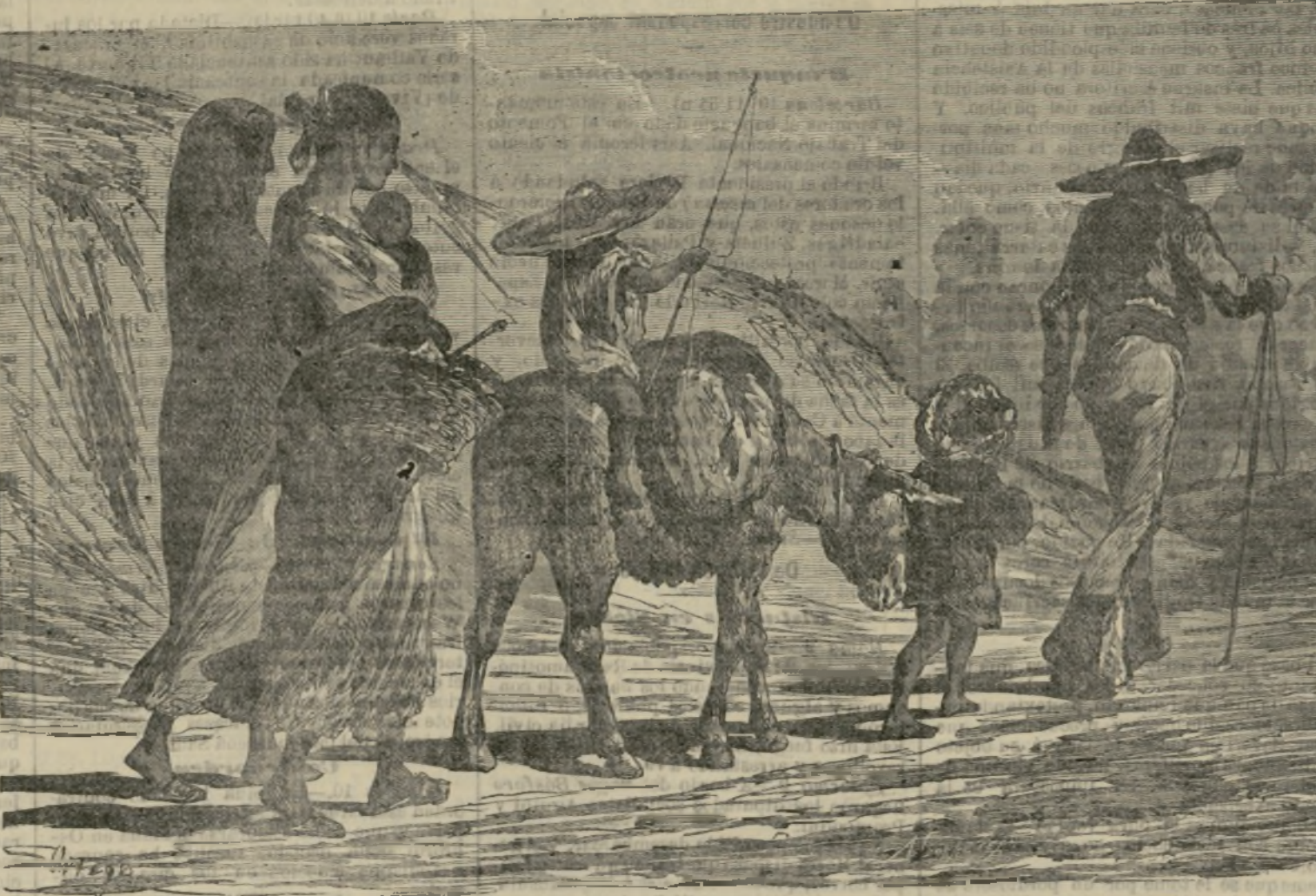
FAMILIA DE GITANOS ESPAÑOLES

templo, en los siglos medios del derecho de asilo por Constituciones de Valentinián, Teodoro y Arcadio, y que Santo Tomás atribuye por tierra la égloga de Alberto Magno, la que, merced á ciertas ruedas y contrapesos, llegó á articular algunas palabras, ni más ni menos que un muñeco, obra de Juanito, hachala y subia, andando, toda una calle de Toledo.