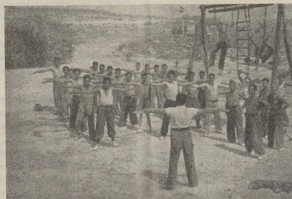
Con la misma solicitud con que nuestros soldados atienden al cultivo de su inteligencia, cuidan de darle fortaleza y prestancia a sus movimientos. Vedles aquí, a pocos metros de la primera línea, en un momento de los ejercicios de cultura física.

de contacto, practicando la manera de reconocer si un punto está ocupado o no; la ejecución de un golpe de mano y el pelotón en misiones de avanzadilla, y de patrulla de seguridad o de reconocimiento.