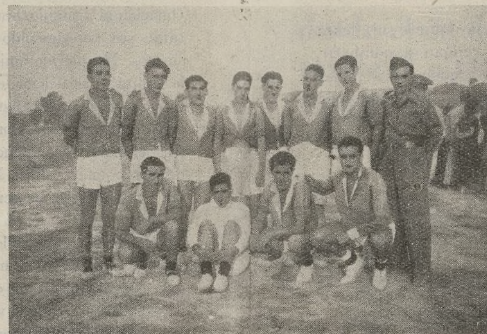
El equipo de fútbol divisionario, entre el que se cuentan elementos de nuestra Brigada, que en recientes contiendas ha vencido al de otras Divisiones.

También deberán realizarse otros ejercicios referidos a las siguientes misiones, como son: el pelotón destacado como patrulla