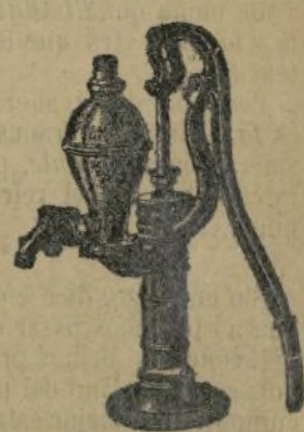
Bomba aspirante e impelente.