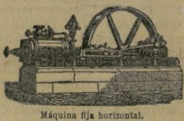
Máquina fija horizontal.