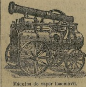
Máquina de vapor locomóvil.

Molinos, bombas, prensas, tubos, correas, etc.