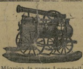
Máquina de vapor Locomóvil.