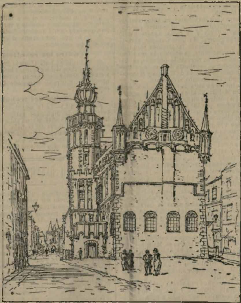
CASA CONSISTORIAL DE KAMPEN

Kampen, ciudad holandesa, situada en la ribera izquierda del río IJssel, tuvo gran importancia comercial, sobre todo a raíz de su incorporación a las Provincias Unidas en 1578. Su puerto, un día limpio y de gran fondo, recibió la visita de todos los navios mercantes que hacían el tráfico en las provincias; pero hoy los bancos de arena le han obstruido casi por completo y son muy escasas las embarcaciones de poco porte que lo visitan. A pesar de esto, Kampen sostiene varias fábricas de cigarrillos, tapices de lana, peluches