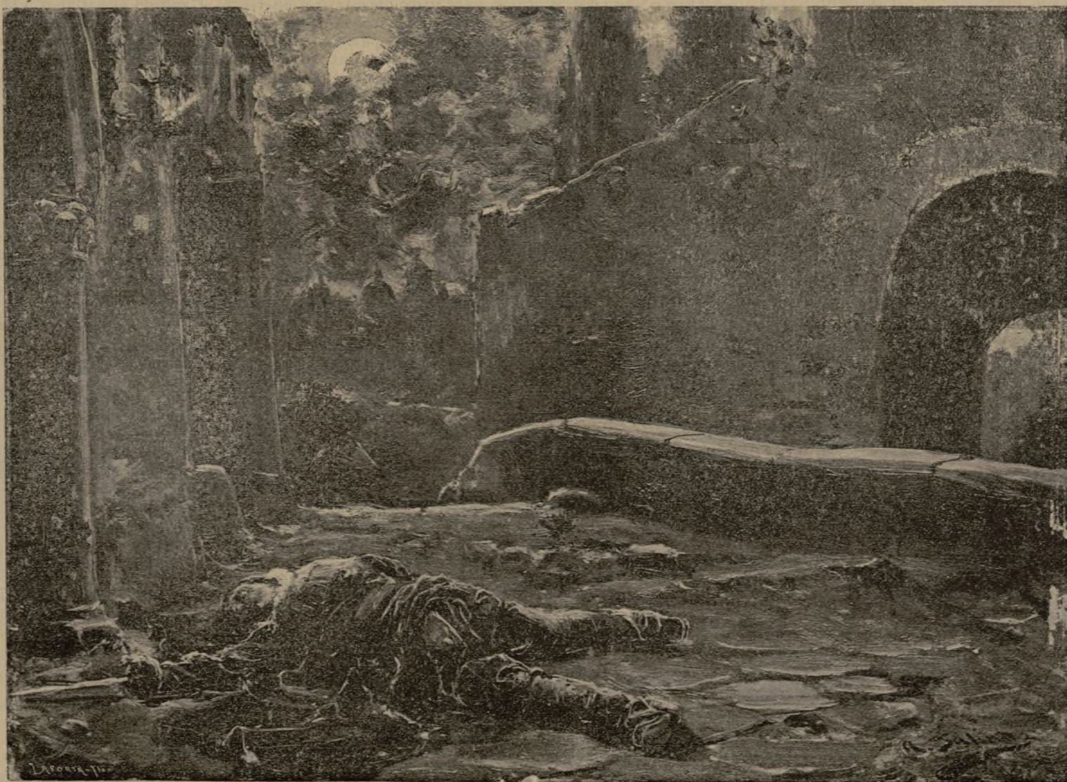
ESCENA DEL 24 DE MAYO DE 1591

Fueron las principales, la prision del Justicia, Duque de Villahermosa y Conde de Aranda, que sin más dilacion las dispuso el general, mandando á Juan de Velasco, Alcaide de Almuñécar que con disimulacion la encaminase; digo la que á él tocaba. Fuese este á la Diputacion, Tribunal del Justicia, previno la's compañías que á la