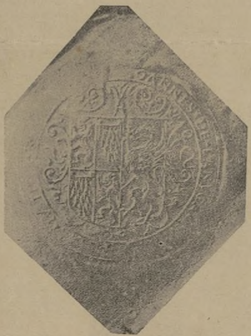
INSCRIPCIÓN DEL SELLO USADO POR LOS JUSTICIAS DEL LINAGE LANUZA.

JOANNES DE LANUÇA QUARTVS MILES JUSTITIA REGNO ARAGON.