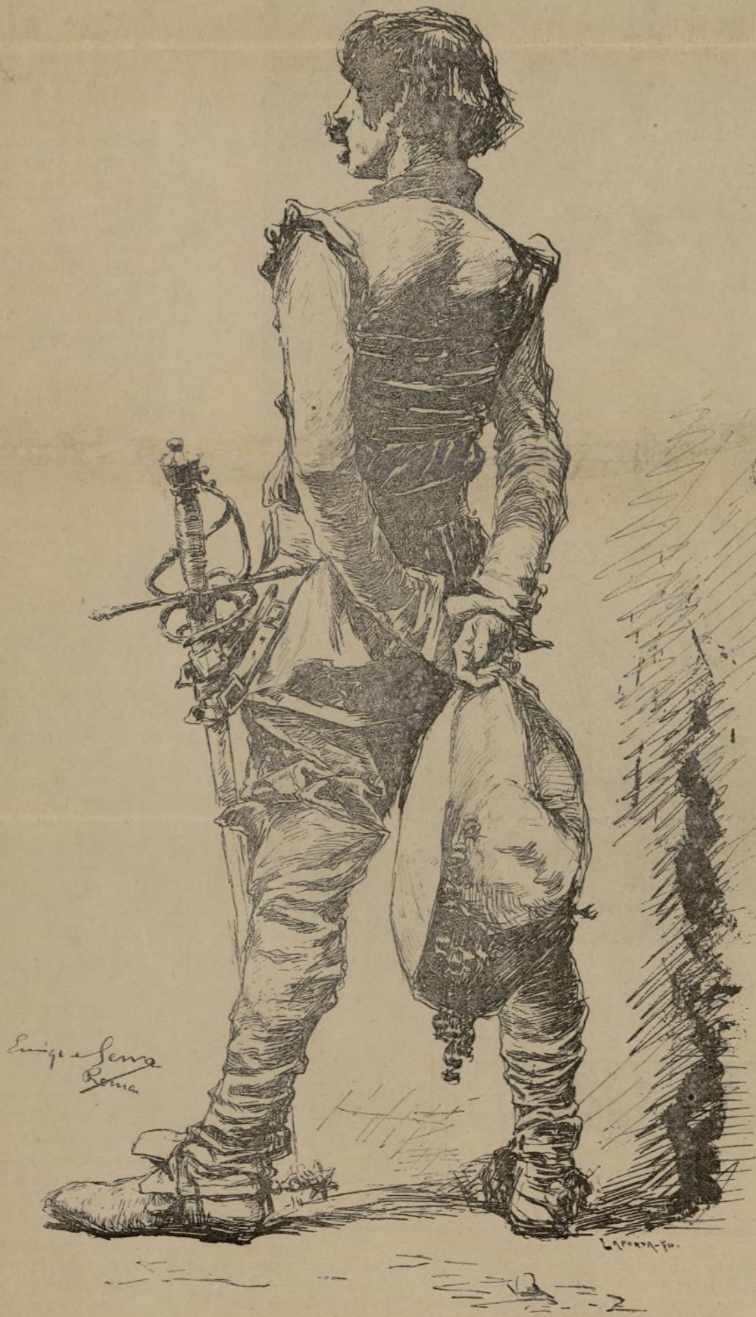
TIPO DE LA ÉPOCA

El libro donde consta el dato que más abajo transcribimos es un cuaderno en 4.º con cubiertas de pergamino y papel de hilo amari-