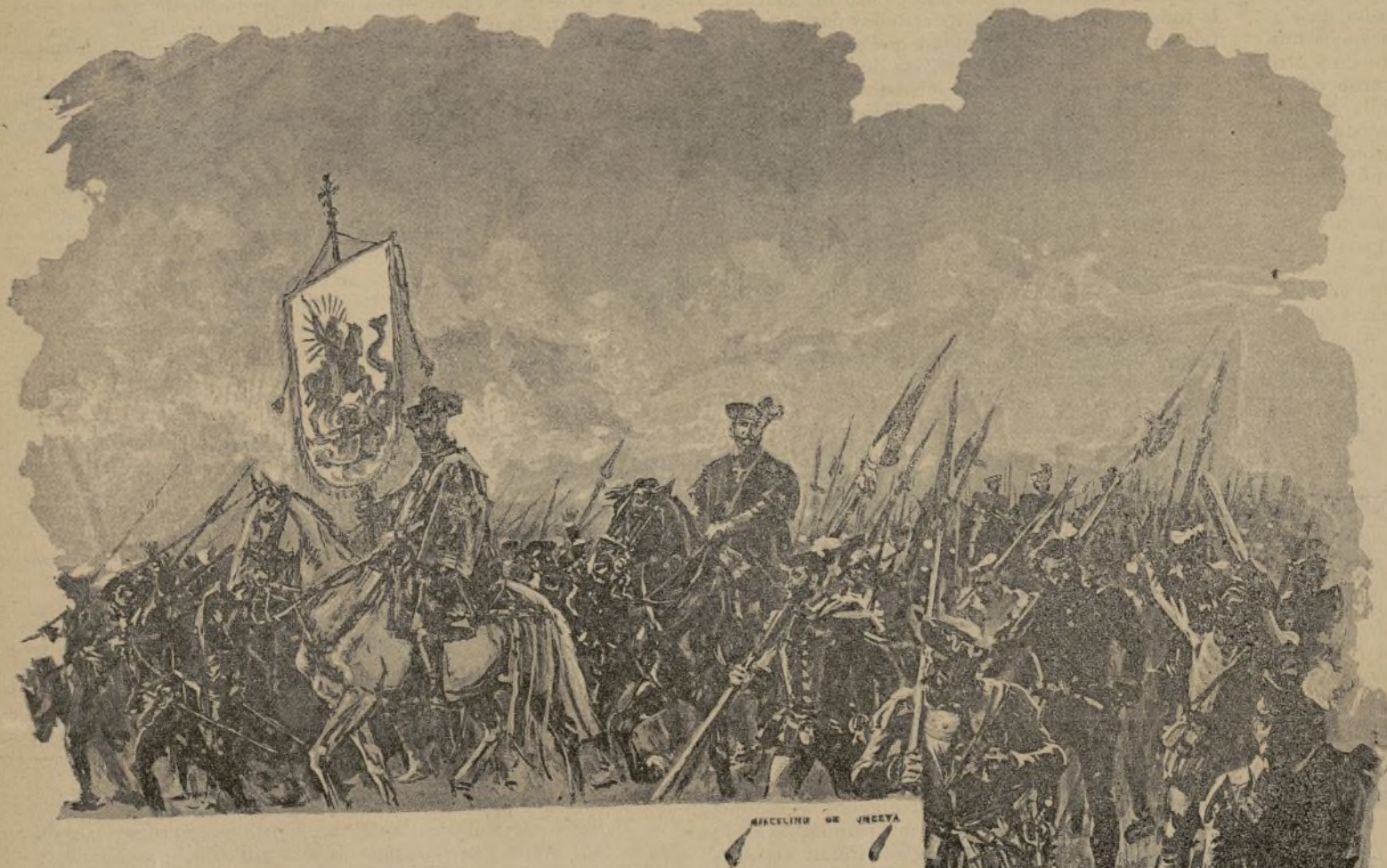
SALIDA DEL JUSTICIA PARA RESISTIR AL EJÉRCITO DE FELIPE II. ESTUDIO AL BLANCO Y NEGRO PARA UN CUADRO, POR MARCELINO DE UNCETA. MADRID, 1891. ORIGINAL DEDICADO PARA EL PRESENTE NÚMERO