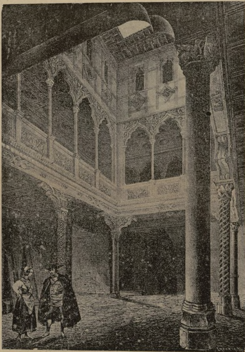
CASA DE TORRELLAS, CAPILLA DE LANUZA

ñadura del espadón y despeinada cabellera; la matonería de su actitud, acusada hasta en el desgaire de su domado chambergo; la planta que presenta como en desafío de aventuras; el traje y continente, todo forma un perfecto tipo de época, con rara habilidad ejecutado.