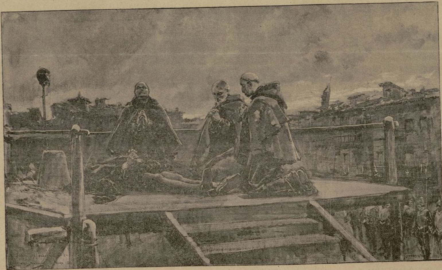
20 DE DICIEMBRE DE 1591!! (BOCETO DE UN CUADRO POR D. MARIANO BARBASÁN, ROMA).

Este día fué de los más afligidos y lastimados que Aragón tuvo, y el mayor castigo que se pudo hacer, pues con cortar muchas cabezas del Reyno no se