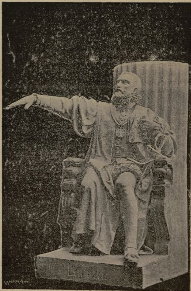
PROYECTO DE ESTÁTUA DE LANUZA

¡Que desarraigada la esterilizadora envidia tradicional entre sus hijos y contra sus mejores hijos, Zaragoza reconquiste su legítima influencia en los destinos de esta Nación magnánima; sintiendo cada cual como debe y obrando como cual como sienta!