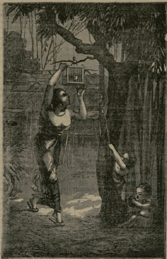
UN JARDÍN EN BATAVIA

Si, dejando los barrios bajos e insalubres de Batavia, se pasa a la ciudad nueva, sana y alegre, el cambio de la decoración imprevista agradablemente, al encontrar las modernas y elegantes barriadas con casas espaciosas y bien aireadas, separadas entre sí por paseos y jardines.