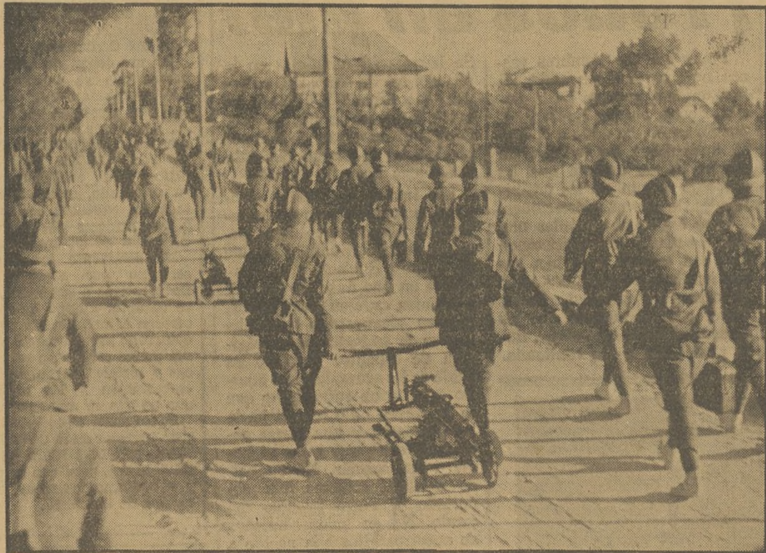
¡Al combate! ¡Defensores de España, a la lucha!

Y el pueblo de Euzkadi seguirá siendo digno de todos.