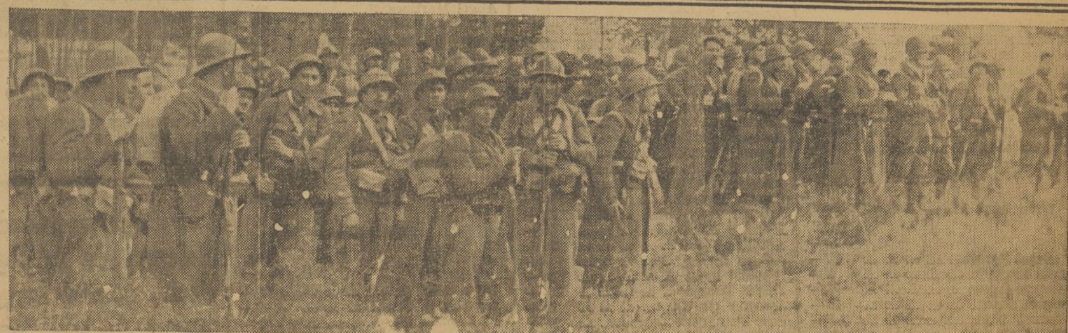
¡Cien mil voluntarios para echar de España a los bárbaros!