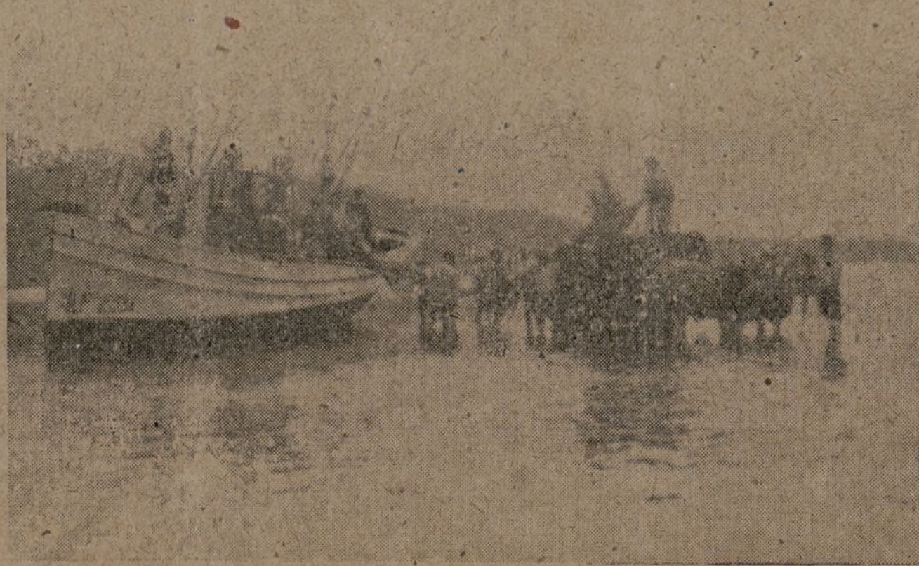
ESCENA DE PESCA.—Descargando las redes.