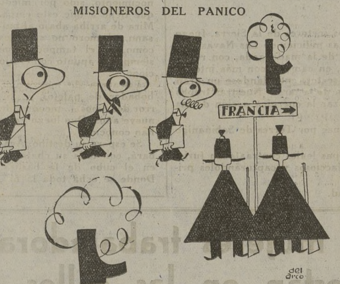
Honorables caballeros que «van a resolver» graves problemas de Estado (misiones especiales) al otro lado de los Pirineos...

Valencia, 21.—Ha llegado un tren con más de mil ciudadanos evadidos de extremadura por Portugal. Tras corta permanencia en Valencia han salido hacia La Encina. Sus familias han quedado en Cataluña.—Febus.