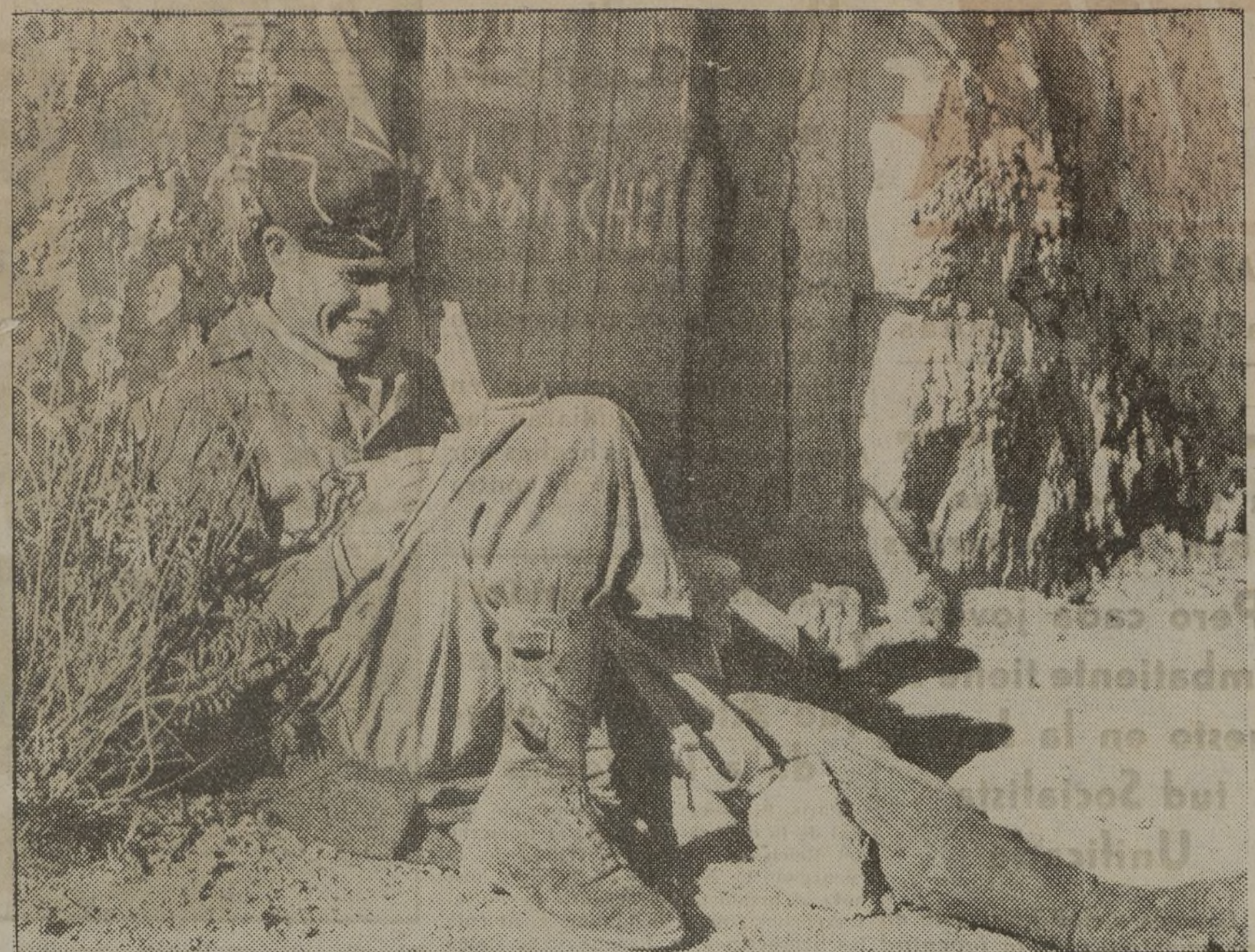
La carta. Por unos minutos el miliciano se olvida del estallido de las granadas y los gritos de combate. Se vuelve a la retaguardia con el pensamiento. Los padres, los hermanos, la compañera... El rostro pierde la dureza del combate. Va hacia casa el mensajero lleno de ánimo. "Por aquí han querido colarse varias veces, por sorpresa; pero no les vale..."

Vuestro compañero y general, José Asensio."