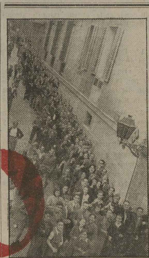
Los estudiantes a la puerta del edificio de la F. U. E. esperan el turno para el alistamiento.

Y como siempre, queremos que nuestra Juventud Socialista Unificada sea la brigada de choque, que sirva de espejo a los demás.