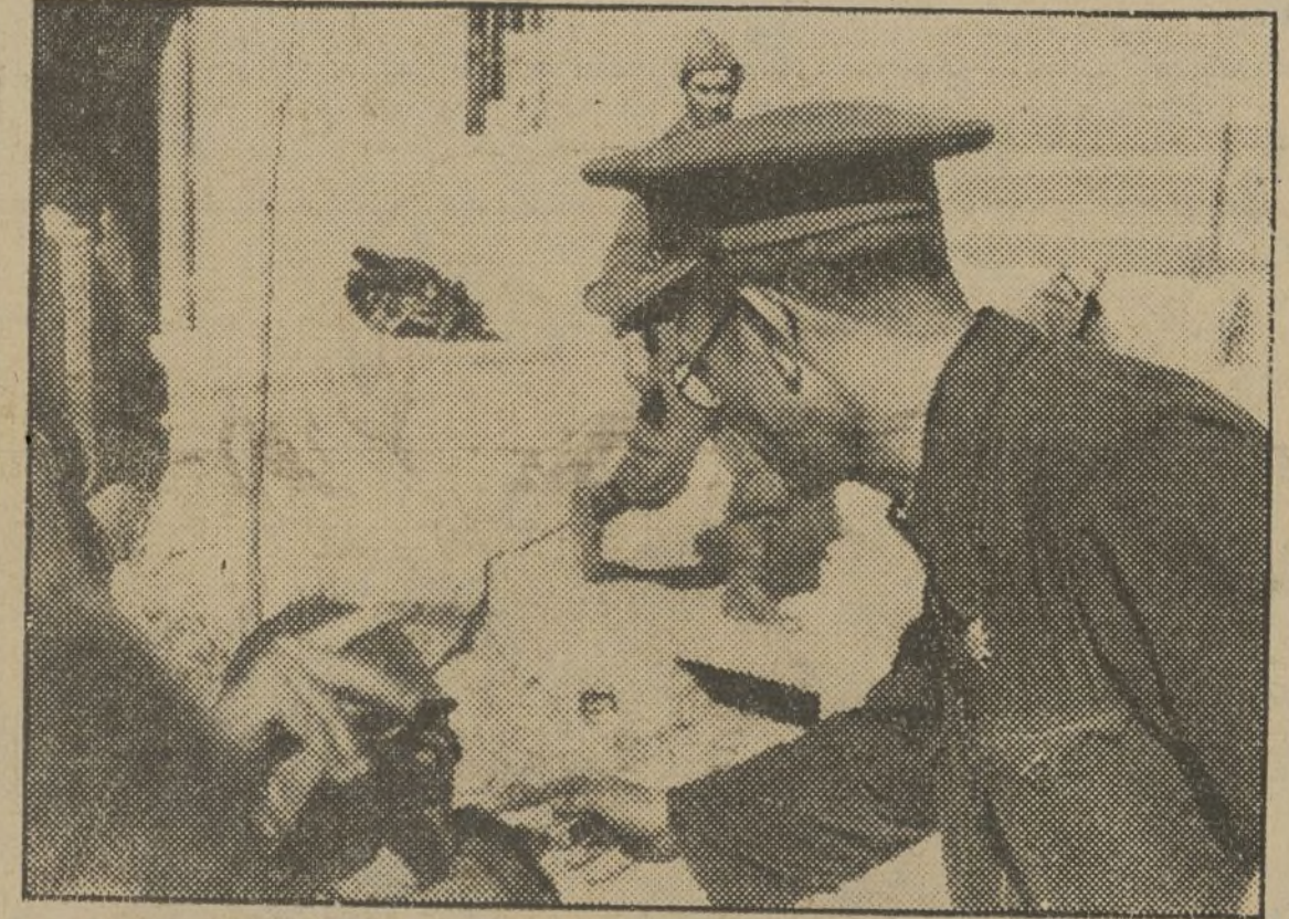
Uno de los jefes del sector Centro dando instrucciones para una operación.

A mí no me volverán a echar de la fábrica por leer la Prensa de los obreros, ni me obligarán a resistir sin un pedazo de pan siete días. Y mira, cada vez que cambia el tiempo me duele este pie, en el que me dieron más de cien calatazos en Octubre.