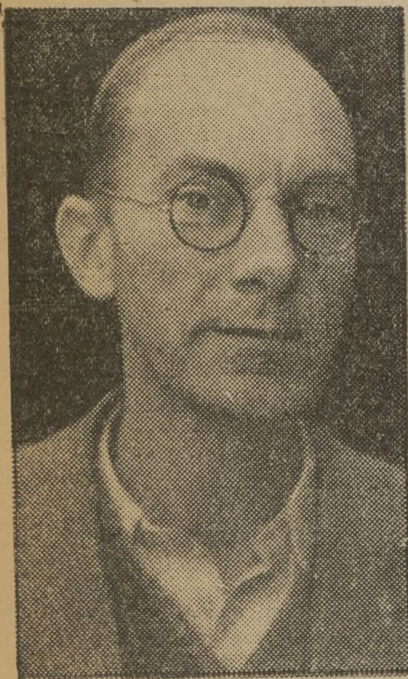
LUDWIG RENN

LUDWIG RENN El gran escritor alemán se dirige a la juventud española