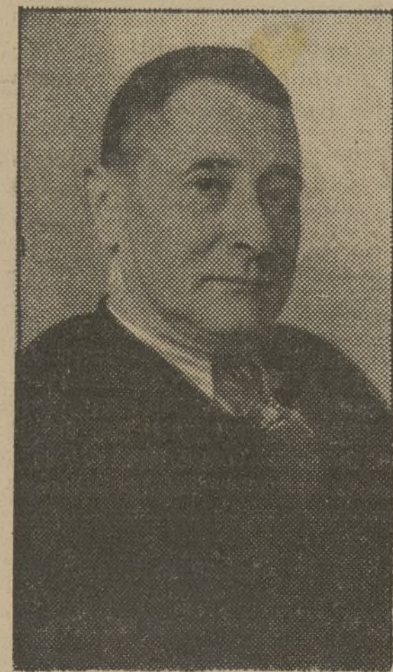
El ilustre profesor Wallon, que ayer habló al pueblo español. (Información en la pág. 2.ª)

En el corazón de la juventud española ha de clavarse una idea: LA VICTORIA SÓLO PUEDE GANARSE A PUNTA DE BAYONETA, A FUERZA DE HEROÍSMO, AUDACIA Y ESPÍRITU DE SACRIFICIO.