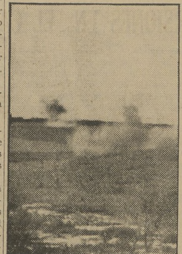
La tierra, martirizada por la artillería.

Barcelona, 24.—El consejero de Seguridad Interior ha manifestado que dentro de unos días se publicará una orden sobre los registros domiciliarios, en la que se determinará que sólo podrán practicarse los registros por aquellas personas autorizadas