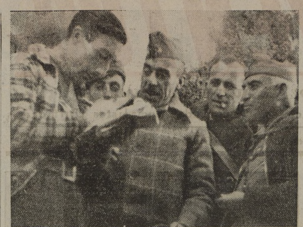
En un alto del fuego enemigo, nuestro redactor charla con los jefes militares sobre los incidentes del día.

Hay que terminar con la sexta columna: la de los cobardes. En las filas de la Juventud no puede quedar uno. El carnet de joven socialista unificado tiene que ser una credencial de valor, firmeza y abnegación.