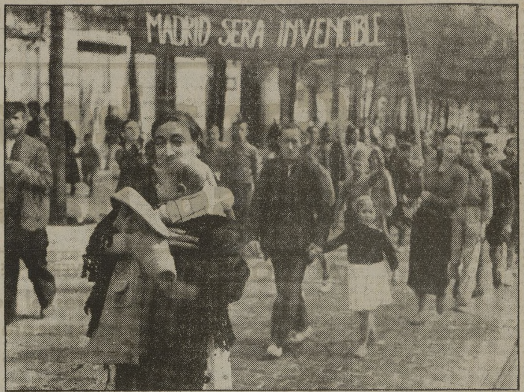
Madrid, tenso. Cada día y cada hora Madrid afirma su voluntad de lucha y de victoria.

Los asociados que tienen armas controladas por esta Asociación deberán pasar por nuestra Secretaría hoy lunes.