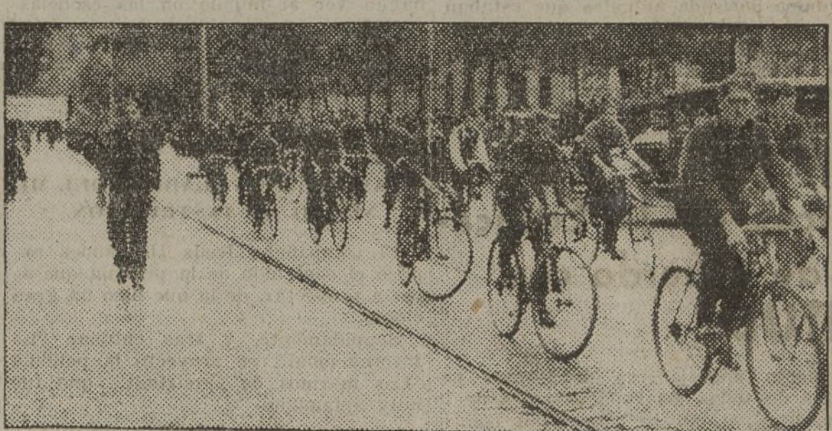
Una de las manifestaciones celebradas ayer en Madrid. Los ciclistas en cabeza.

Barcelona, 25 (12 n.).—A las tres de la madrugada terminó el Consejo de la Generalidad. Los principales acuerdos tomados fueron expuestos en el mitin de la plaza de Toros por el consejero