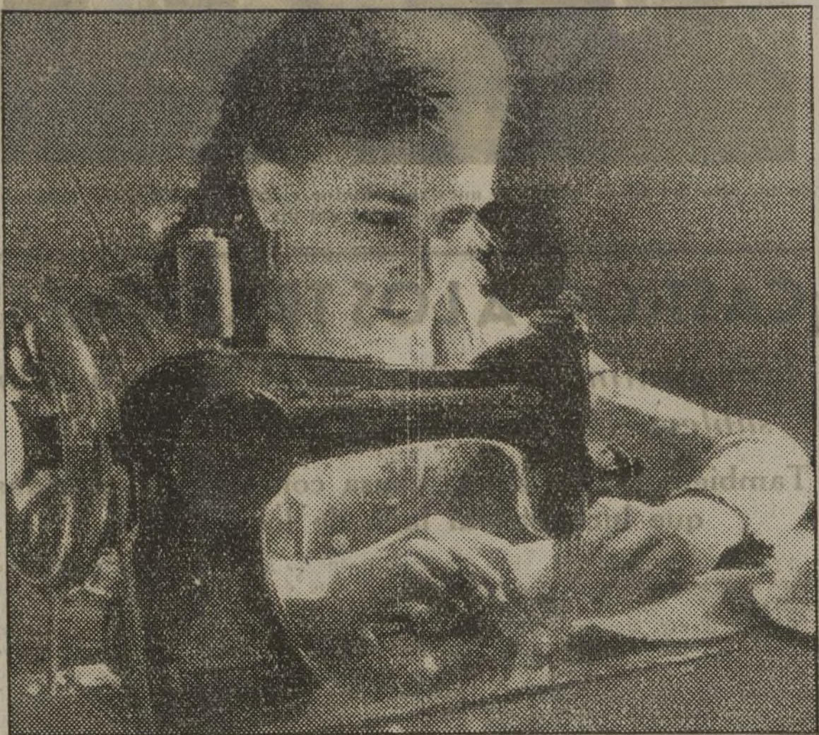
Cumpliendo con su deber de combatiente de la retaguardia, esta muchacha de Carabanchel—como millares de otras en Madrid—trabajó por la tarde, después de dedicar la mañana al aprendizaje de las armas.

Tratar de presentarla de otra manera es pueril y peligroso.