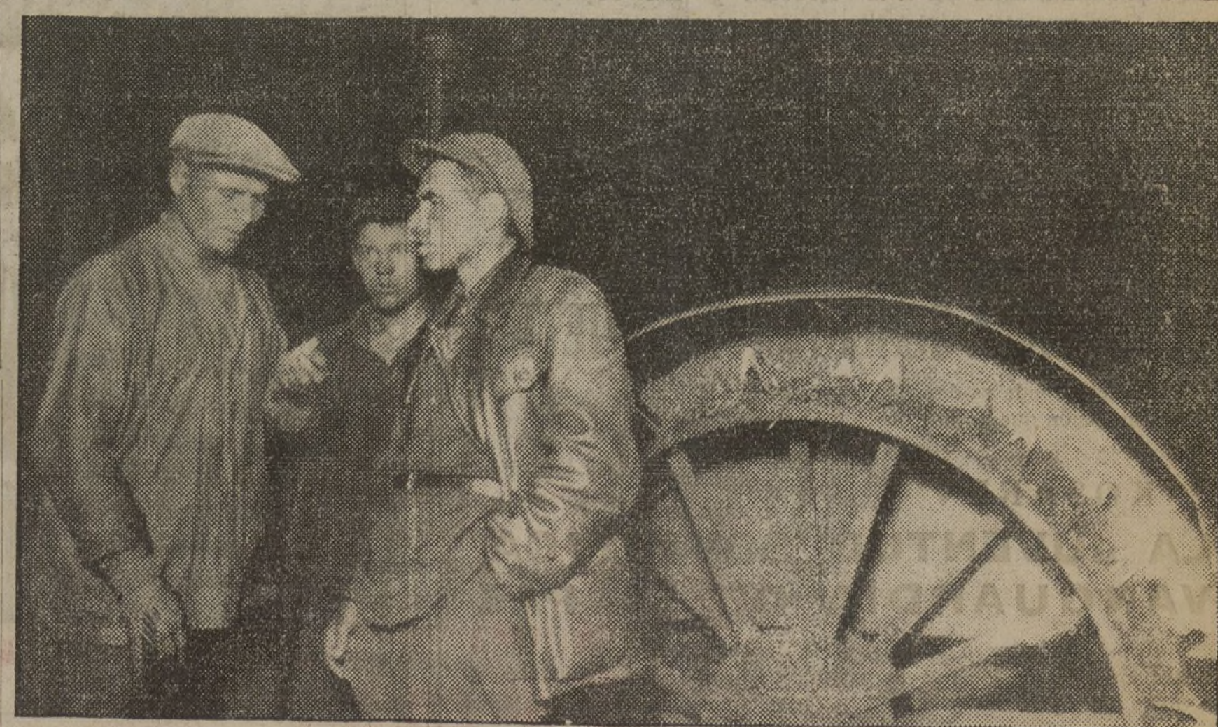
UCRANIA (U. R. S. S.).—El jefe político de un koljós llega de noche a la granja. Sabe que un tractor y otras máquinas no funcionan por falta de bujes. Y como las faenas del campo no se puede paralizar, ordena al campesino responsable que vaya a la ciudad. La escena es presenciada por un joven komsozol, que sigue atentamente las