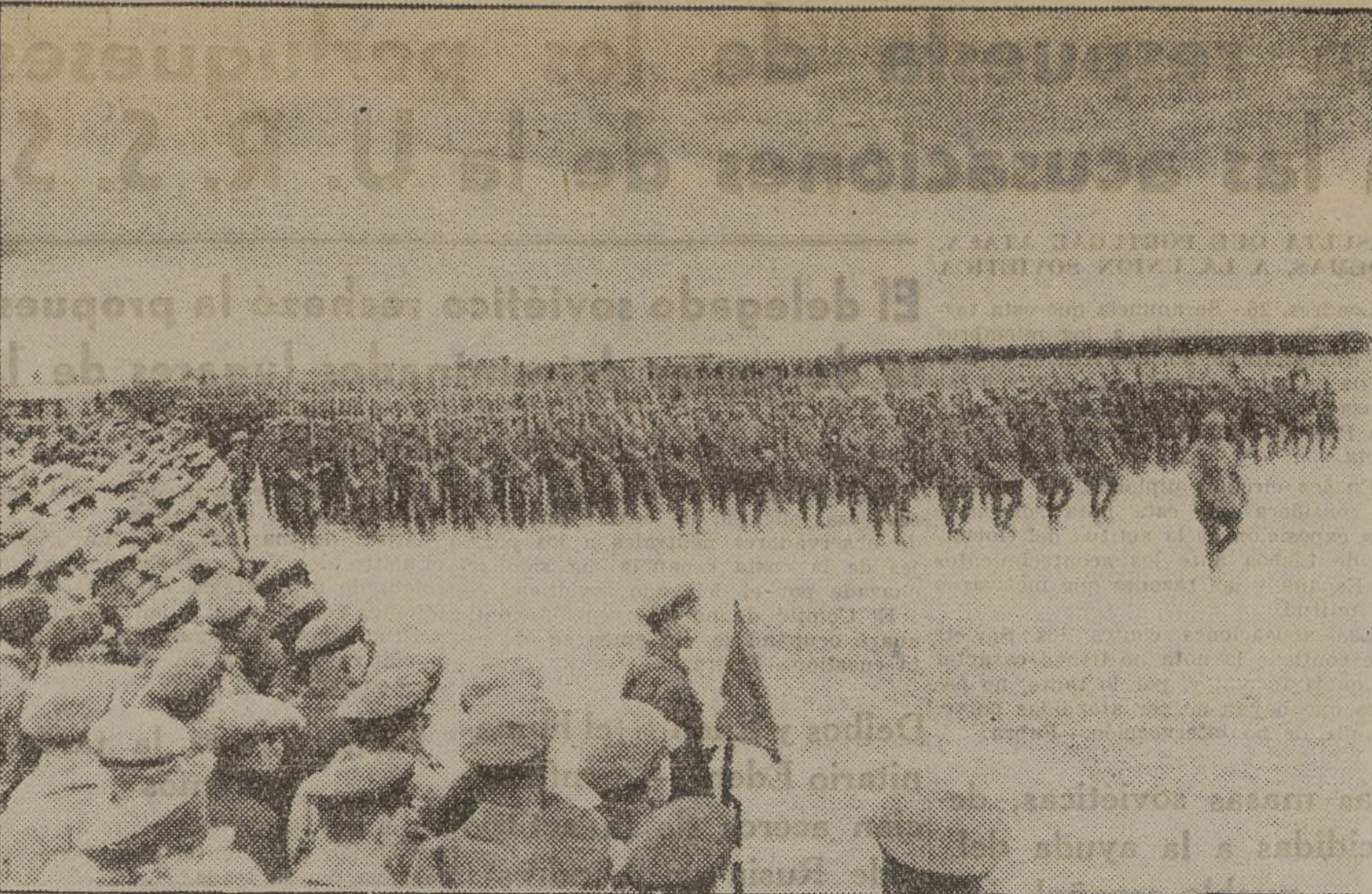
Las unidades de infantería del Ejército Rojo de la Unión Soviética durante el desfile con que terminaron las últimas maniobras celebradas en Minsk, región de Rusia Blanca.