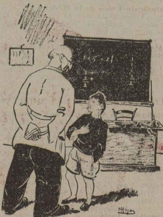
—¿Qué quieres ser, niño? —Yo... superviviente.