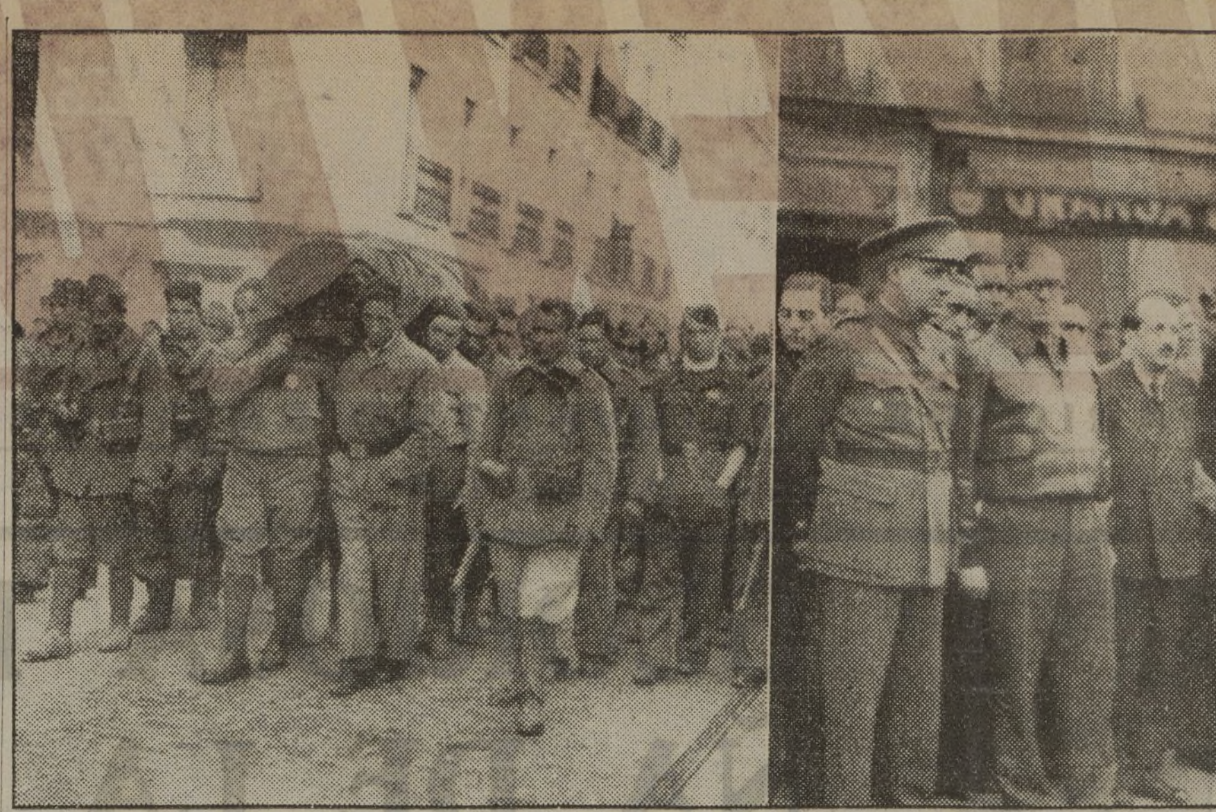
ENTIERRO DE LOPEZ TIENDA.—El féretro, conducido a hombros por los compañeros de lucha. A la derecha, el general Asensio, el ministro de Estado y el embajador de la Unión Soviética, que figuraban en la presidencia del duelo.

Horas de alistamiento: De siete a nueve de la tarde.