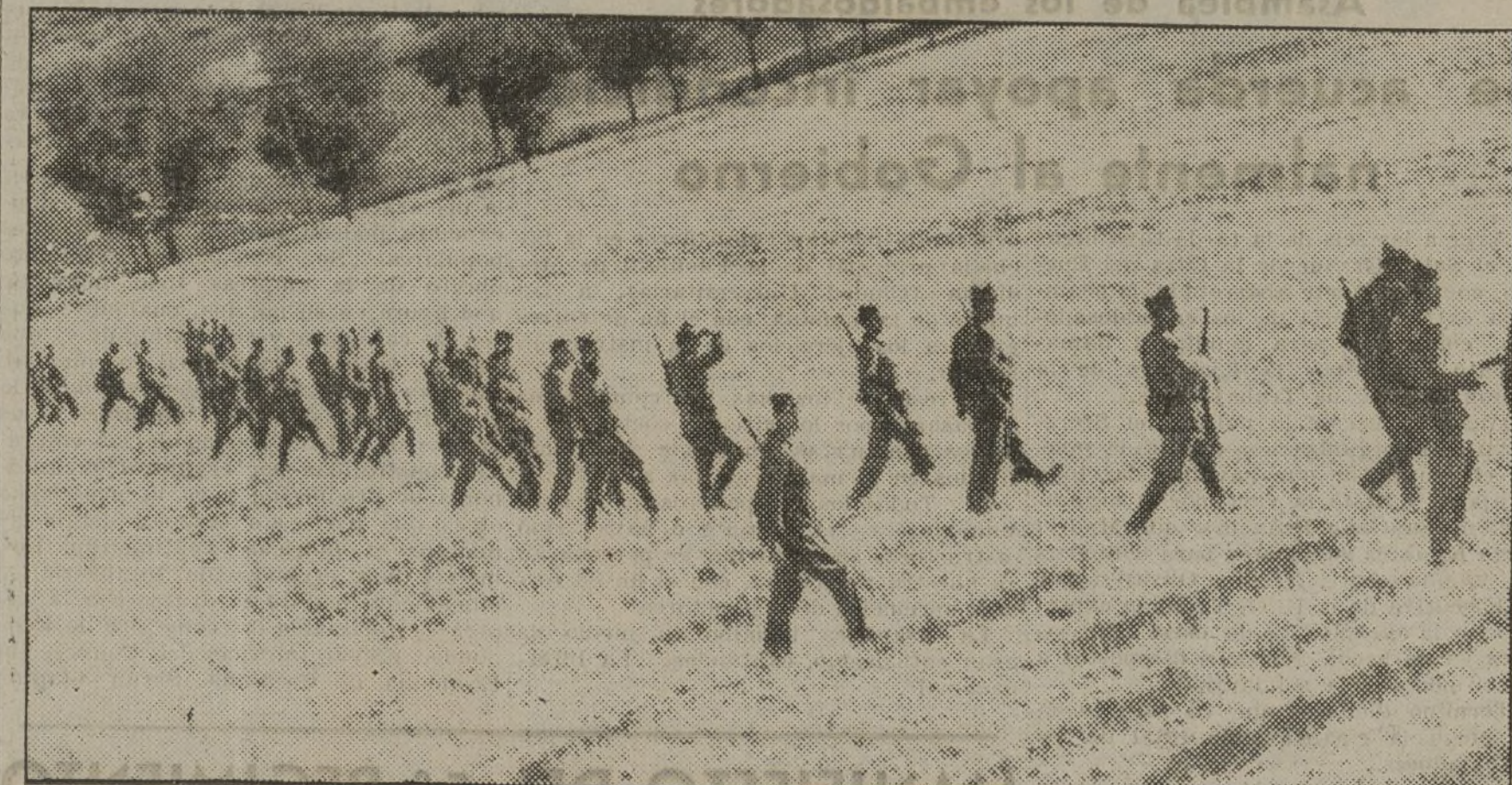
Después de un intensísimo bombardeo de aviación y artillería, nuestras fuerzas recorren el terreno para encontrar las granadas sin estallar.