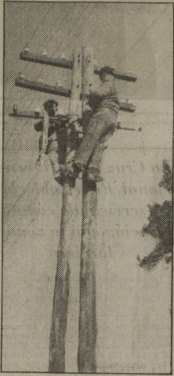
Apenas acaba el bombardeo, nuestros telegrafistas se lanzan a las líneas para reparar los desperfectos. En la guerra de hoy la comunicación rápida es elemento de inapreciable valor.