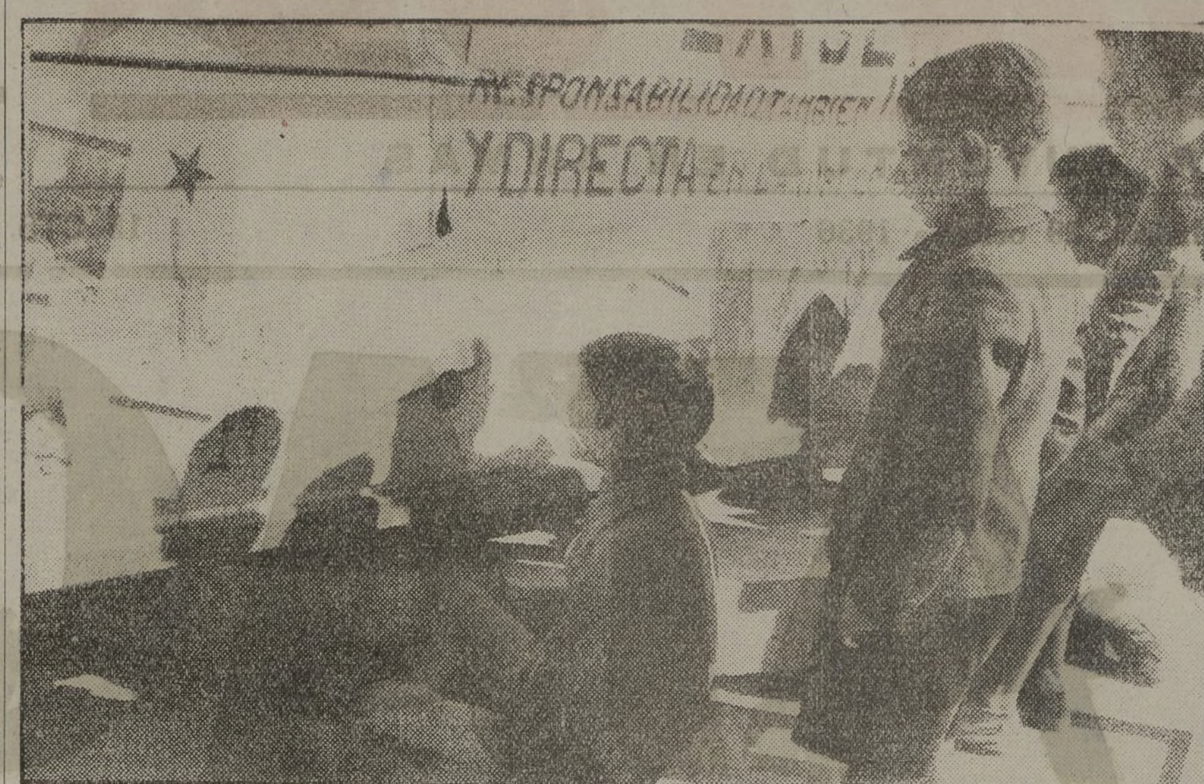
LOS CHICOS ANTE SU PERIODICO

Debajo de un cartel anunciando la película «Los marinos de Cronstadt» los niños de Madrid han colocado un periódico mural, que ellos mismos confeccionan y escriben para todos los niños.