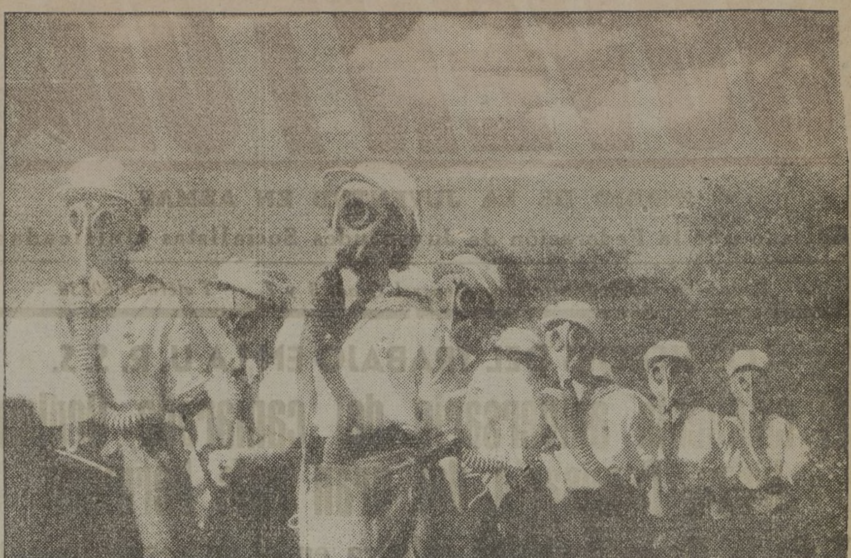
Grupo de jóvenes soviéticos, pertenecientes al equipo de anti-gas de una de las innumerables asociaciones de la U. R. S. S., desfilan al terminar la instrucción para su perfeccionamiento.