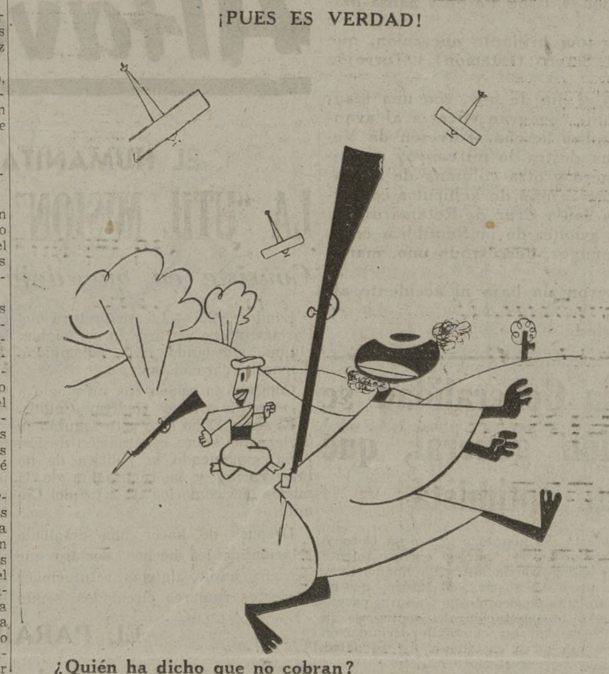
¿Quién ha dicho que no cobran?

Casi todas las noches hay también concierto, a cargo de un popular "chistulari", que se escuchó con gran atención, y a veces los acordes del "chistulari" se confunden con algún que otro disparo que parte de las filas facciosas.