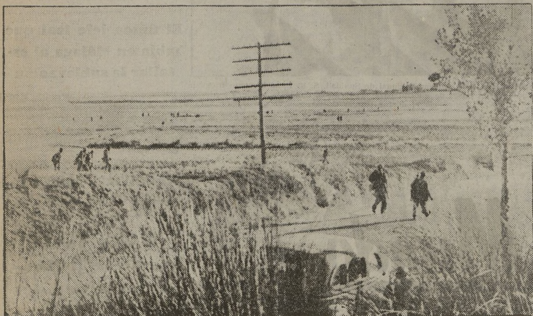
Otro momento del avance de nuestras milicias sobre Torrejón de Velasco.

Redacción y Administración: General Oraa, 5 y 7. — Teléfono 50838.