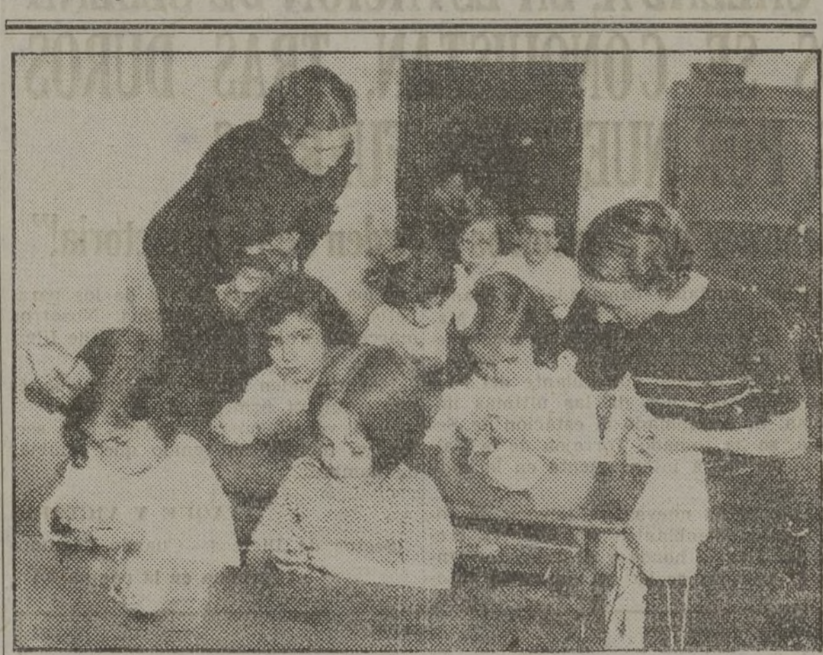
También las chiquitinas del Grupo "Luis Vives" quieren prestar su servicio a la causa del pueblo. Así vemos a unas cuantas que "quieren" hacer jerseys para los "solados", atendiendo las indicaciones de sus profesoras.

Imitemos el ejemplo los Sindicatos que les corresponda de otros que han transformado las fábricas y talleres en industrias bélicas. La construcción puede ser un factor decisivo en un momento peligroso. Si esta verdad la comprendemos todos, sólo queda realizarla. Pongámonos inmediatamente manos en esta obra de defensa que será los cimientos de donde salga nuestra ofensiva arrasadora que ponga a España, hoy esclavizada por el fascismo, en manos de la clase trabajadora.