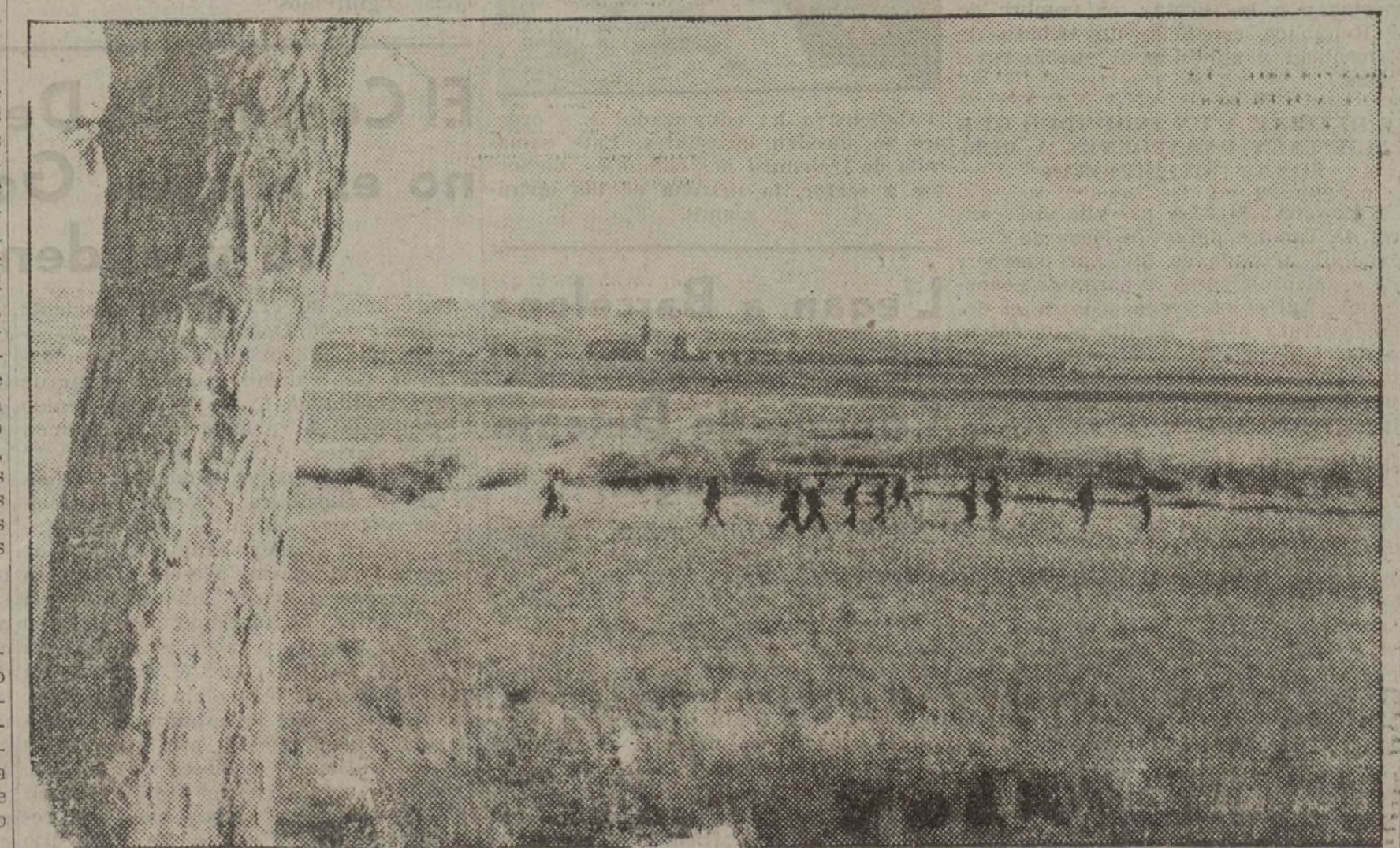
Nuestras fuerzas, desplegadas en guerrilla, avanzan por el llano. Torrejón de Velasco va a ser tomado.

En los frentes occidentales no hubo novedad destacable, a no ser que por la parte del Escampero se continúan mejorando considerablemente nuestras posiciones.—Fébus.