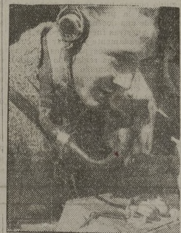
La ofensiva ha comenzado! Las órdenes se suceden incesantemente. Este camión de transmisión nos comunicará, de sector a sector, la marcha de las operaciones.

El señor Companys, como el presidente de la República, les había ofrecido su colaboración en la obra emprendida por el Consejo aragonés, ya que todas las iniciativas presentes estaban encaminadas a hacer más efectiva la lucha contra el fascismo. Preguntado sobre los apoyos y labor a realizar en el futuro, ha dicho que el Consejo era para rehacer la economía de Aragón, perturbada por el levantamiento fascista, que velaría por los prestigios y los fueros políticos y sociales de Aragón. Para ello, contaban con el apoyo decidido del Frente Popular, que está representado en el Consejo. También dijo que se proponían marchar a Madrid para solicitar el asenso del Gobierno de la