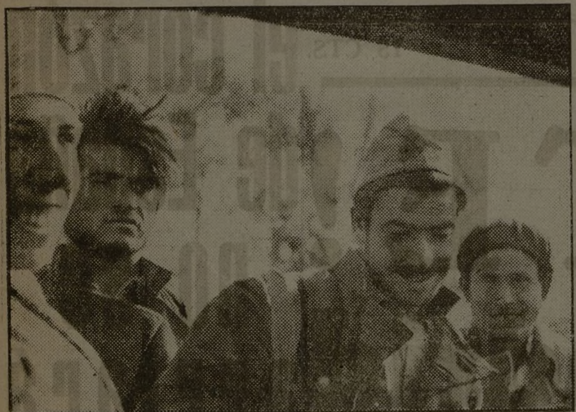
Control. Examen de papeles y cruce de unas frases. Parece que por allí hay jaleo, ¿eh? Un gesto, un buen deseo de despedida y adelante!