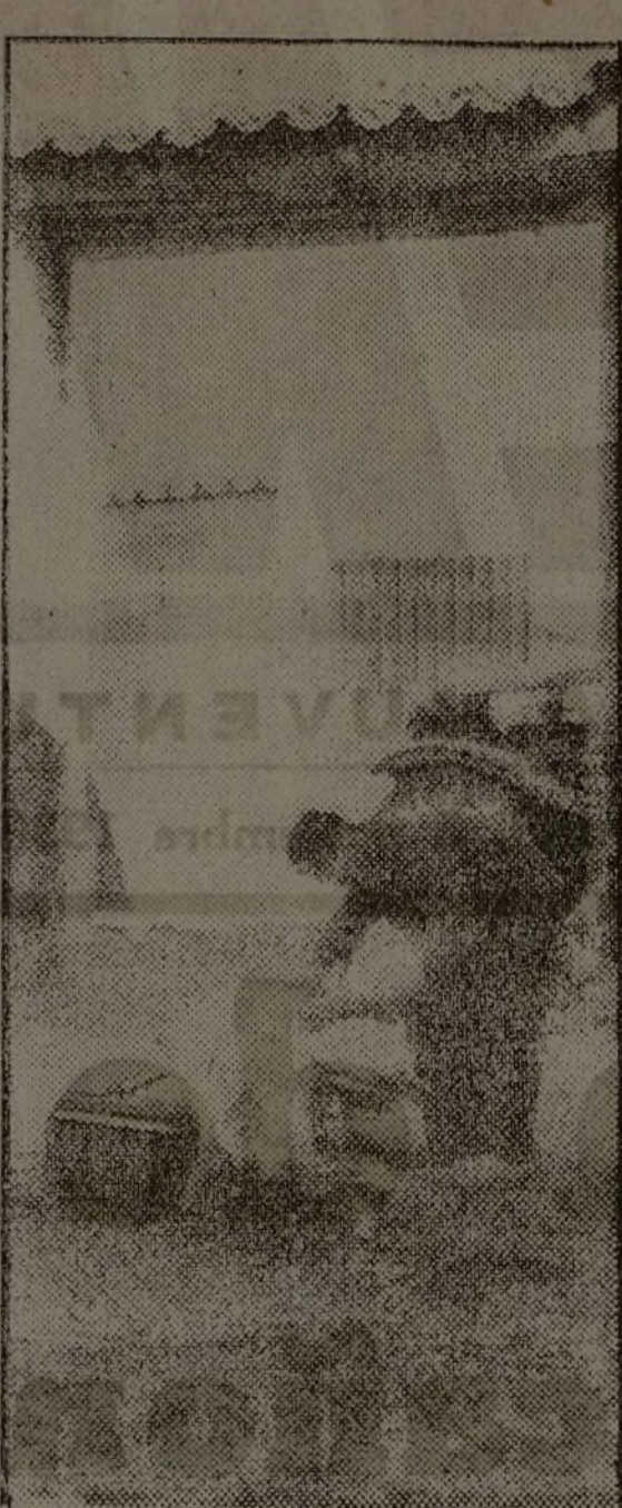
Ayer se cogió al enemigo este cerdo. Ayer, a lo mejor, era un oficial; hoy es promesa de un plato succulento.

También coincidieron en la unión con la U. G. T. para el ideal común.—Fébus.