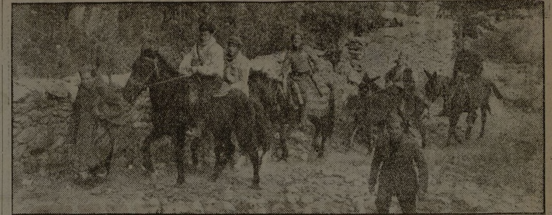
En uno de los últimos ataques, nuestras tropas penetraron en terreno enemigo y cogieron a los facciosos en las baterías, que ahora utilizan para llevar a las avanzadas de la primera línea.

Roma, 4.—En los círculos romanos bien informados se considera como pura fantasía la información, según la cual las autoridades navales alemanas e italianas de Tánger han concertado una entente con vistas a acciones comunes.—Febus.