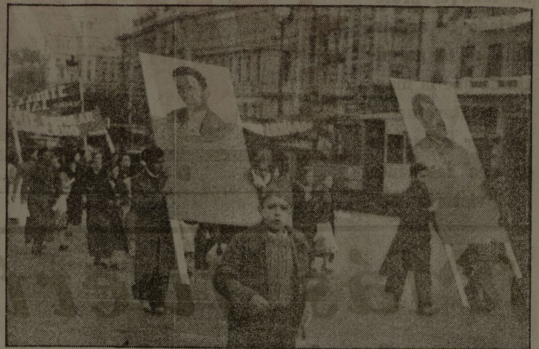
Los niños, los jóvenes, llevando al frente los jefes de la revolución mundial, gritan su decisión de que Madrid sea invencible.

Su objeto es reclamar la reforma de la ley de distribución de socorros. Hoy celebrarán dos grandes mítines al aire libre en el centro de Londres. El Gobierno se ha negado a recibir a los representantes de estos obreros. Fabra.