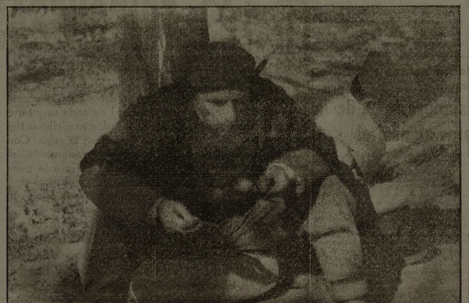
Un descanso en la lucha. Un miliciano come y otro lee. Luz de atardecer. La batalla tabletica a lo lejos.

Barcelona, 7.—En el frente de Ter, la primera centuria de la columna Torres Benedicto ha efectuado un avance de las líneas enemigas, conquistando algunas posiciones.—Febus.