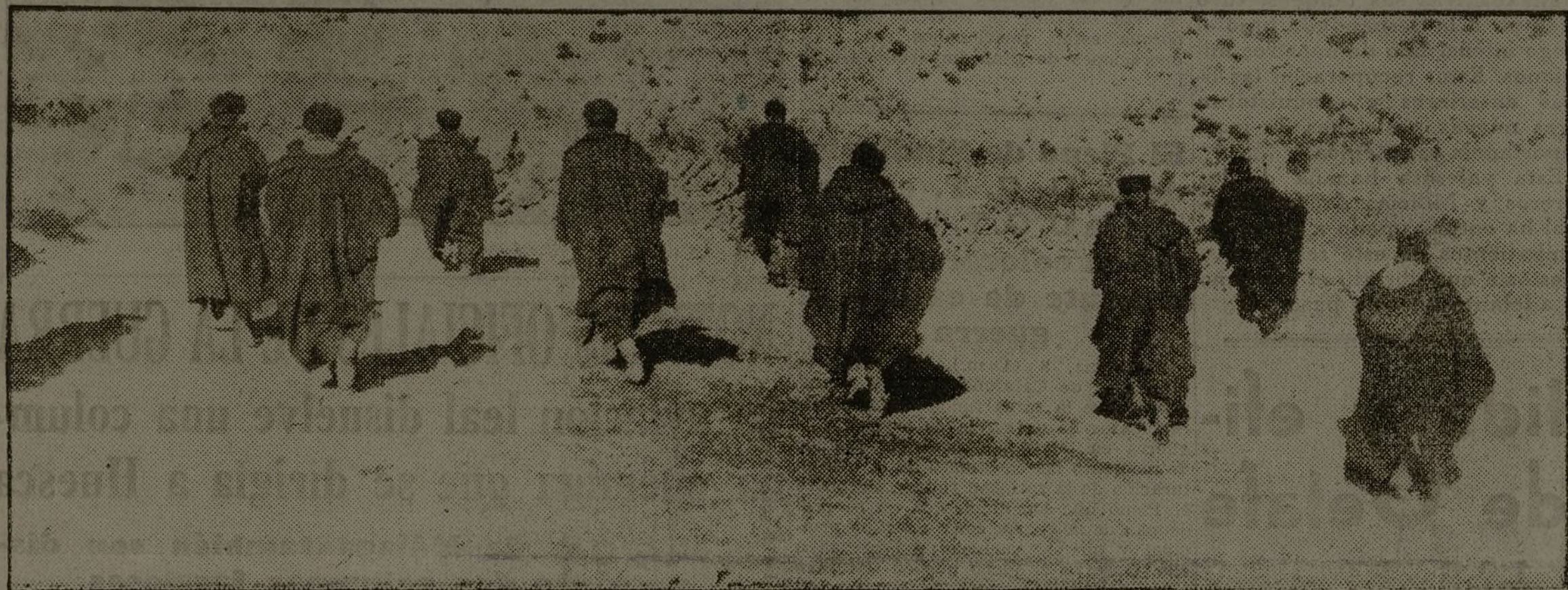
Las tropas leales inician un avance. Paso lento, mirada atenta... Un tiro por la espalda a quien retroceda. Nos jugamos la suerte del proletariado.