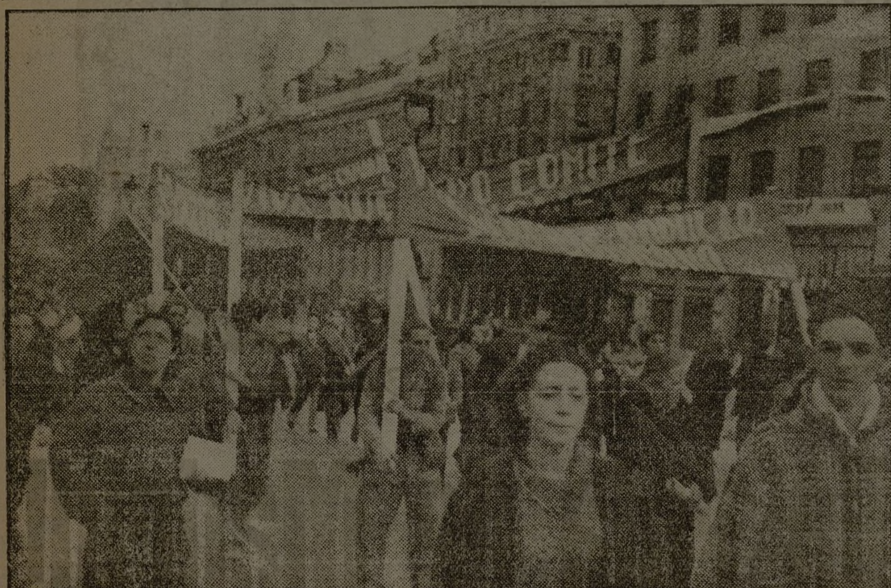
Las muchachas madrileñas son las primeras en dar ejemplo de decisión y entusiasmo para la defensa de su Madrid.

No es posible que el mundo se deje convencer de que precisamente ahora los Soviets amenazan la paz y que na la amenazaban cuando solamente tenían un fin concreto, y lo aclara el hecho de que la actual Alemania—que dirige la acción—posea todavía un tratado de amistad con la Unión Soviética. Los Soviets tienen desde el año 1924 un tratado de colaboración amistosa con Italia y están en buenas relaciones con Polonia y otros Estados.