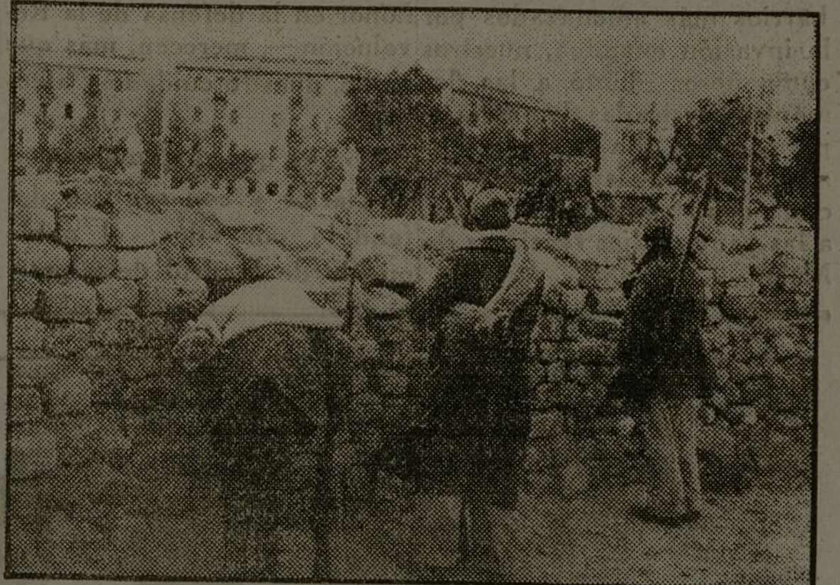
Fuente de suministro en las montañas de Madrid.

Barcelona, 8 (1 m.).—El consejo de Defensa ha redactado el siguiente parte: "Siguen nuestros avances en varios sectores del frente aragonés, habiendo tomado nuevas posiciones, y hemos fortificado las tomadas últimamente. No se dan detalles de nuestros avances porque están relacionados con otras operaciones de gran importancia.—Febus.