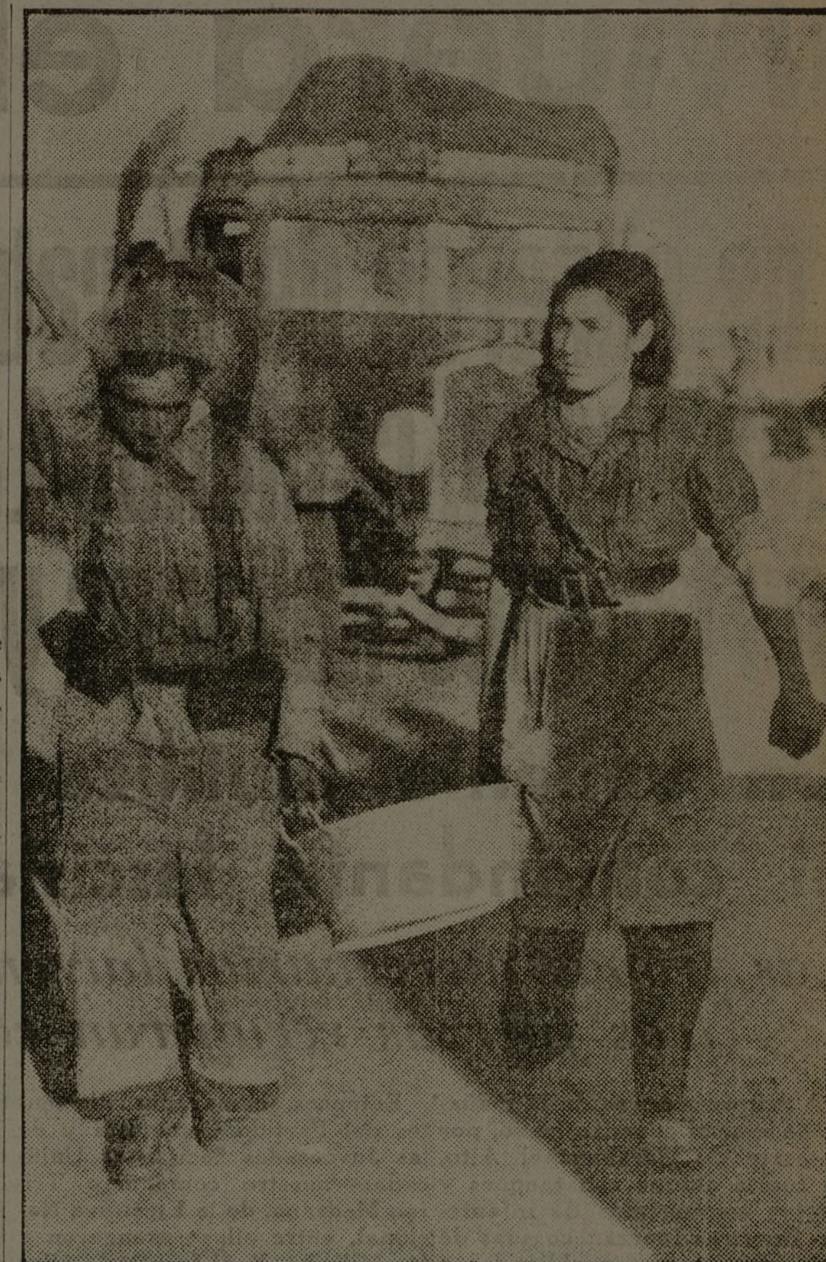
Las mujeres luchan como los hombres. He aquí una muchacha de nuestras heroicas Juventudes Socialistas Unificadas en la línea de fuego. Tiene un rostro tenso por la emoción. Esa pareja de luchadores ha puesto en peligro su vida por llegar allí...

¡Que toda la solidaridad y el calor de los ciudadanos de Madrid esté junto a los heroicos defensores de sus barricadas!