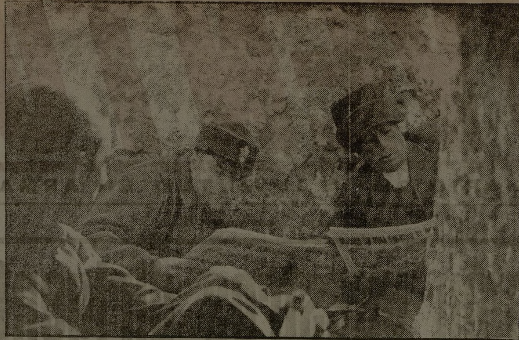
Trinchera de la primera línea de fuego. Llegada de nuestro periódico. Se discuten las intenciones de la lucha. ¡Ni un paso atrás! Resistir un cuarto de hora más es ganar la guerra.

El realismo establecido en la Constitución staliniana imprime su sello a este 7 de noviembre. Al desfilar estos triunfadores no olvidan en ningún momento a sus hermanos de clase de los países capitalistas. Hoy más que nunca se ha visto la solidaridad internacional del pueblo soviético con todos los luchadores honrados contra el fascismo y con los defensores de la paz. Millares de millares de carritos escritos en español y en ruso, dibujos de "Pasiónaria", José Díaz y otros jefes del Frente Popular de España, gritos y vivas a la libertad heroica de España y las atenciones y cariños prestados a los delegados españoles son la prueba más patente. Después del desfile del pueblo soviético ante el mausoleo, desfilaron los delegados de España, y de la tribuna del mausoleo descendieron los camaradas Kaganovich, Milovan, Buldunov y Rosengolz, que estrecharon la mano y charlaron fraternalmente con todos los delegados de la España en guerra contra el fascismo. Después del desfile efectuado en la Plaza Roja, las masas moscovitas han continuado la fiesta en las calles, adornadas y potentemente iluminadas, que respiran la alegría y el bienestar de la feliz capital de la patria proletaria.