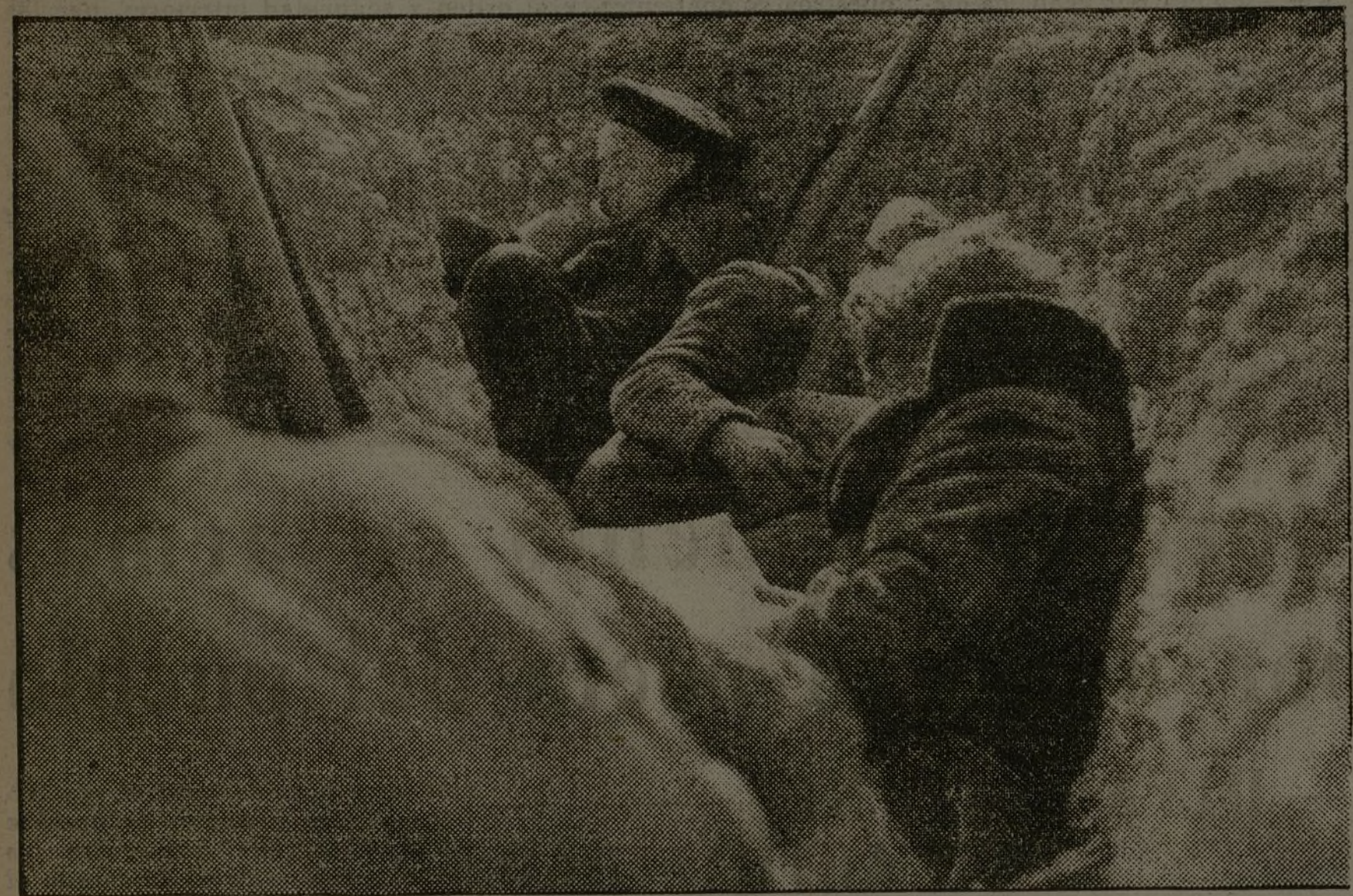
Fotografía de un parapeto. Visión auténtica de una trinchera. Se descansa junto al fusil o leyendo el periódico. Esperando... Nuestra más firme seguridad de triunfo está en estos bravos camaradas. ¡Ni un paso atrás!

Su muerte queda en pie como ejemplo de disciplina revolucionaria. Que nuestros jóvenes combatientes se miren en su conducta.