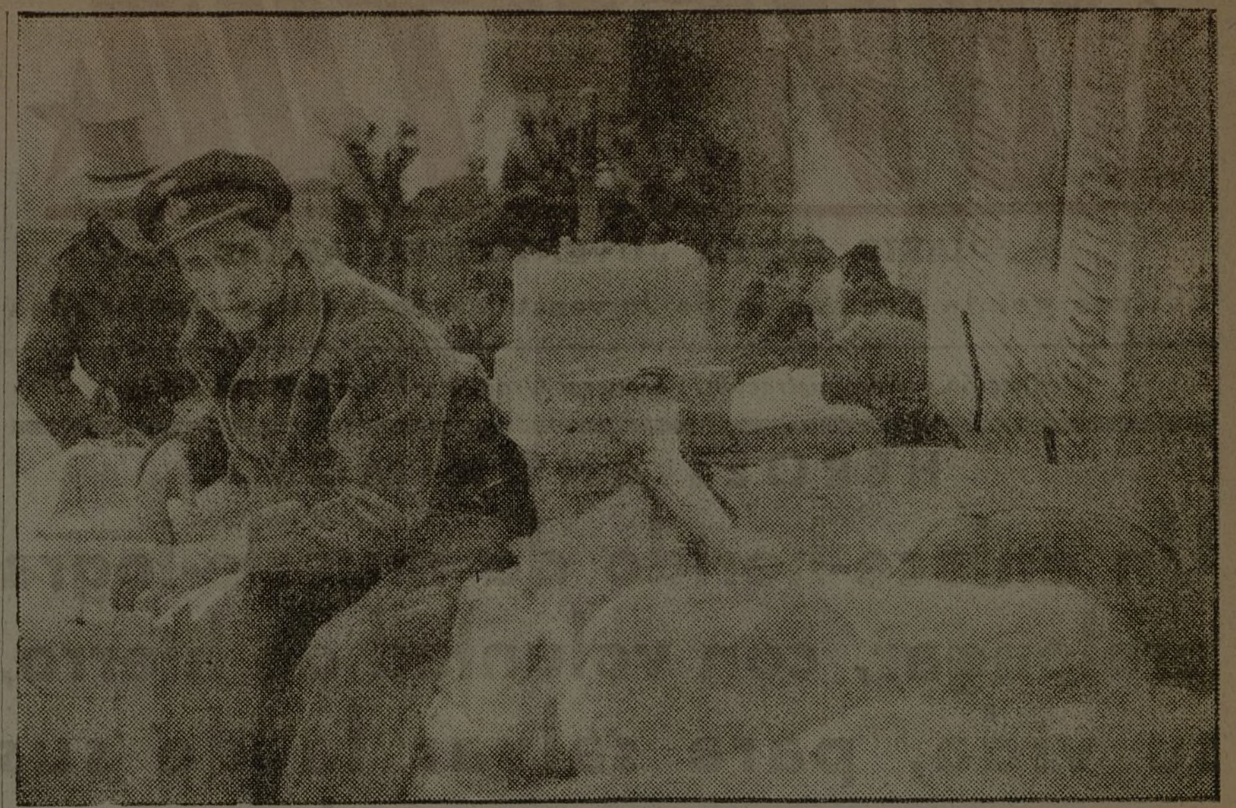
Convoy de Intendencia llegado a las primeras líneas de la zona del frente de Madrid: tabaco, mantequilla, patatas, vino. Todos debemos sacrificarnos para que no falte nada en la vanguardia. La victoria exige el sacrificio.

El primer Consejo de ministros celebrado en Valencia ha sido un Consejo de guerra, dedicado enteramente a la guerra, y en él se ha adoptado, en principio, la creación de un organismo que, salido del mismo Gobierno e integrado por cada una de las tendencias en él representadas, acelere la consecución de la victoria.—Fébus.