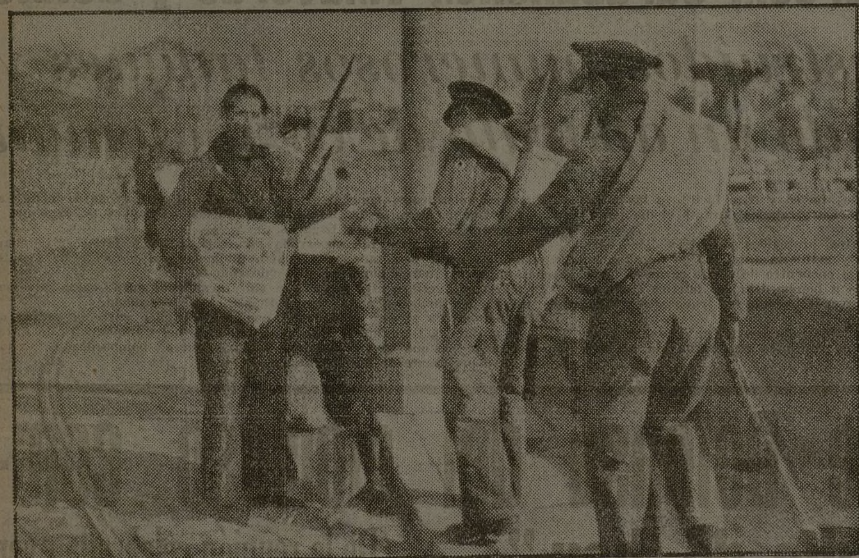
Un joven compañero reparte nuestro diario a dos guardias de Asalto relevados de un servicio de vigilancia. Es la primera hora de la mañana. Los periódicos se recogen del suelo, se arrebatán de las manos a nuestros camaradas. ¡Salud!

MONUMENTAL CINEMA. —Sección de Propaganda del Ministerio de Instrucción pública y Bellas Artes. A las 4 y 6.30, la formidable película soviética ¡La patria os llama! (La epopeya de la aviación soviética.) Precios populares.