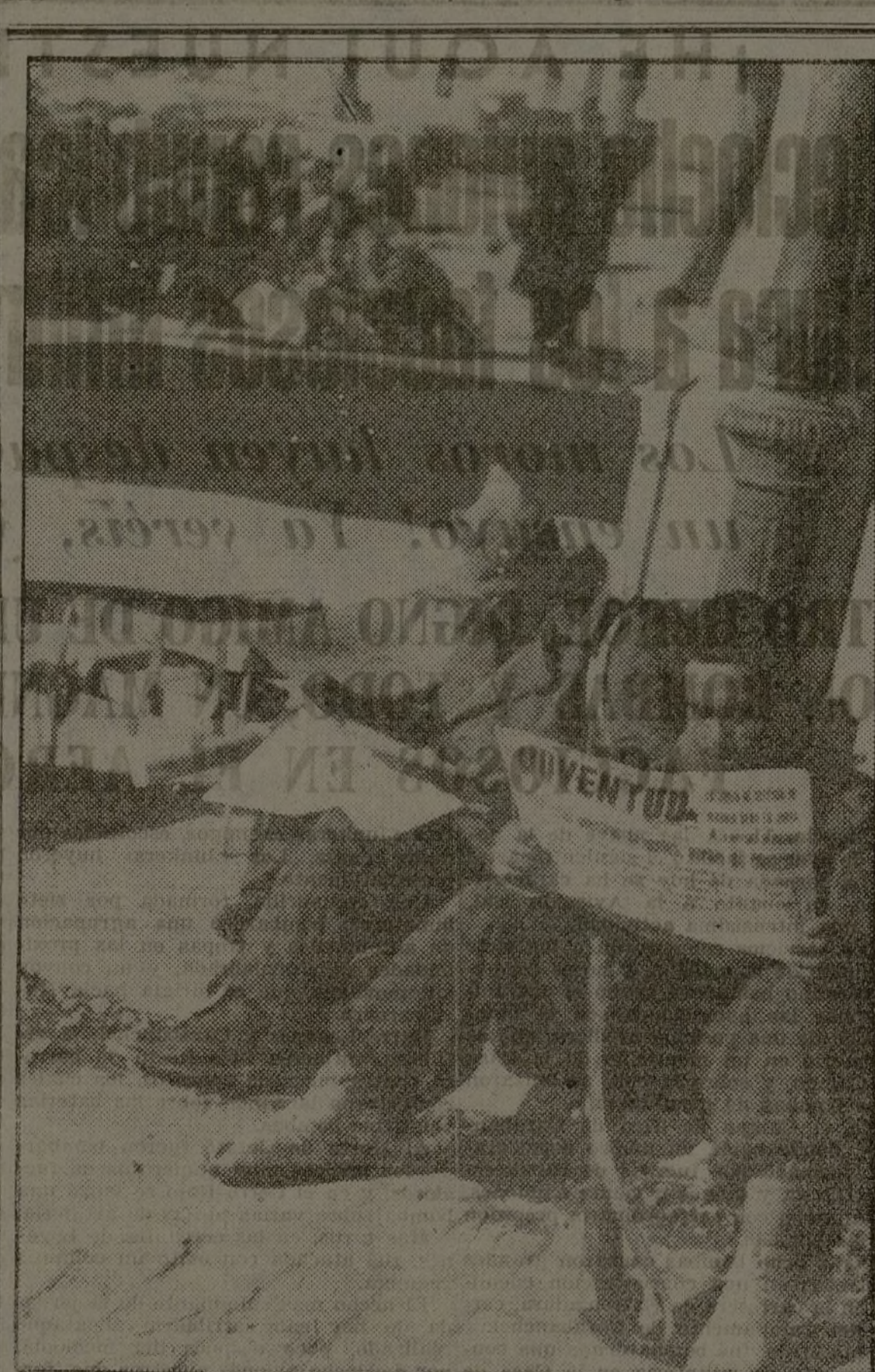
Dos militianos, después de un relevo, descansan al sol otoñal de Madrid. Leen nuestro diario, donde comprueban la firmeza de la retaguardia. Es un alto en la lucha. Y un paso más hacia la victoria.