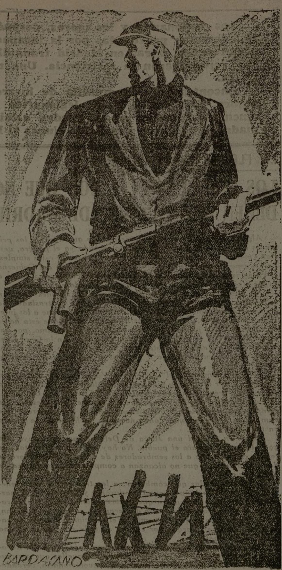
MADRID SERA SIEMPRE DE SUS OBREROS

Al igual que en la Junta de Defensa de Madrid, en el ministerio de la Guerra, a última hora del día de ayer, las noticias que se tenían eran muy favorables para las tropas de la República.