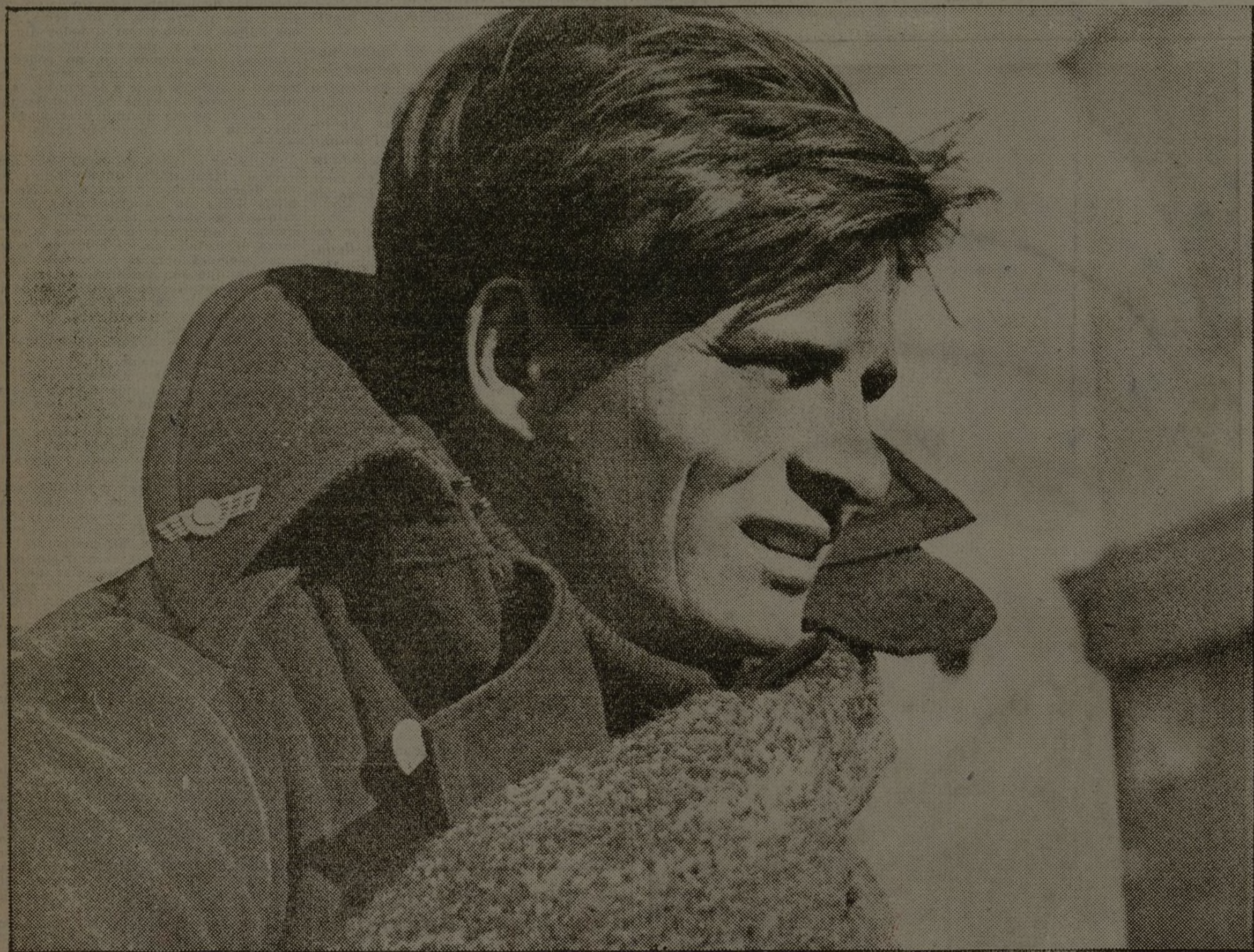
Marinero. Compañero de armas del camarada Chico, de Col... Uno de los que combaten en las cercanías de Madrid. La ciudad libre de Madrid les debe su gratitud, que se está cumpliendo con serenidad y firmeza, con la fe inmensa en la victoria, con el ánimo abierto ante los aviones negros y los cañones italianos.

Formidable es nuestra quinta columna! Tengamos confianza en ella y en sus héroes.