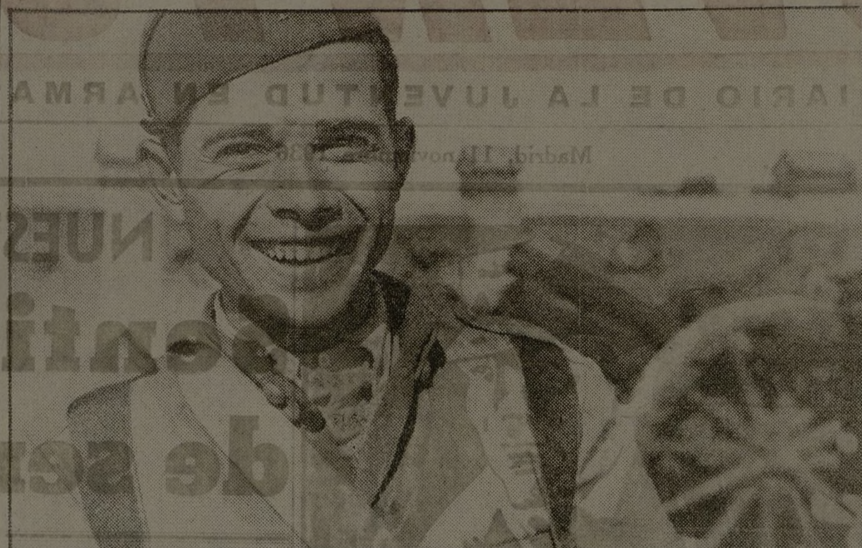
Un militiano artillero sonríe a la cámara. Sonrisa de joven luchador: abierta, franca... Madrid te confía, artillero, su corazón, puesto al rojo por la guerra civil. ¡Ni un paso atrás!

Hubo imbéciles que creyeron que los madrileños eran gallinas. Pero la historia de las gallinas se acabó desde hace mucho tiempo. Desde el principio de la guerra civil, desde el tiempo de la conquista del cuartel de la Montaña. Atribuir cobardía a los madrileños era encubrir su propia cobardía.