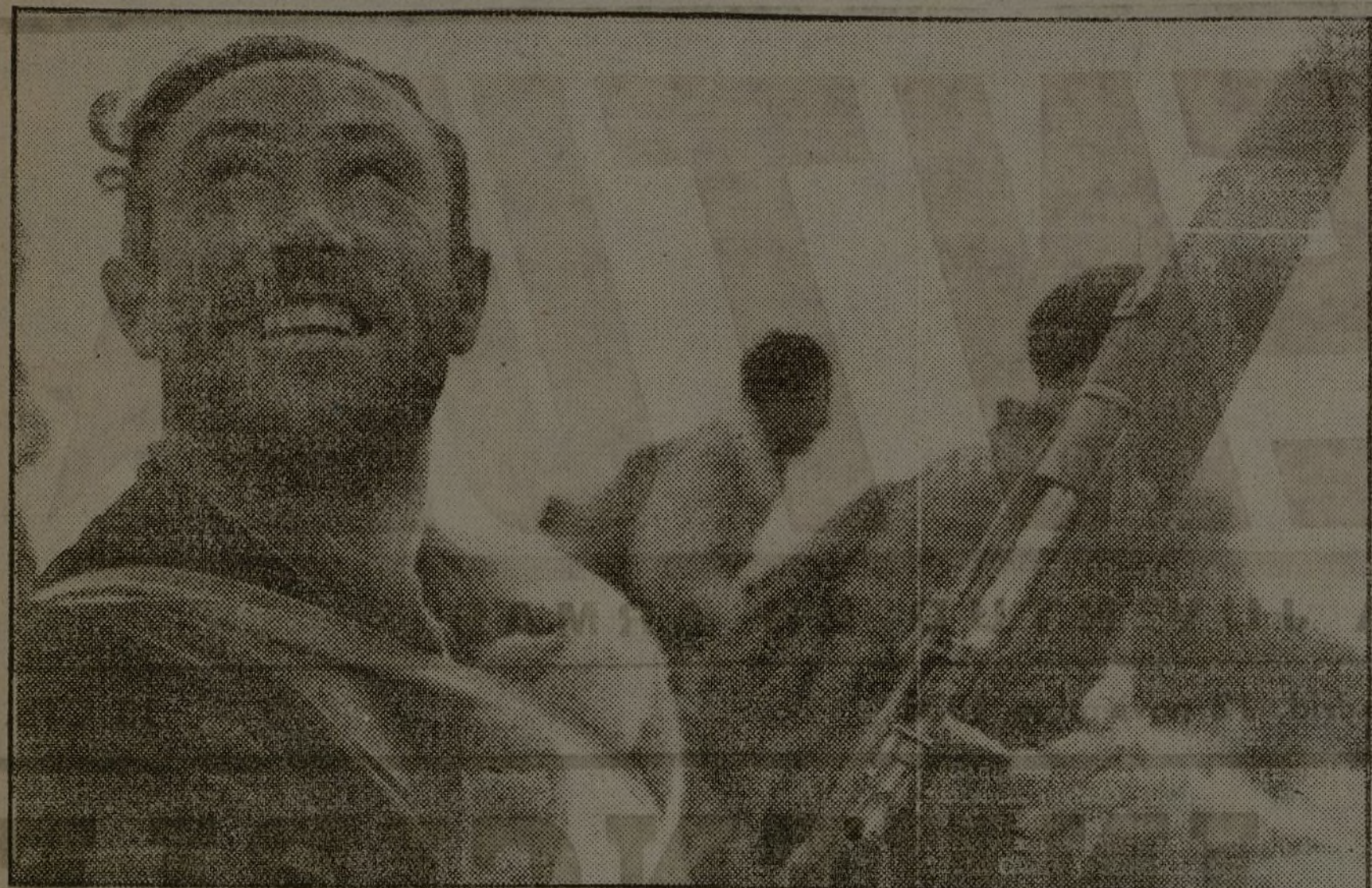
En las trincheras, donde se cierra el paso al enemigo, nuestros hombres permanecen firmes esperando la orden de atacar vigorosamente para avanzar. Es la nueva moral que llega a la retaguardia, que hace del hombre más indiferente un combatiente valeroso para la defensa de su Madrid.