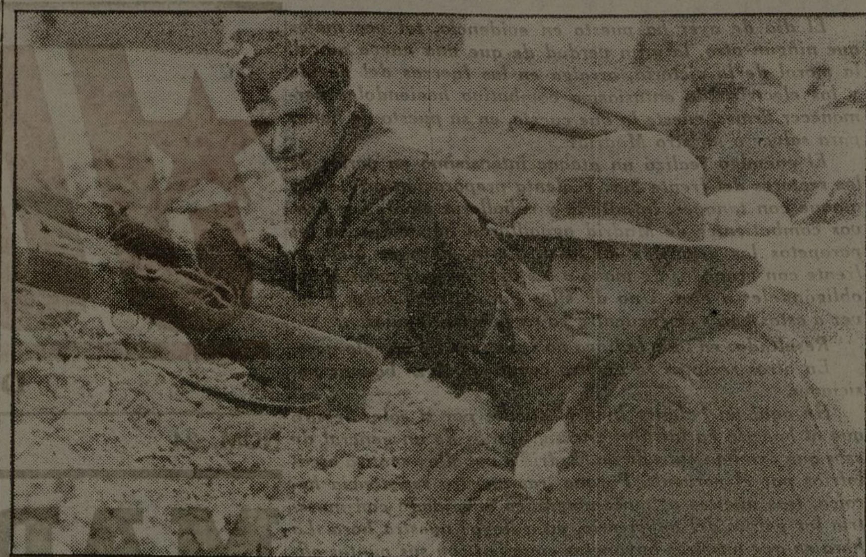
Jóvenes en las trincheras que han de ser la fosa del fascismo; jóvenes que no ceden un milímetro ante el furioso ataque de los mercenarios de Franco; jóvenes en todos los sectores, en noble emulación con los adultos, con los bravos obreros que se batan con odio contra las tropas de los terratenientes y de los banqueros.