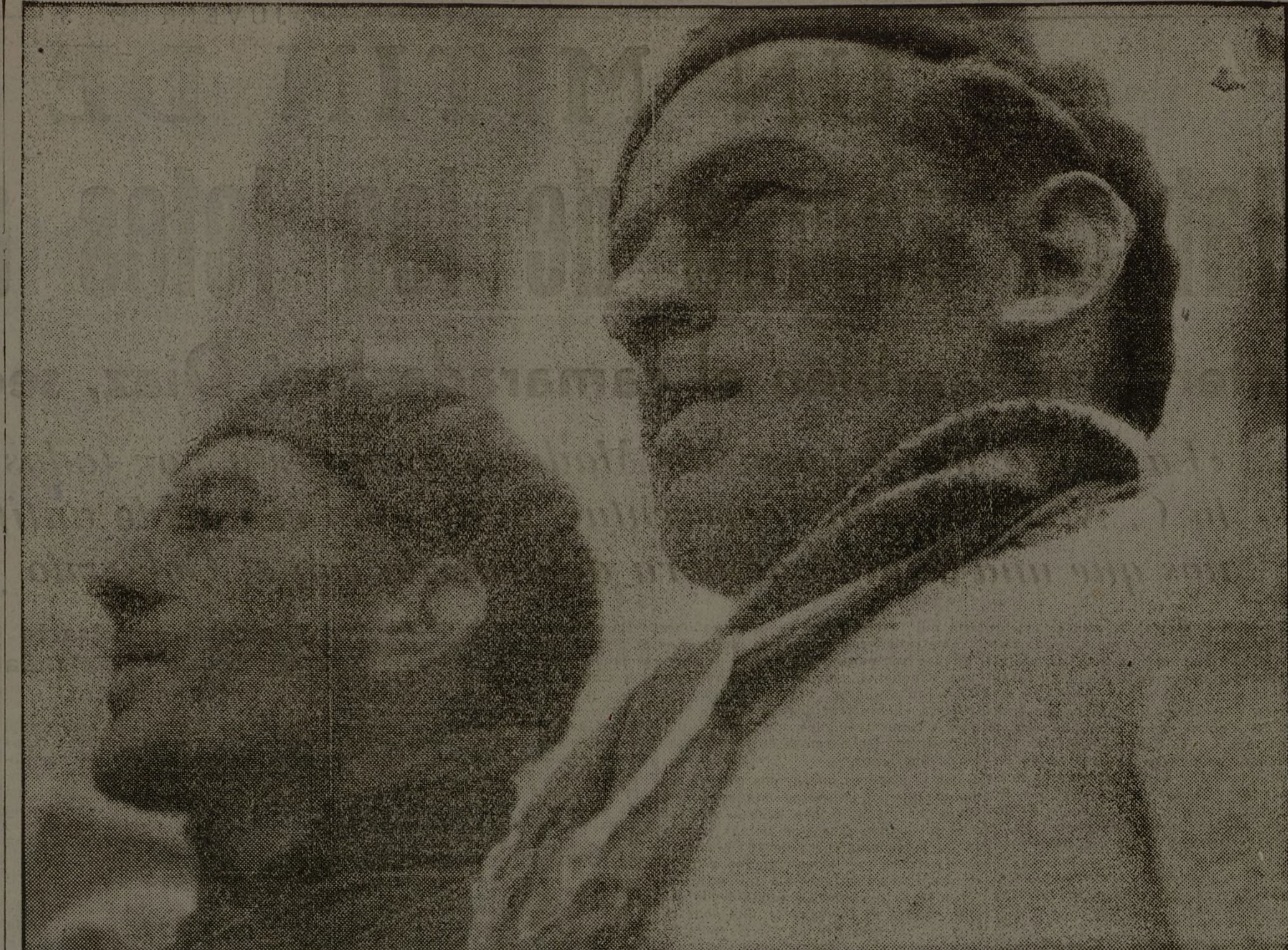
Son hombres fogueados, curtidos por las luchas sociales o por el fuego duro de la Gran Guerra. Son hombres valientes, disciplinados, audaces. Pertenecen a la Columna Internacional.

Reciba, pues, la 26.ª compañía de Asalto nuestro más cordial saludo y nuestra confianza en su arrojo y valor.