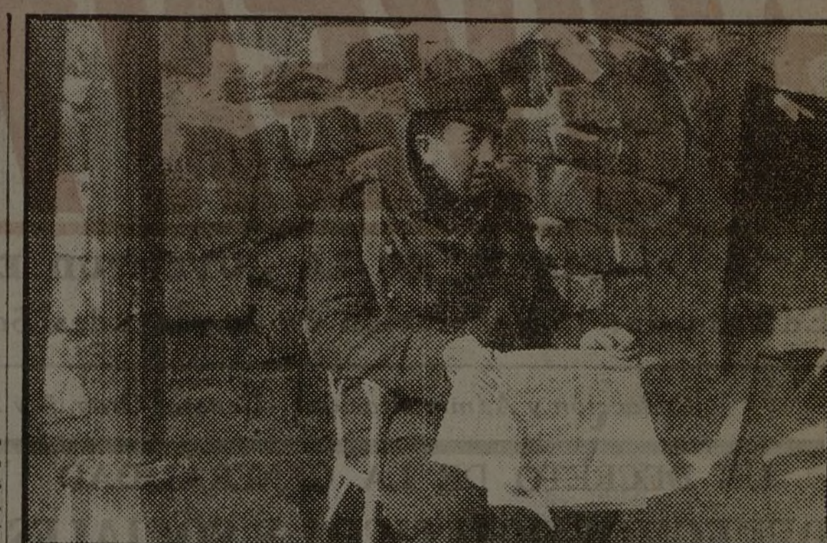
La moral de la victoria es la orden de guerra para todos los que cierran con sus fusiles el paso a los mercenarios de Franco. Los guardias de Asalto, primeros en la organización de este gran Ejército nuestro, siempre han estado dispuestos en las duras jornadas para suplir todas las faltas con su entusiasmo inagotable. Como este de la 15.ª compañía de Reserva, que no sabe lo que es volver la cabeza atrás frente al enemigo.