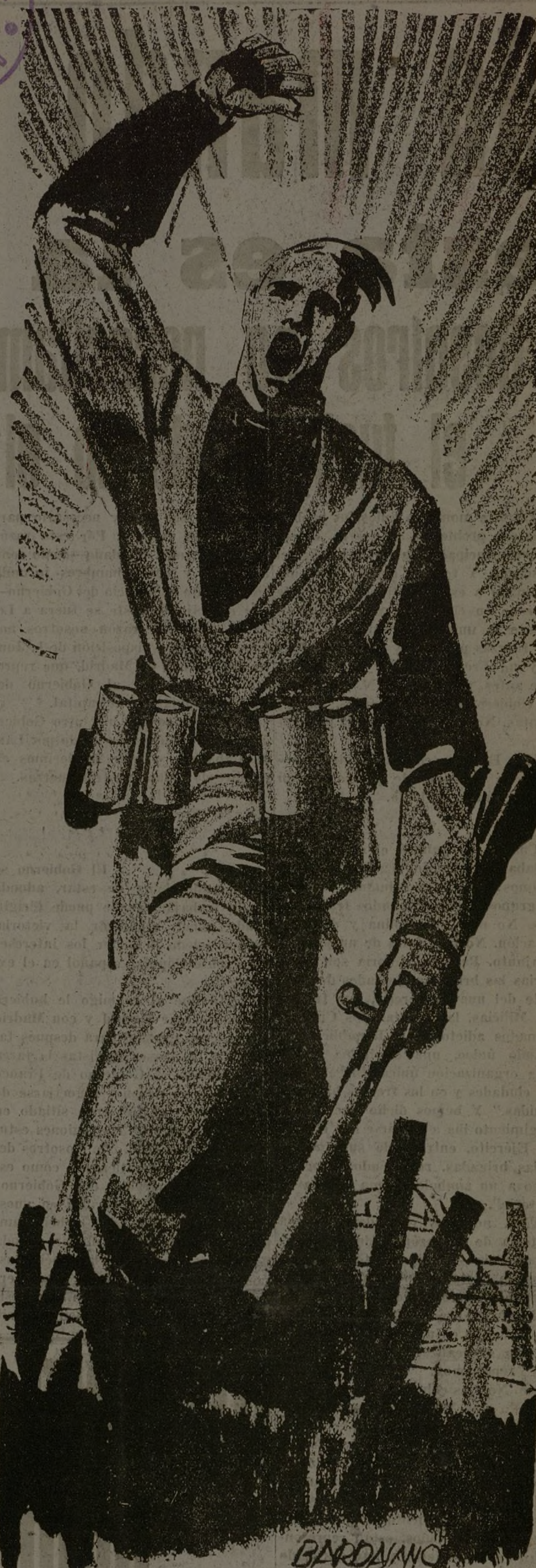
CAMARADAS: ADELANTE HASTA APLASTAR A LOS QUE ASESIAN NUESTRAS MUJERES E HIJOS!

La Delegación del pueblo español en Leningrado ha recibido grandes manifestaciones de cariño y solidaridad de todo el pueblo trabajador y representaciones oficiales de esta capital soviética. Ha sido invitada por los obreros de las fábricas «Kirov», «Stalín» y «Skerejed».