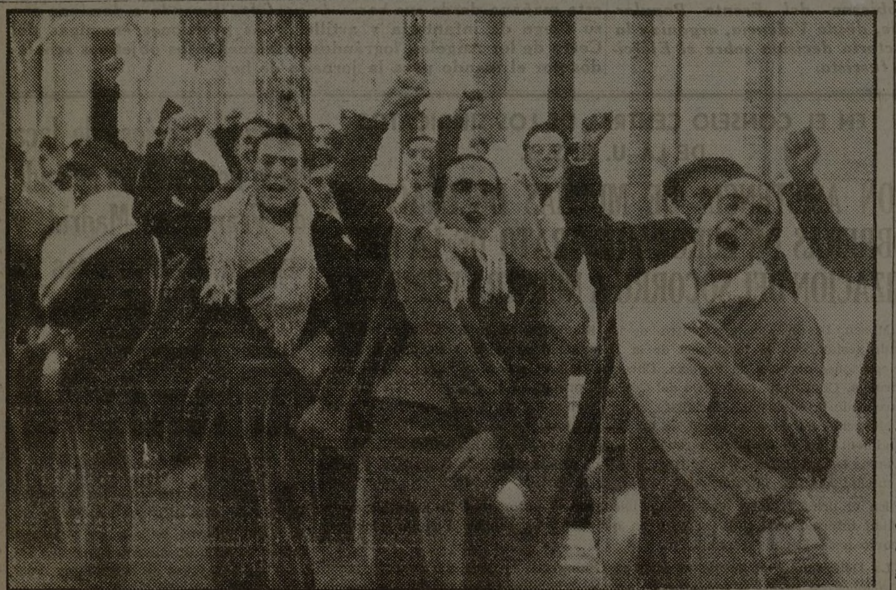
Una sección del batallón de choque “Comuna de París”, del 5.º Regimiento. Son muchachos de Madrid, que no admiten la larga espera de la llegada de armas para marchar al frente. Y van. Con naturalidad. Impacientes por entrar en fuego. Al recibir la orden sus rostros son la mejor demostración de su alegría.