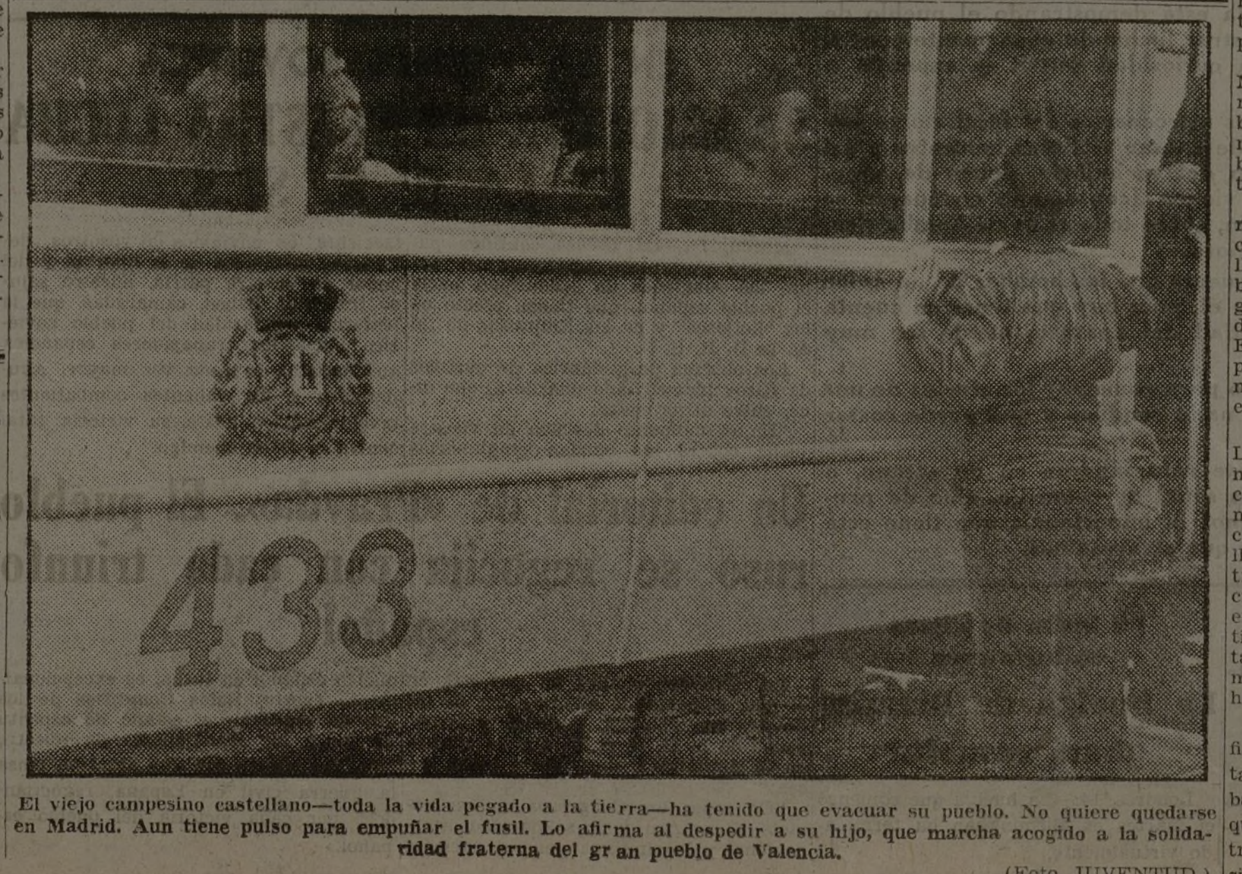
El viejo campesino castellano—toda la vida pegado a la tierra—ha tenido que evacuar su pueblo. No quiere quedarse en Madrid. Aun tiene pulso para empuñar el fusil. Lo afirma al despedir a su hijo, que marcha acogido a la solidaridad fraterna del gran pueblo de Valencia.

Ya no será el doctor Schacht, como en los primeros tiempos del régimen, inamovible e irremplazable. Por lo visto, dada la situación en que Alemania se encuentra, deberá evitar las objeciones para permanecer en su puesto; en el caso contrario, tendría que irse. En todo caso estará bajo la vigilancia directa de Goering. Esto de la "vigilancia directa" pertenece al estilo de los periódicos nazis. Caracterizada con él los nuevos plenos poderes adquiridos por Goering.