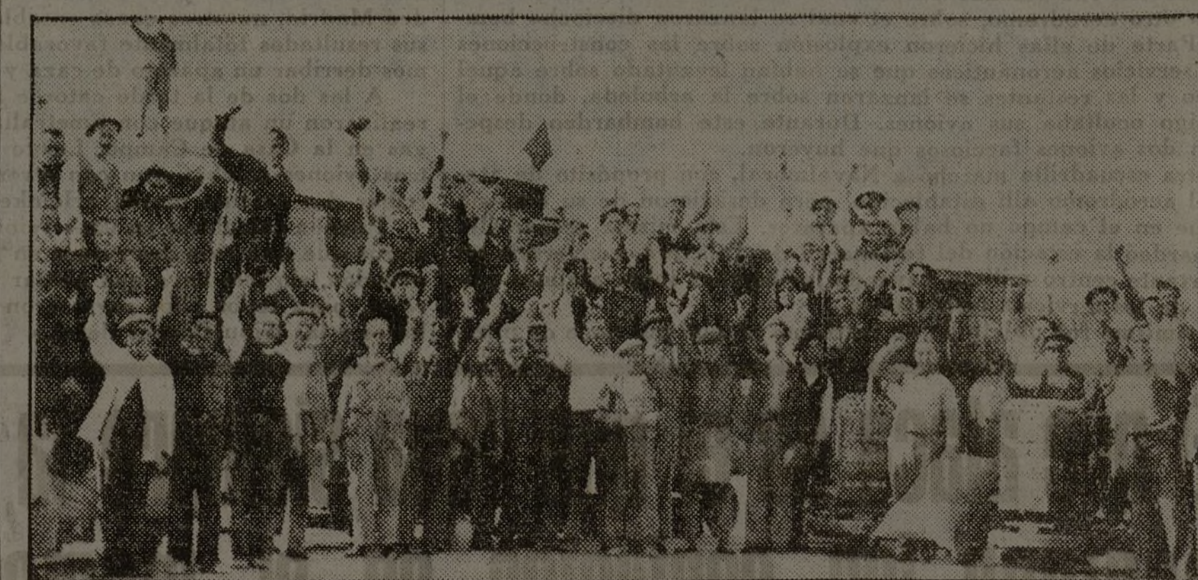
Obreros ferroviarios al terminar la descarga de buena cantidad de provisiones enviadas a la capital por sus provincias hermanas.