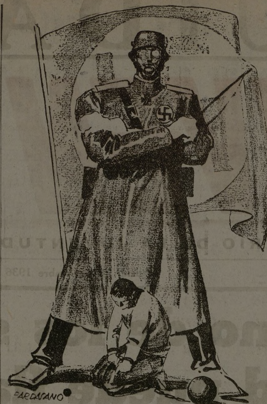
JOVEN CAMARADA: ESTE ES EL PORVENIR QUE TE PROMETEN LOS ASESINOS DE ESPAÑA. SOLO TU FUSIL ES CAPAZ DE EVITARLO

El orador fue ovacionado, y el acto terminó con los gritos de: "¡Viva la victoria del pueblo español!" y "¡Vivan los combatientes de la España libre!"—Fabra.