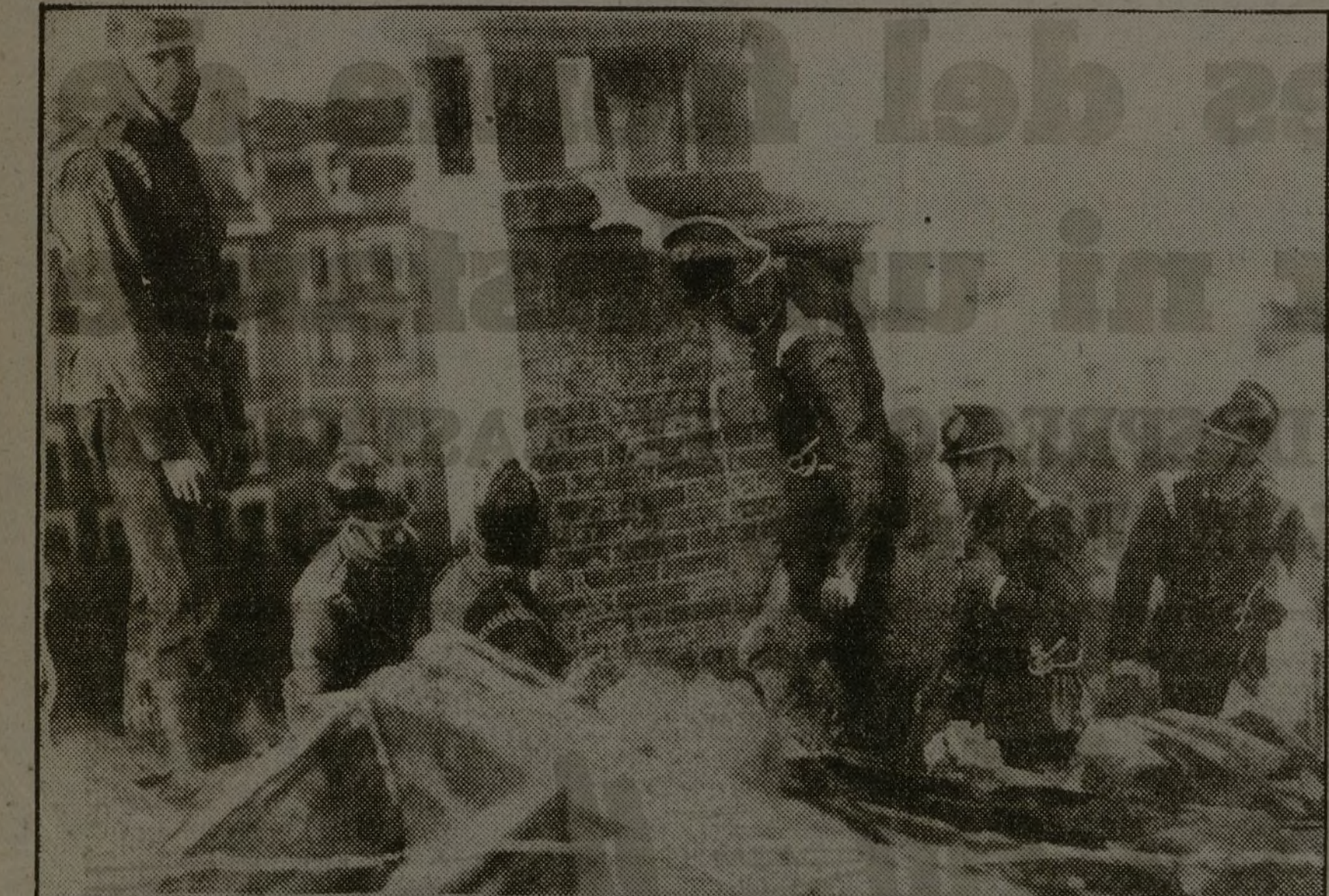
Los bomberos también trabajan con insuperable arrojo por atenuar los daños que causa en sus hogares a la pacífica población civil la furia destructora del enemigo.

EL COMITE CENTRAL DEL PARTIDO COMUNISTA FRANCES