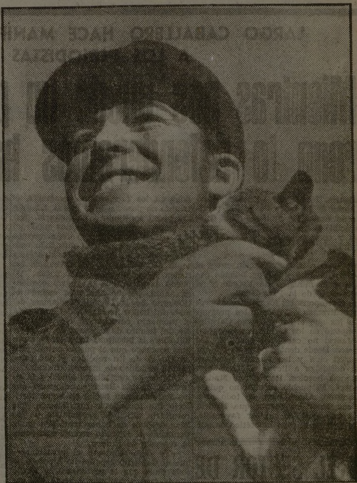
UN MILICIANO CON SU MASCOTA

Optimismo. Frente al sol de otoño, optimismo. Frente a la dura guerra civil, optimismo también. Toda vida nueva tiene que surgir en medio de la violencia. No hay un parto que no sea doloroso... Estos pensamientos parecen concretarse en la sonrisa de nuestro miliciano. La lucha es dura, pero no importa. Optimismo. Después de ella aguarda una vida plena, enriquecida de vigor y libertad.