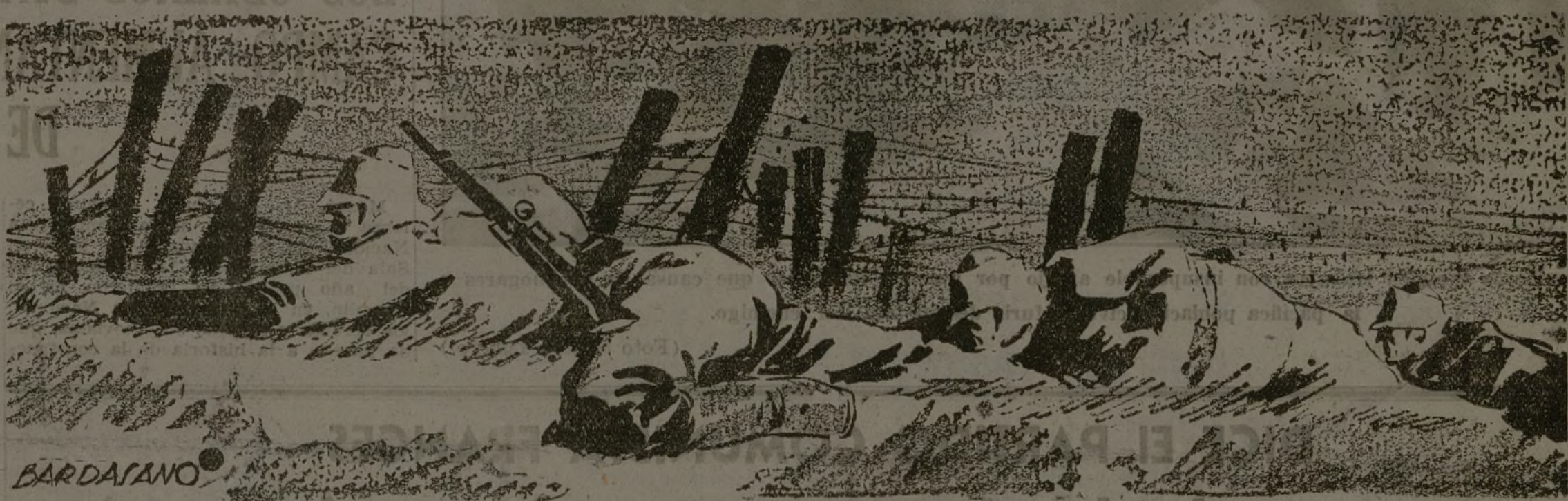
JOVEN COMBATIENTE: CADA MUERTE OCASIONADA POR LOS BOMBARDEOS ENEMIGOS A LA POBLACION CIVIL DEBE SER UN ESTIMULO MAS PARA QUE NO ABANDONES TU FUSIL

En el frente de Madrid no se admiten cobardes ni se admiten indisciplinados