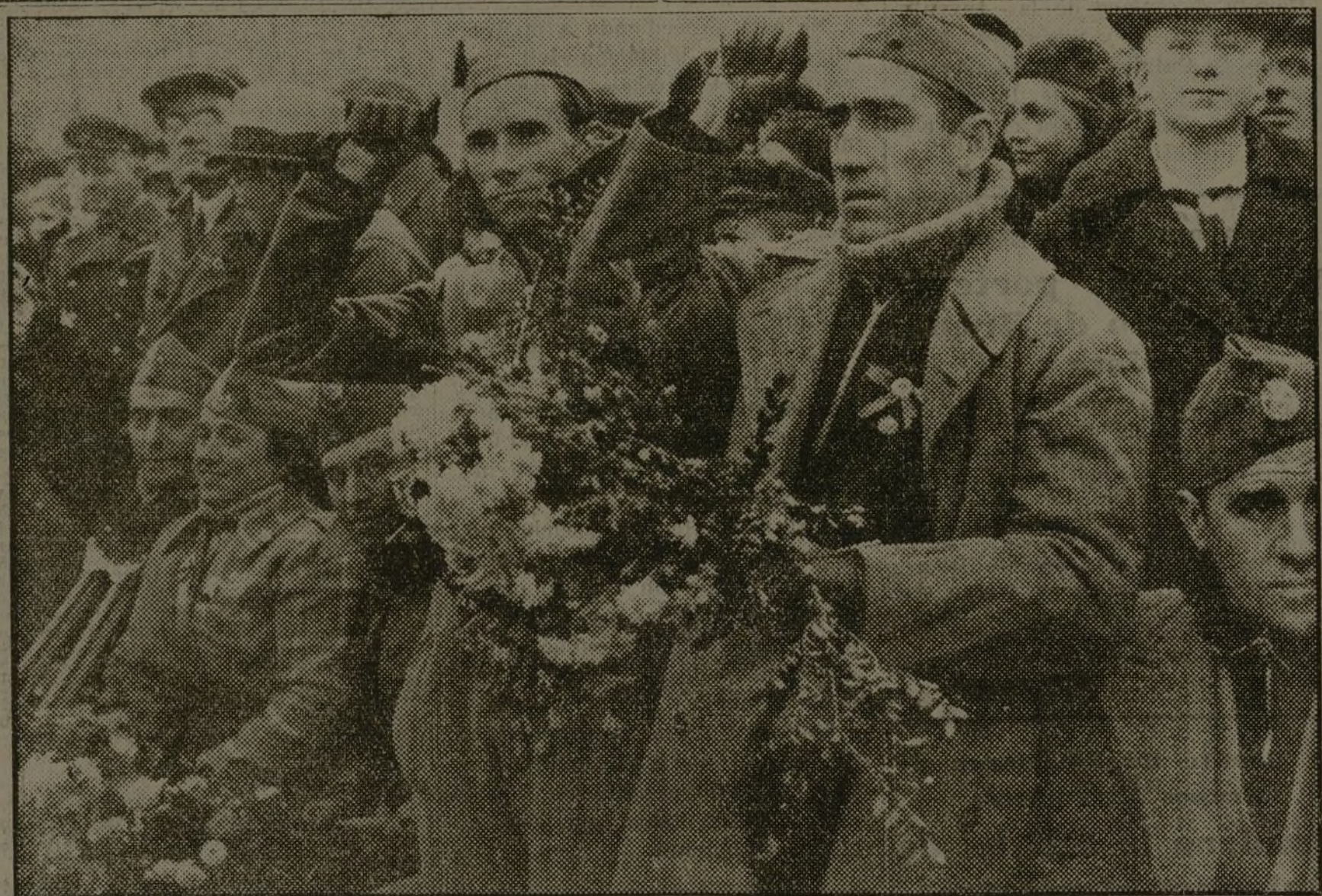
LOS REPRESENTANTES DE LOS COMBATIENTES ESPAÑOLES, EN MOSCU

El proletariado madrileño luchará durante muchos años las consecuencias de un momento de debilidad en la hora actual. Todo el que no realice un trabajo indispensable en la retaguardia debe empuñar las armas y disponerse a cerrar con una acción decisiva la brillante historia de sus luchas sindicales.