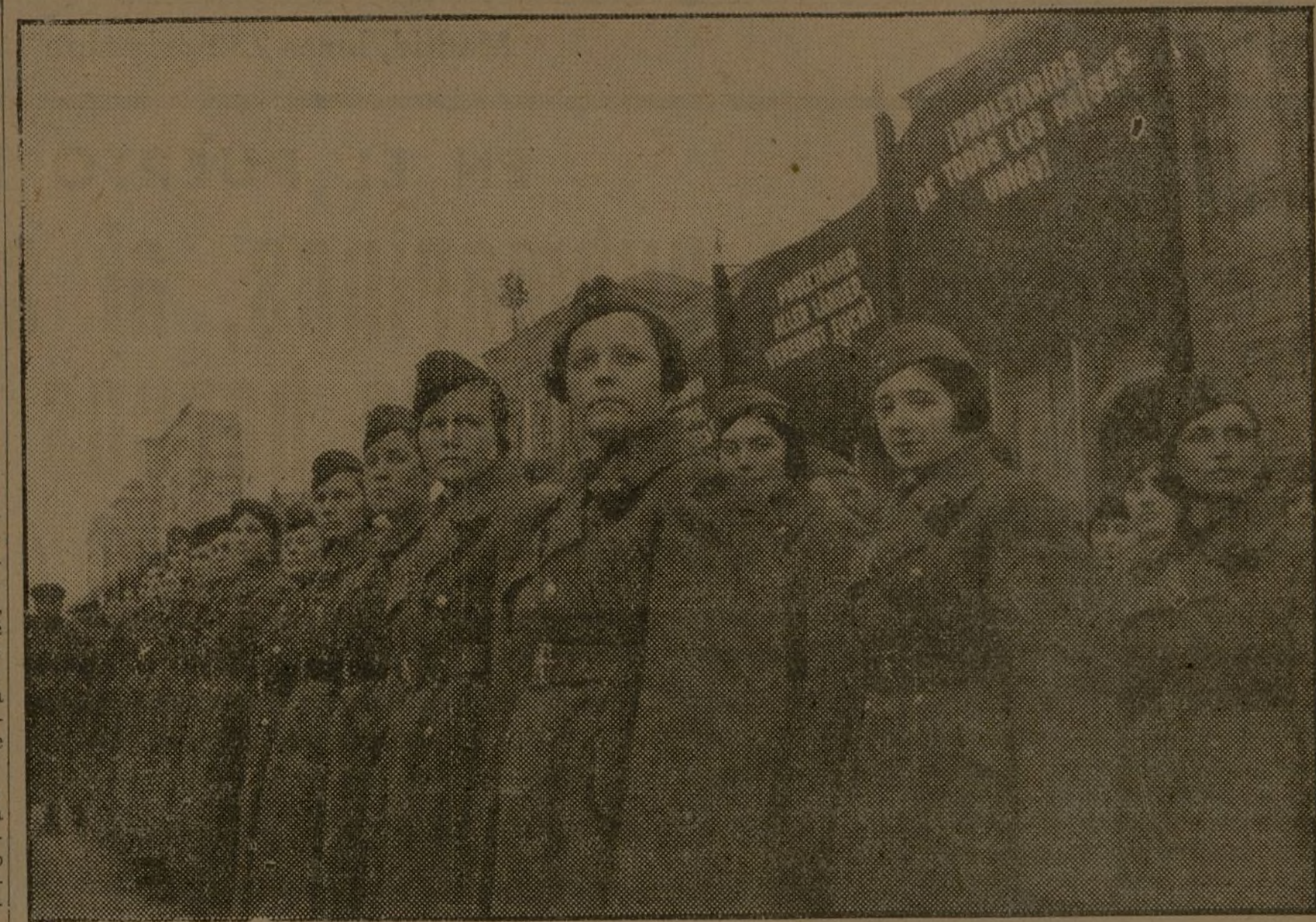
EL ANIVERSARIO DE LA GRAN REVOLUCION DE OCTUBRE EN MOSCU

Redacción y Administración: General Oraa, 5 y 7. — Teléfono 50838