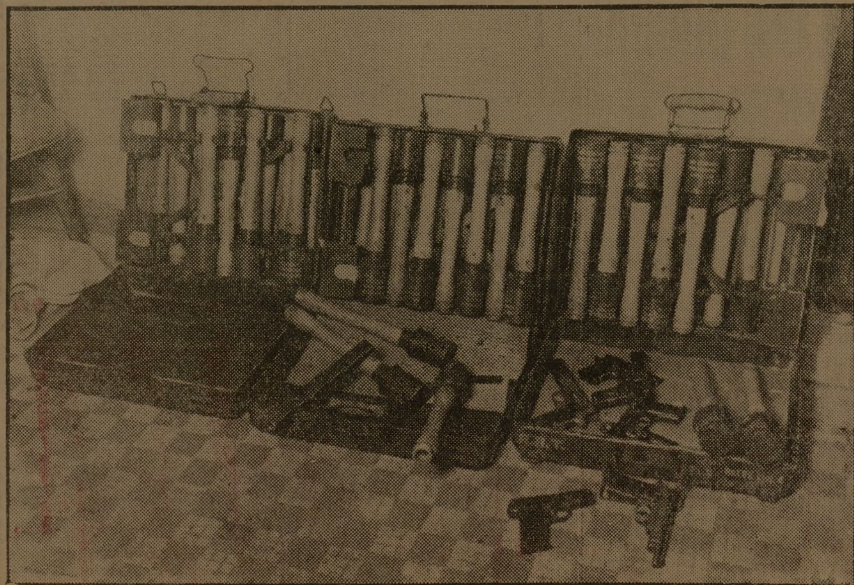
EN LA EMBAJADA ALEMANA.—Bombas y pistolas encontradas al sellar el edificio

Las defensas antiaéreas impidieron que los aviones volasen bajo.—Febus.