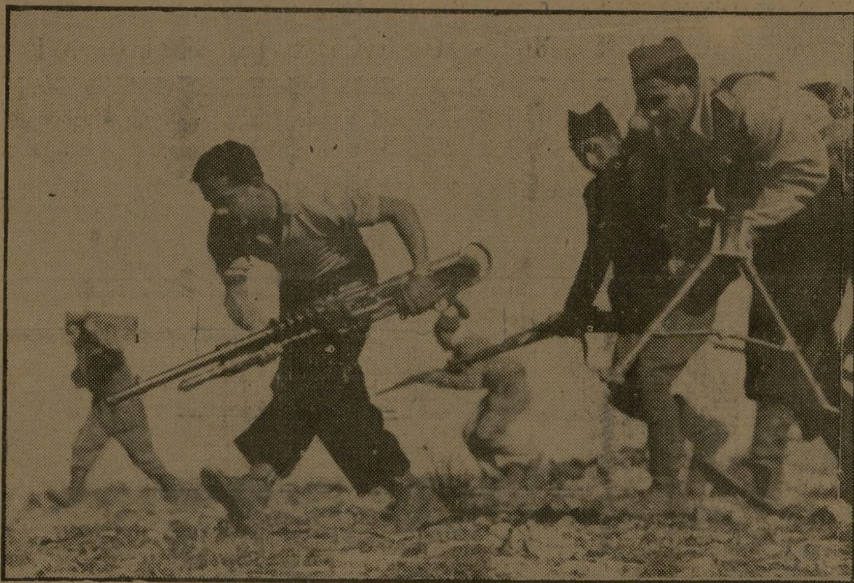
«LOS JOVENES QUE DEFENDEMOS MADRID SOMOS DE ACERO»

El Ejército fascista pretende lanzarse en un desesperado ataque contra la muralla de acero de nuestra defensa ¡Resistamos y se romperá la nuca!