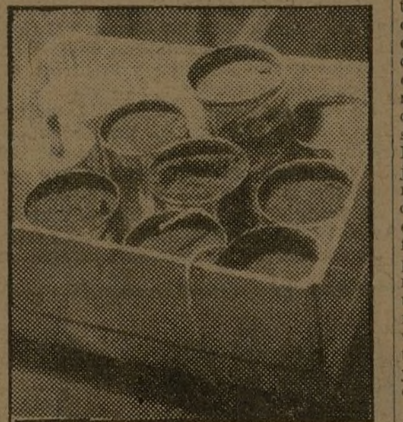
Botes llenos de pólvora preparados para convertirse en bombas.