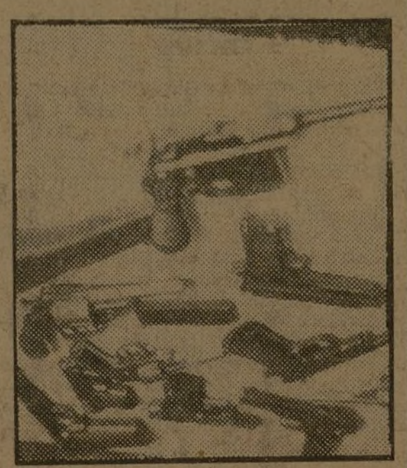
Algunas de las pistolas y pistolas ametralladoras encontradas en la casa de la Embajada de Finlandia.

En los batallones de fortificación se trabaja y, al mismo tiempo, se lucha. (Inscripción en la Carrera de San Jerónimo, 38.)