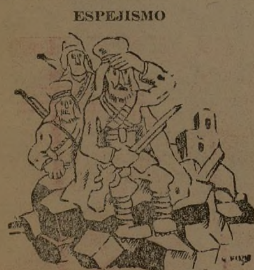
—¡Válgame Abu-el-Selam! Cuanto más nos acercamos a Madrid, más lejos está.

Después el señor Montilla ha condenado la destrucción por las bombas facciosas del sepulcro del cardenal Cisneros, como consecuencia de la destrucción de la iglesia de Alcalá de Henares. Los huesos del fundador de la Universidad de Alcalá quedaron desaparecidos, y han sido ya recogidos y guardados por la Junta en sitio seguro.—Fébus.