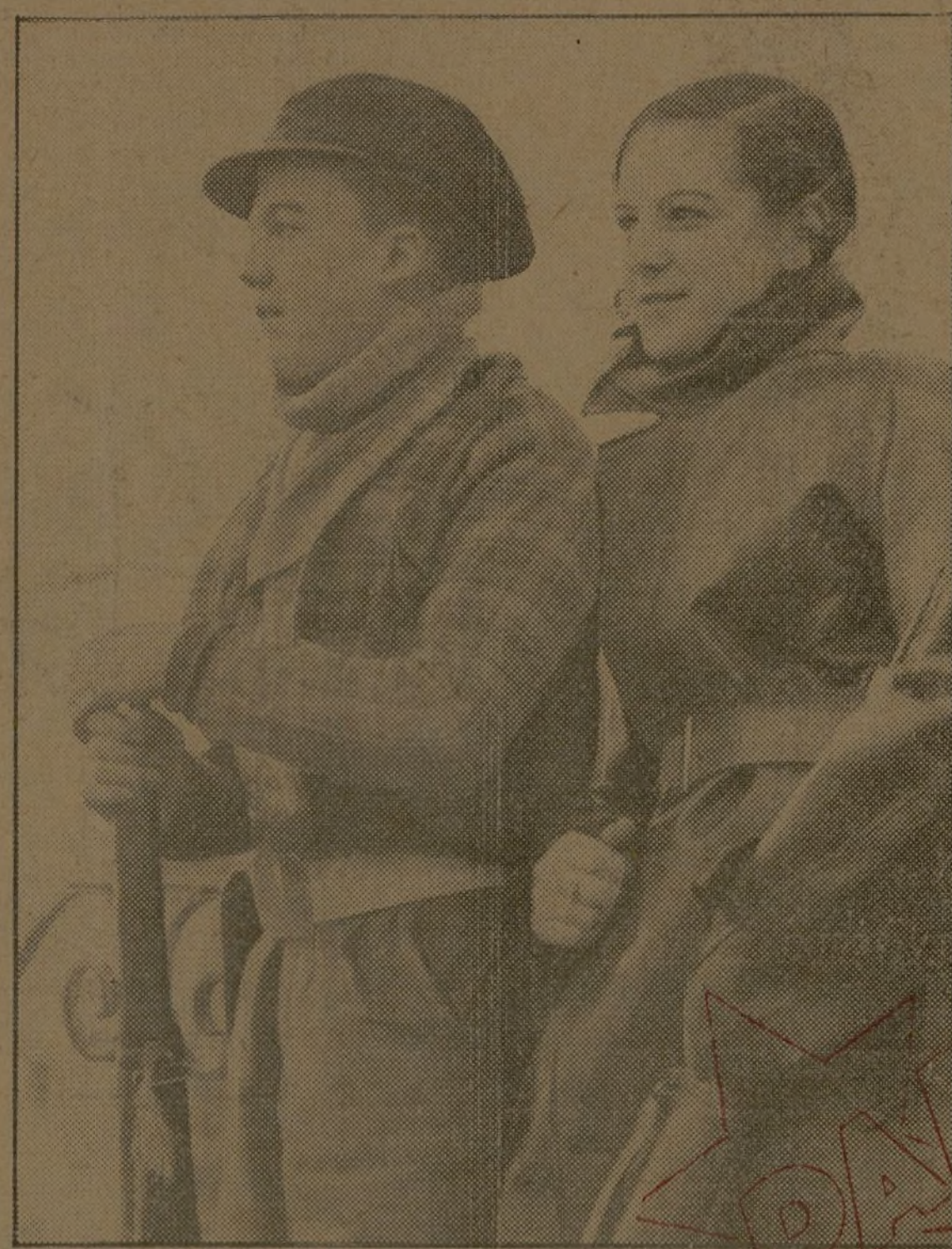
Tienen la serenidad y la alegría de los héroes. Esta es la juventud de España: los que en el mundo son jóvenes de verdad. Al mirar sus caras se reconocerán en ellas. Y nuestras madres, expatriadas de Madrid por la metralla de los viejos opresores, sabrán leer en estas caras su próximo regreso.

Barcelona, 14. — El comunicado del consejero de Defensa dice: «Circunscripción Norte.—Se han pasado a nuestras filas en el sector de Huesca seis soldados con su equipaje, armamento y municiones, otros sin armas y tres paisanos. En Tiers, ligero tiroteo. La posición enemiga de Chumilla ha sido bombardeada por nuestra artillería. La facciosa ha bombardeado nuestra posición de Yogueta, sin resultado. En Fornillos, tiroteo con el enemigo. Sin novedad en las circunscripciones Centro y extremo sur del Ebro.»—Febus.