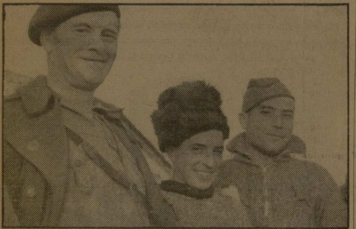
VILLANUEVA DE LA CASADA.—Un joven obrero francés fraternizando con un viejo militante del P. C. alemán y un camarada español del batallón Jaime Gralls.