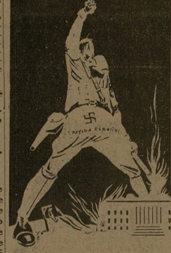
Empezó su debut en el incendio del Reichstag...