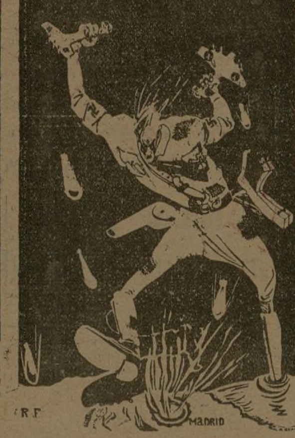
...y continúa su obra incendiaria en toda una ciudad.

“Para ganar la guerra es indispensable que todos los actos de indisciplina, sabotaje o traición sean sancionados sumariamente y en forma ejemplar. La guerra es dura y tiene que hacerse con dureza.”