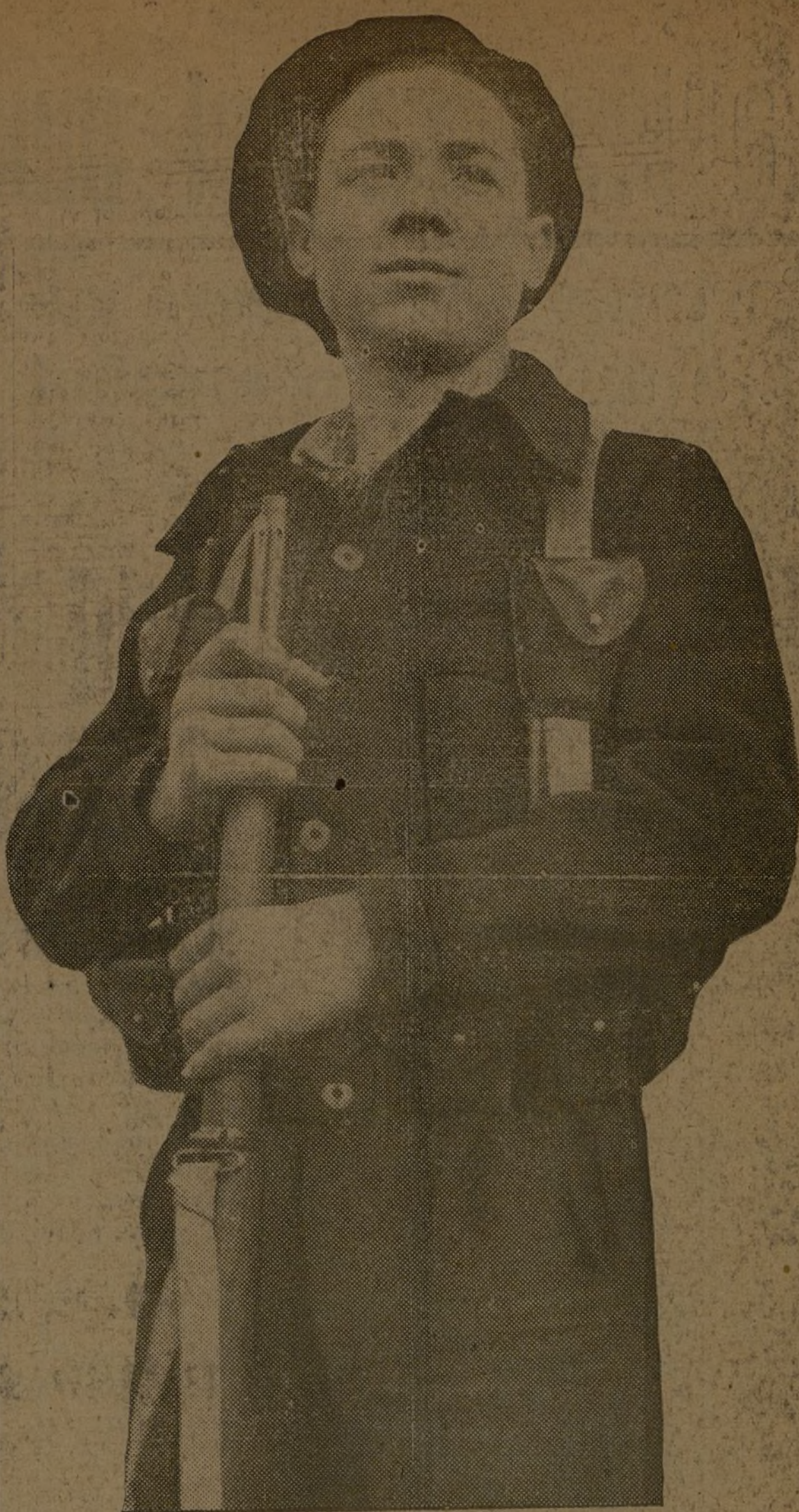
¡BUENA GUARDIA! EN LA NOCHEBUENA

Nuestras tropas están fortificando las posiciones conquistadas. En los demás sectores, sin novedad.